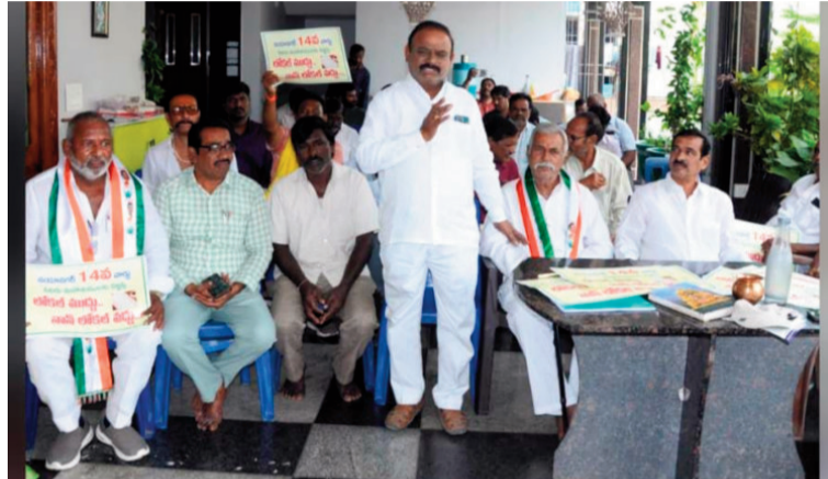
- 14వ వార్డు ప్రజల ఆత్మగౌరవాన్ని దెబ్బతీయవద్దు.