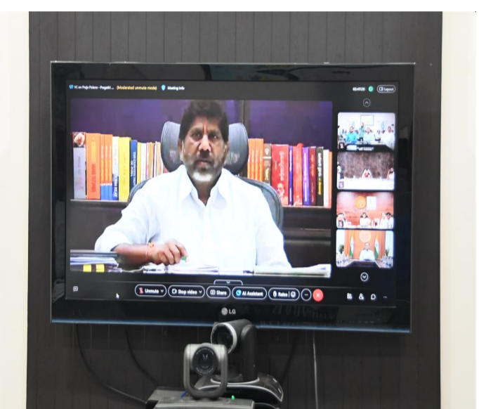
వీడియో కాన్ఫరెన్స్ ద్వారా జిల్లా కలెక్టర్లకు సూచనలు ఇస్తున్న ఉపముఖ్యమంత్రి భట్టి విక్రమార్క

విద్యా ఆరోగ్యంపై ప్రత్యేక దృష్టి ప్రభుత్వ పాఠశాలల్లో చదివే విద్యార్థులకు అల్పాహారంతో పాటు పాలు లేదా రాగిజావ అందించేందుకు ప్రభుత్వం తీసుకుంటున్న చర్యలను ప్రజలకు వివరించాలని భట్టి విక్రమార్క తెలిపారు. సాంస్కృతిక శాఖ కళాకారుల ద్వారా ప్రభుత్వ పథకాలపై గ్రామాల్లో విస్తృత ప్రచారం కల్పించాలని, ప్రజల్లో ప్రభుత్వంపై భరోసా కల్పించేలా అధికారులు క్షేత్రస్థాయిలో పనిచేయాలని ఆదేశించారు. గ్రామ అభివృద్ధి కోసం ప్రభుత్వం విడుదల చేసిన నిధులను సద్వినియోగం చేయాలని, ప్రగతి ప్రణాళిక అమలును కలెక్టర్ల ఎప్పటికప్పుడు పర్యవేక్షించాలని సూచించారు. ఏప్రిల్ 2న రాష్ట్రవ్యాప్త సభలు: సీఎస్ రామకృష్ణారావు