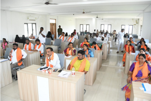
సమావేశానికి హాజరైన కౌన్సిలర్