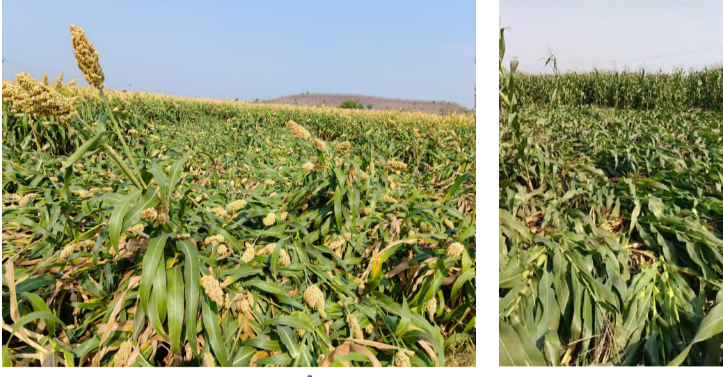
అకాల వర్షానికి నేలకొరిగిన జొన్న మొక్కజొన్న పంటలు నిర్మల్ జిల్లా నర్సాపూర్ జి మార్చ్ 31 అమృత్ తెలంగాణ నర్సాపూర్ జి మండలంలోని నర్సాపూర్ కున్న తిమ్మాపూర్ గ్రామంలో సోమవారం అర్ధరాత్రి ఈదురు గాలులతో కూడిన అకాల వర్షం రైతులకు తీవ్ర నష్టాన్ని మిగిల్చాయి. మండలంలోని రైతులు తమ హిలంలో ఎంతో కష్టపడి మొక్కజొన్న సాగు చేయగా కోతకు సిద్ధంగా ఉన్న తరుణంలో కళ్ళముందే పంట నేలకొరిగడంతో రైతులు కన్నీటి పర్యంతమయ్యారు. అప్పులు తెచ్చి పెట్టుబడి పెడితే, కనీసం అనలు కూడా వచ్చేలా లేదని ఆవేదన వ్యక్తం చేశారు. ప్రభుత్వం తక్షణమే స్పందించి పంట నష్టం అంచనావేసి, తమకు ఆదుకోవాలని బాధిత రైతులు వేడుకుంటున్నారు.