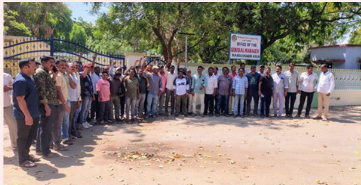
జనోదయ, హనుమకొండ, మార్చి 06:

సింగరేణి ప్రైవేట్ సెక్యూరిటీ గార్డులుగా గత 10 సం.,గా ఏరియాలో విధులు నిర్వహిస్తున్న 213 గార్డులకు టెండర్ కాల పరిమితి ముగిసినందున సాకుతో తమను విధులకు కూరం చేస్తున్నారని వెంటనే విధులు కల్పించాలని డిమాండ్ చేస్తూ సెక్యూరిటీ గార్డులు ఏరియా జిఎం కార్యాలయం ఎదుట శుక్రవారం ధర్నా నిర్వహించారు. ఈ సందర్భంగా ప్రైవేట్ సెక్యూరిటీ గార్డులు మాట్లాడుతూ డివిజన్ లోని ఎన్ఎంఐ పిసి డిపార్ట్ మెంట్ లో కాంట్రాక్ట్ సెక్యూరిటీ విభాగంలో 213 మంది గత పది సంవత్సరాల గా విధులు నిర్వహిస్తున్నామన్నారు. గతంలో సెక్యూరిటీ టెండర్ పొందిన వివిధ వర్గీస్ సెక్యూరిటీ టెండర్ కాల పరిమితి ముగిసినందున, దీంతో సెక్యూరిటీ గార్డులకు ద్యూటీ లను నిలుపుదల చేశారని ఆవేదన వ్యక్తం చేశారు. కొత్త టెండర్ వచ్చినప్పటికీ నేటి వరకు అమలు చేయడంతో 213 మంది గాడ్స్ కుటుంబాలు ఆర్థికంగా ఇబ్బందులు పడుతు కుటుంబ పోషణ ఇబ్బందిగా మారినందున ఆందోళన వ్యక్తం చేశారు. సింగరేణి యాజమాన్యం స్పందించి కొత్తగా వచ్చిన టెండర్ ను వెంటనే అమలు చేసి సెక్యూరిటీ గార్డులను విధుల్లోకి తీసుకోవాలని కోరారు. పాత టెండర్ లో ఉన్న విధంగా 126 షిఫ్టులను కొనసాగించే విధంగా చూడాలని కోరారు. షిఫ్టులను తగ్గిస్తే 213 మందికి ద్యూటీలు రాక ఆర్థిక ఇబ్బందులకు గురవు తున్నామని ఆందోళన వ్యక్తం చేశారు. ఈ కార్యక్రమంలో మండలమరి, బెల్లంపల్లి, రామకృష్ణాపూర్ లకు చెందిన ప్రైవేట్ సెక్యూరిటీ గార్డులు పాల్గొన్నారు.