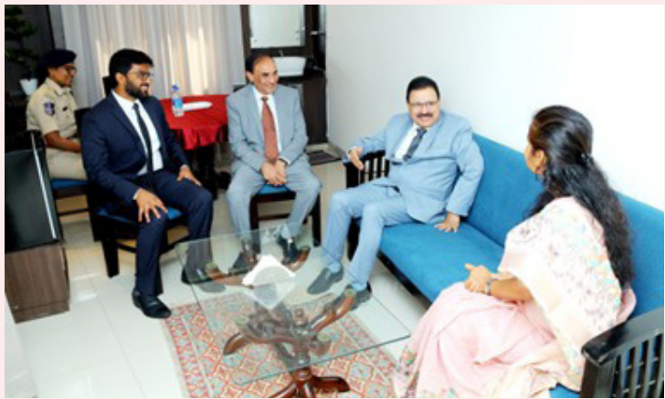
జనోదయ, హనుమకొండ, మార్చి 06: