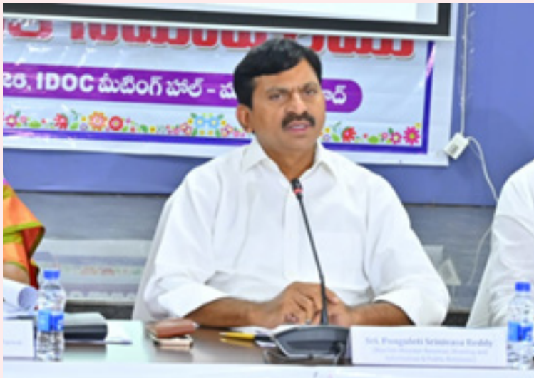
జనోదయ, మహబూబాబాద్, మార్చి 06: