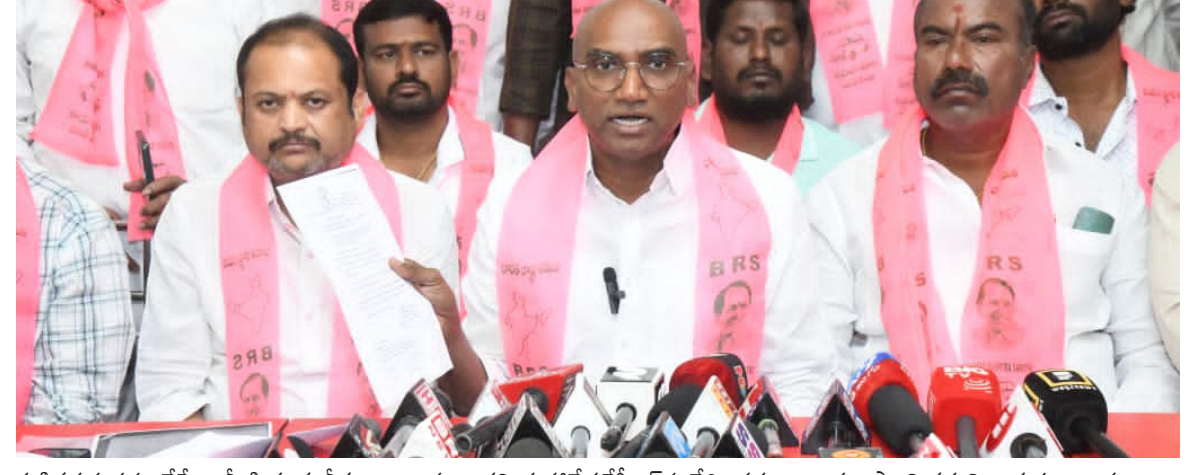
వ్యక్తిగత హాసనం చేసేలా మీడియాకు లీకులు ఇస్తున్నారని, మహానేత కేసీఆర్ ను వేధించడం అప్రజాస్వామికమని ఆయన అన్నారు.