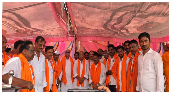
పాల్గొన్న ఆల్ పార్టీ నాయకులు