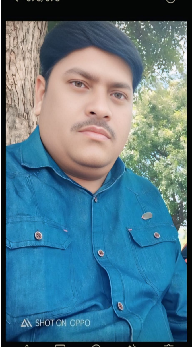
కేవల్ రాములు అమృత్ తెలంగాణ తెలుగు దినపత్రిక నిర్మల్ జిల్లా నిజాంబాద్ బ్యూరో ఇన్చార్జి కాదు; ఇది అంతర్జాతీయ న్యాయవ్యవస్థకు ఒక పరీక్ష. శాంతి మార్గాన్నే ఎంచుకోవాలనే సందేశాన్ని ప్రపంచం గట్టిగా వినిపించాలి అని సమయం ఇది.

ఇరాన్ పై అమెరికా దాడి కేవలం రెండు దేశాల మధ్య ఘర్షణ మాత్రమే