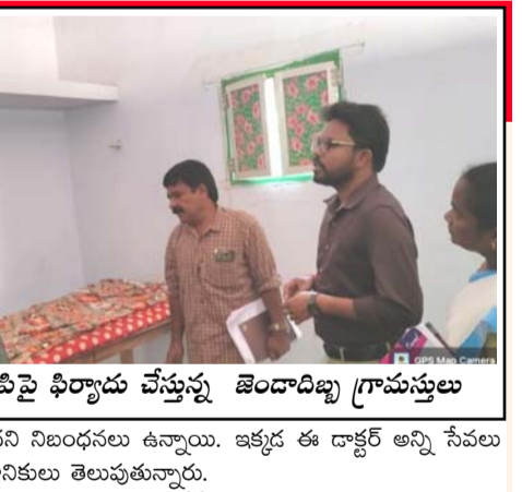
ఆర్ఎంపిపై ఫిర్యాదు చేస్తున్న జెండాబిడ్డ గ్రామస్థులు

సంగం (తెలంగాణ), మార్చి 1 : జెండాబిడ్డ గ్రామపంచాయతీలోని ఆర్ఎంపి డాక్టర్ నిబంధనలకు విరుద్ధంగా వైద్యశాలను నిర్వహిస్తున్నారని స్థానికులు ఆరోపించారు. ఆర్ఎంపి డాక్టర్లపై స్థానికులు ఫిర్యాదు చేశారు. ప్రభుత్వ నిబంధనల ప్రకారం ఆర్ఎంపి డాక్టర్ అంటే, వైద్యశాల పేరు ప్రధమ చికిత్స అలయం సమోదా చేసి ఉండాలి. ఎవరైనా రోగి వచ్చే వచ్చే ప్రధమ చికిత్స మాత్రమే