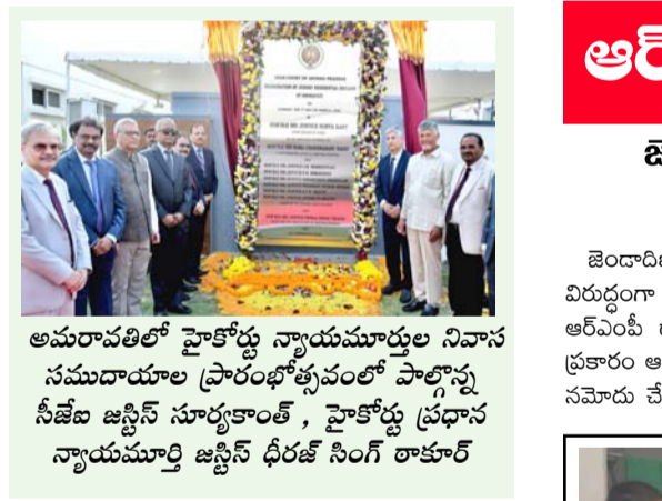
అమరావతిలో వైకేర్ల న్యాయమూర్తుల నివాస సముదాయాల ప్రారంభింపులో పాల్గొన్న సీజీఐ జస్టిస్ సూర్యకాంత్, వైకేర్ల ప్రధాన న్యాయమూర్తి జస్టిస్ ధీరజ్ సింగ్ రాకూర్

రాష్ట్ర ప్రభుత్వం వీరశైవులను బిసి “డి” క్యాటగిరీ కింద గుర్తించిప్పటికే కేంద్ర ప్రభుత్వం “ఓ.బీ.సి” జాబితా లో చేర్చలేదని అన్నారు. వీరశైవులకు రాష్ట్ర రాజధాని అమరావతిలో శ్రీ బసవేశ్వర భవన్ ఏర్పాటు చేయాలని, ప్రముఖ శివాలయాల్లో, క్షేత్రాల్లో వీరశైవులకు నామినేషన్ పదవులు ఇవ్వాలని, ప్రత్యేక వ్యూహం వారికి, ప్రత్యేక వీరశైవ లింగాయత కాలనీలు, వీరశైవుల సాధికారతలో భాగంగా నిధులు మంజూరు చేయాలని కోరారు. దీనికి స్పందించిన వైర్ల తుల్యపూర్ స్వస్థు తిమ్మాపురం వీరశైవుల లింగాయతల “శ్రీ బసవేశ్వర కళ్యాణ మండపం” నిర్మాణానికి తగిన ఆర్థిక, సహాయ, సహకారాలు అందిస్తామన్నారు. డిమాండ్లను ప్రభుత్వ ఉన్నతాధికారులు, ప్రజా ప్రతినిధుల దృష్టికి తీసుకు వెళ్లి పరిష్కారానికి కృషి చేస్తామని హామీ ఇచ్చారు. ఈ కార్యక్రమంలో గ్రామ వీరశైవ లింగాయత కమ్యూనిటీ పెద్దలు, మహిళలు పెద్ద ఎత్తున పాల్గొన్నారు.