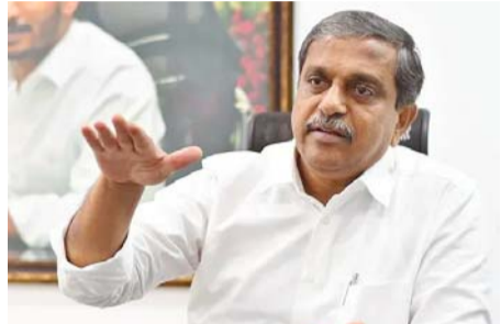
తాడేపల్లి (తెలుగోడు), మార్చి 1 :