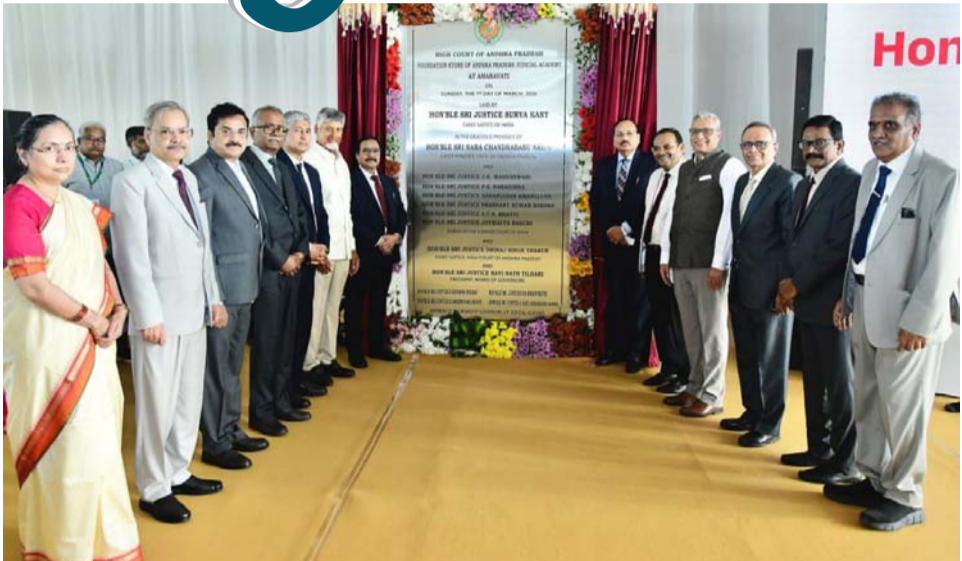
అమరావతి (తెలుగోడు), మార్చి 1 :

అమరావతిలోని ఆంధ్రప్రదేశ్ ఉన్నత న్యాయస్థానం సమీపంలో నిర్మించబడుతున్న అతిథి గృహానికి ఘనంగా శంకుస్థాపన జరిగింది. భారత దేశ సర్వోన్నత న్యాయస్థానం ప్రధాన న్యాయమూర్తి జస్టిస్ సూర్యకాంత్ ప్రధాన అతిథిగా హాజరై శంకుస్థాపన చేశారు. ఈ కార్యక్రమంలో రాష్ట్ర ముఖ్యమంత్రి నారా చంద్రబాబు నాయుడు, ఉన్నత న్యాయస్థానం ప్రధాన న్యాయమూర్తి, ఇతర న్యాయమూర్తులు, ప్రజాప్రతినిధులు, ఉన్నతాధికారులు పాల్గొన్నారు. ఉన్నత న్యాయస్థానం సమీపంలో నిర్మించబడుతున్న ఈ అతిథి గృహం న్యాయమూర్తులు, ఇతర రాష్ట్రాల నుంచి వచ్చే న్యాయవర్గ ప్రతినిధులు, విశిష్ట అతిథులకు సౌకర్యవంతమైన వసతి కల్పించే విధంగా రూపుదిద్దుకోనుంది. విశాల గదులు, సమావేశాల