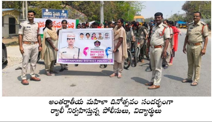
అంతర్జాతీయ మహిళా దినోత్సవం సందర్భంగా రాష్ట్ర నిర్వహిస్తున్న పోలీసులు, విద్యార్థులు