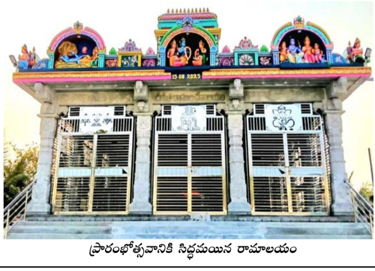
ప్రారంభోత్సవానికి సిద్ధమయిన రామాలయం

కనేకల్ పట్టణంలోని తారక రామనగర్ లో నూతనంగా నిర్మిస్తున్న శ్రీ సీతారామ దేవాలయంలో శ్రీ మహాగణపతి, శ్రీ వేంకటేశ్వర, శ్రీ సీతారామ లక్ష్మణ హనుమంతుల సమేత, సందీశ్వర రుద్ర, నవగ్రహ, ద్వాజ, శిఖర (కలశ) దేవతల విగ్రహ ప్రతిష్ఠా మహోత్సవాలు మార్చి 6, 7, 8 తేదీలలో వైభవంగా నిర్వహించనున్నారు. ఈ కార్యక్రమాలకు పట్టణంలోని అన్ని కుటుంబాలు హాజరయ్యేలా కమిటీ సభ్యులు భక్తిచర్చలతో ఆహ్వానిస్తున్నారు. మార్చి 6వ తేదీ శుక్రవారం ఉదయం 6 గంటలకు వరదల పూజ, మహాగణపతి పూజలతో కార్యక్రమాలు ప్రారంభమవుతాయి. అనంతరం యాగశాల ప్రవేశం, వివిధ మండల పూజలు, హోమాలు, ప్రత్యేక పూజలు నిర్వహించబడుతుంది. మార్చి 7వ తేదీ శనివారం రుద్ర హోమం, నవగ్రహ హోమం, లక్ష్మీ గణపతి హోమం తదితర విశేష హోమాలు నిర్వహించబడుతుంది. మార్చి 8వ తేదీ ఆదివారం తెల్లవారజామున యంత్ర స్థాపన, విగ్రహ ప్రతిష్ఠాపన, ప్రతిష్ఠా హోమం, పూర్ణాహుతి కార్యక్రమాలు నిర్వహించనున్నారు. మార్చి 5వ తేదీ సాయంత్రం 4 గంటలకు శ్రీ చిక్కవేళ్ల స్వామి గుడి నుండి ఉత్సవ విగ్రహాలు, మహిళలతో కలకాలతో భగవంతుడు ఊరేగింపు నిర్వహించబడుతుంది. ఈ సందర్భంగా భక్తులు 116 కలకాలాలతో పాల్గొనవలసిందిగా దేవాలయ కమిటీ విజ్ఞప్తి చేస్తోంది. మూడు రోజుల పాటు భక్తులు అన్నప్రసాద వసతి కల్పించబడుతుంది. వేద వదితుల అధ్యక్షుల దేవాలయ కమిటీ వారు ఈ కార్యక్రమాలను భక్తిచర్చలతో నిర్వహించనున్నారు. భక్తులు కుటుంబ సమేతంగా విచ్చేసి ప్రతిష్ఠా మహోత్సవాలను విజయవంతం చేయగలరని ఆలయ కమిటీ వారు కోరారు.