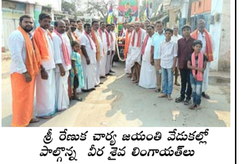
శ్రీ రేణుక చార్య జయంతి వేడుకల్లో పాల్గొన్న వీర శైవ లింగాయతలు