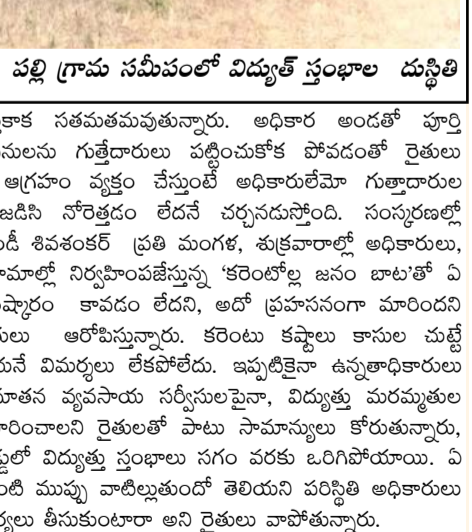
తిప్పారెడ్డి పల్లి గ్రామ సమీపంలో విద్యుత్ స్తంభాల దుస్థితి

యాడికి (తెలంగాణ), మార్చి 1 : యాడికి మండలంలోని పలు ప్రాంతాల్లో విద్యుత్ సరఫరా ప్రమాద ఘంటికల మోగిస్తున్నాయి. వేలాలుతున్న విద్యుత్ తీగలు మృత్యుపాశాలై పురాయి. పంట పొలాల్లోని విద్యుత్తు ప్రంభాలు సగం వరకు ఒరిగిపోయాయి. ఏ క్షణంలో ఎలాంటి ముప్పు వాటిల్లుతుందో తెలియని పరిస్థితి. అయినా సంబంధిత శాఖ అధికారులకు వీమకట్టినట్లున్నా లేదు. ఇటీవల తిప్పారెడ్డిపల్లిలో పశుగ్రామం తరలిస్తూండగా (ట్రాక్టర్ పైన విద్యుత్తు తీగలు తాకడంతో) పెద్ద ఎత్తున మంటలు చెలరేగిన విషయం విదితమే. ప్రాణాపాయం తప్పకపోతే గ్రామస్థులు ఊరికి పారిపోతారు. ఈ విద్యుత్తు లైను మార్చి వసలకు ఉన్నతాధికారులు అనుమతిచ్చినా గుత్తేదారు పనులుప్రారంభించకపోవడంతో ఇలాంటి ప్రమాదాలు తరచుతున్నాయని గ్రామస్థులు వాపోతున్నారు.