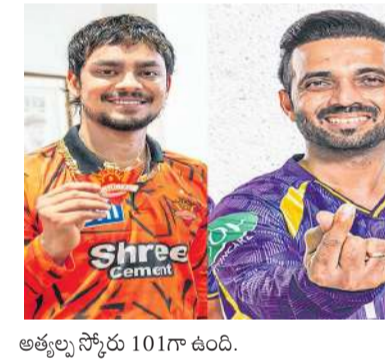
అత్యల్ప స్కోరు 101గా ఉంది.

ఇప్పటికే చూపించు కున్నారు. మరోవైపు కేఆర్ బౌలింగ్ పరిస్థితి కూడా ఇబ్బందికరంగానే ఉంది. వైభవ్ తేలిపోగా, ముజరబానికి తగినంత అనుభవం లేదు. వరుణ్ కూడా భాగీగా పరుగులివ్వడంతో టీమ్ లో ఆందోళన రేపి అంతం. బ్యాటింగ్ లో రహనే, అలెన్ తుభారంభం అందించాల్సి ఉంది. ఐపీఎల్ లో కోల్ కతా, హైదరాబాద్ మధ్య 30 మ్యాచ్ లు జరిగాయి. 20 మ్యాచ్ లో కోల్ కతా, 10 మ్యాచ్ లో హైదరాబాద్ గెలిచింది. కోల్ కతాపై హైదరాబాద్ అత్యధిక స్కోరు 278 కాగా, అత్యల్ప స్కోరు 113. హైదరాబాద్ పై కోల్ కతా అత్యధిక స్కోరు 208 కాగా,