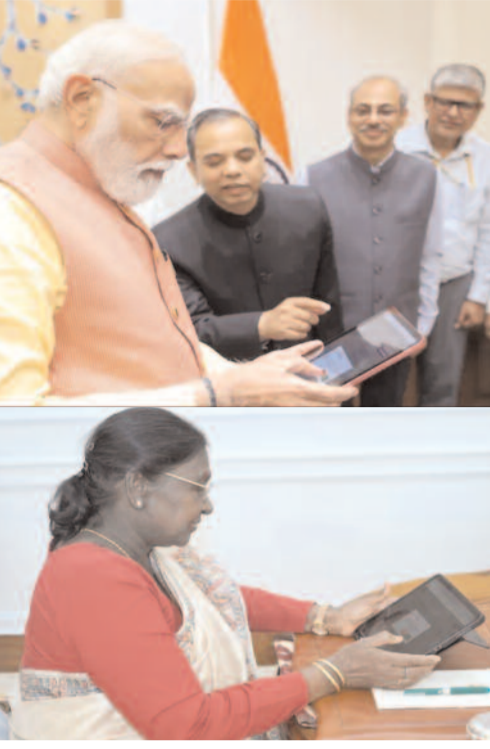
రెండు దశల్లో ప్రక్రియ - 16 భాషల్లో యాప్

కూడా డిజిటల్ పద్ధతిలో వివరాలు సమర్పించారు. దేశాభివృద్ధిలో కీలకమైన ఈ ప్రక్రియలో ప్రజలందరూ భాగస్వాములు కావాలని ప్రధాని పిలుపునిచ్చారు. వీరితో పాటు ఉపరాష్ట్రపతి సీపీ రాధాకృష్ణన్, కేంద్ర హోంమంత్రి అమిత్ షా కూడా తమ వివరాలను ఆన్లైన్లో సమోదు చేసుకున్నారు. అధికారుల గణాంకాల ప్రకారం, జనగణన ప్రారంభమైన తొలిరోజే సుమారు 55 వేల కుటుంబాలు స్వీయ సమోదు సదుపాయాన్ని వినియోగించుకోవడం విశేషం.