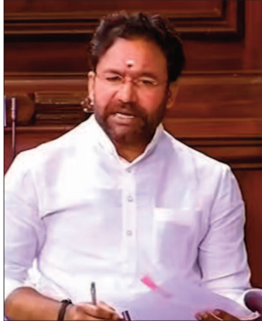
పనులకు వాడాలని.. అన్ టైడ్ గ్రాంట్ నిధులను స్థానిక అవసరాలకు అనుగుణంగా గ్రామసభల తీర్మానాల మేరకు ఖర్చు చేయవచ్చని సూచించారు. గత ప్రభుత్వాలు కేంద్ర నిధులను పక్కవారి పట్టించారు, ప్రస్తుత ప్రభుత్వం అలా చేయకుండా వచ్చే అభివృద్ధికి సహకరించాలని కోరారు. రాజీయే బద్దేశ్యాలే తెలంగాణ పంచాయతీలకు సుమారు రూ. 9,968 కోట్లు గ్రాంట్లు అందనున్నాయని ఆయన వెల్లడించారు.

కేంద్రం నుంచి నిధులు అందిన వెంటనే రాష్ట్ర ప్రభుత్వం పది పనినిచాలాలోపు ఆయా పంచాయతీలకు బదిలీ చేయాలని కిషన్ రెడ్డి స్పష్టం చేశారు. అలస్యమైతే వడ్డీతో కలిపి చెల్లించాల్సి ఉంటుందని హెచ్చరించారు. టైడ్ గ్రాంట్ నిధులను రోడ్డు, తాగునీరు, పారిశుధ్యం వంటి