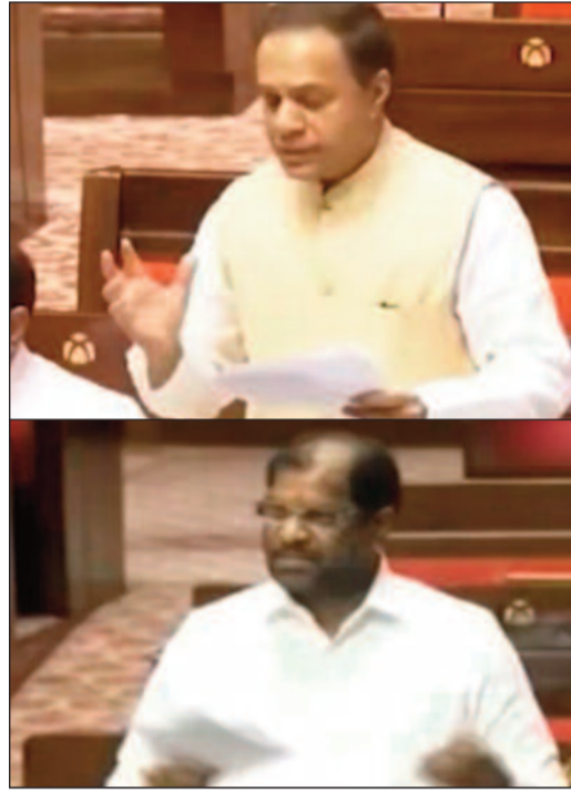
ఇప్పటికైనా విభజన చట్టం ప్రకారం హామీలు అమలు చేయాలని రాజ్యసభ సాక్షిగా ఎంపీలు డిమాండ్ చేశారు.

కాశీశ్వరం అంటే కేవలం ఒక డ్యాం కాదని.. అది కోట్ల మంది ఆశ అని ఎంపీ పేర్కొన్నారు. కేంద్ర మంత్రి సీఆర్ పాటిల్ లక్ష కోట్ల పోయాయని చేసిన వ్యాఖ్యలపై ఆగ్రహం వ్యక్తం చేస్తూ.. ఆయన తెలంగాణ ప్రజలకు క్షమాపణ చెప్పాలని డిమాండ్ చేశారు. ఆ వ్యాఖ్యలను వెంటనే రికార్డుల నుంచి తొలగించాలన్నారు. కాశీశ్వరంలో కూలిన రెండు పిల్లలను 300 కోట్లతో భాగ చేయవచ్చని తెలిపారు. గత 12 ఏళ్లుగా తెలంగాణకు కేంద్రం ఎలాంటి సహాయం చేయకపోయినా రాష్ట్రం అభివృద్ధి చెందుతోందని..