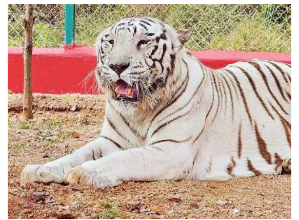
హనుమకొండ జూపార్కులో తెల్లపులి మృతి >> 3లో