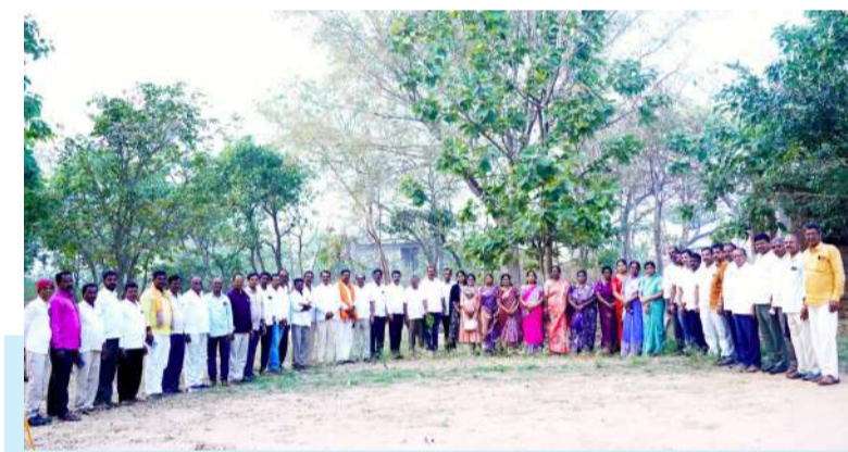
ఆత్మీయ సమ్మేళనంలో మాటకొండూరు జిల్లా పరిషత్ పూర్వ విద్యార్థులు