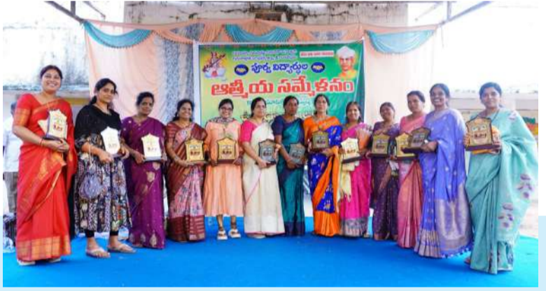
సందడి చేసిన పూర్వ విద్యార్థులు