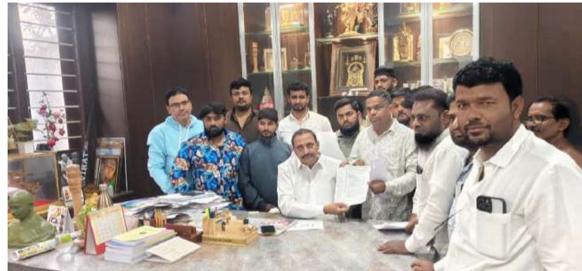
ఎమ్మెల్యే గాంధీని కలిసి పిర్యాదు చేస్తున్న మోటి మనీడు, ఈ ధామి ముస్లింల కమిటీ సభ్యులు

ముస్లింల కమ్యూనిటీ ఆధిపత్యంలో ఉందన్నారు. ఇటీవల కొందరు గుర్తుతెలియని వ్యక్తులు మలపైడి ఉద్దేశంతో ఈ భూమిని ఆక్రమించుకొనడానికి ప్రయత్నిస్తున్నారని తెలిపారు. అధికారులు తక్షణమే స్పందించి, ఆక్రమణదారులపై కఠిన చర్యలు తీసుకోవాలని, ఈ ధామి భూమికి రక్షణ కల్పించాలని కమిటీ సభ్యులు డిమాండ్ చేశారు. ఒకవేళ ఆక్రమణదారులు తమ ప్రయత్నాలను విరమించుకోకపోతే, చట్టపరంగా కఠిన చర్యలు తీసుకోవాలని వారు కోరారు. ఈ కార్యక్రమంలో మోటి మనీడు, ఈ ధామి ముస్లింల కమిటీ ప్రతినిధులు, స్థానిక సభ్యులు పాల్గొన్నారు.