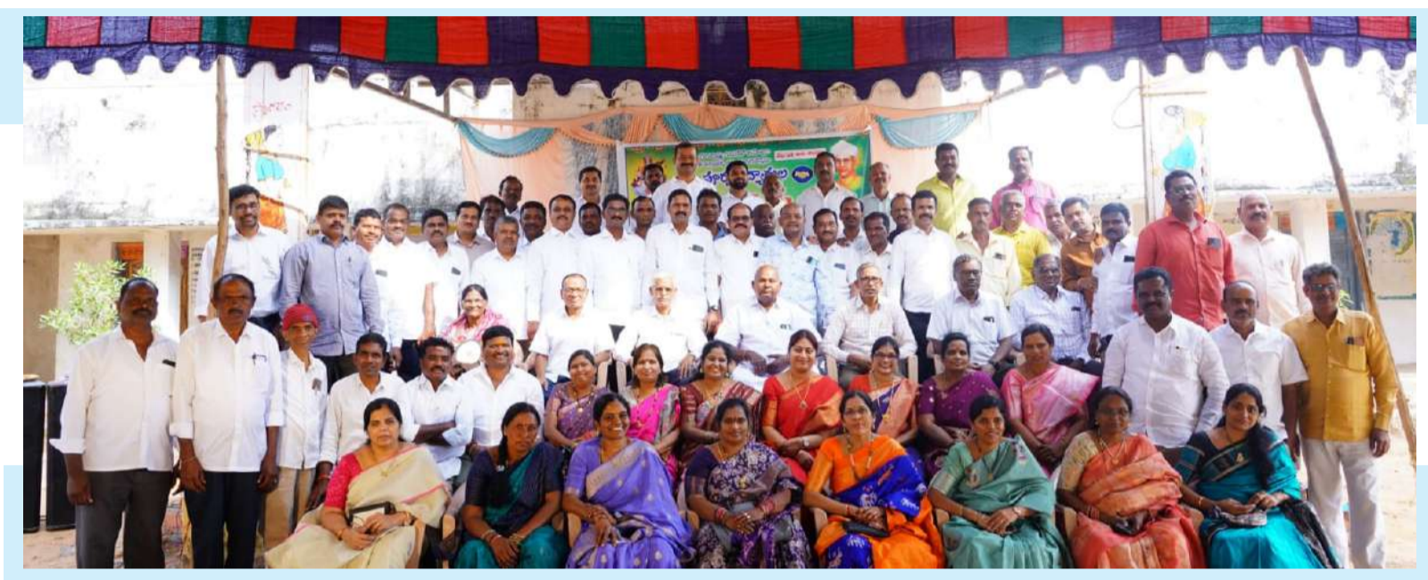
చదువు చెప్పిన ఉపాధ్యాయులతో కలిసి పూర్వ విద్యార్థులు