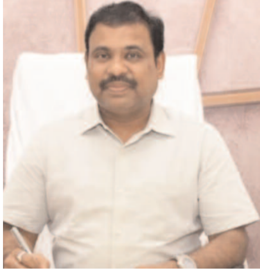
పని ప్రదేశాలలో అంతర్గత కమిటీలు ఏర్పాటు చేయాలని, మహిళలపై లైంగిక వేధింపుల నిరోధానికి అందరం సమిష్టిగా కృషి చేద్దామని తెలిపారు. మహిళలపై లైంగిక వేధింపుల నివారణ చట్టాన్ని సమర్థవంతంగా అమలు

చేసేందుకు జిల్లా మహిళా సాధికారత కేంద్రం ద్వారా విస్తృతస్థాయిలో చర్యలు చేపట్టడం జరుగుతుందని తెలిపారు. పోస్ట్ చట్టం, అంతర్గత ఫిర్యాదు కమిటీ ఉద్దేశం, హక్కులు, ఫిర్యాదు విధానం, కమిటీ నిర్మాణం, బాధ్యతలు వంటి అంశాలపై అధికారులు, ఉద్యోగులకు స్పష్టమైన అవగాహన కల్పించడం జరుగుతుందని, కమిటీ వివరాలను నిర్దిష్ట ఫారం ద్వారా సేకరించి సంబంధిత సమాచారాన్ని షీ బాక్స్ పోర్టల్ లో నమోదు చేయడం జరుగుతుందని తెలిపారు. జిల్లాలోని వివిధ ప్రభుత్వ, ప్రైవేట్ సంస్థలలో ఇప్పటివరకు 47 అంతర్గత ఫిర్యాదు కమిటీలు ఏర్పాటు చేయడం జరిగిందని, వీటిలో ప్రభుత్వ జిల్లా స్థాయి కార్యాలయాలలో 30 కమిటీలు, ఉప జిల్లాస్థాయి కార్యాలయాలలో 16, ప్రైవేట్ సంస్థలు, షాపింగ్ మాల్స్, దుకాణాలలో 1 కమిటీ పనిచేస్తున్నాయని తెలిపారు. ప్రైవేట్ సంస్థలు తమ సంస్థలలో కమిటీలు ఏర్పాటు చేయాలని, జిల్లా సంక్షేమ శాఖ కార్యాలయం, షీ బాక్స్ పోర్టల్ లో నమోదు చేసుకోవాలని తెలిపారు. పోస్ట్ చట్టం అమలుతో మహిళలకు పని ప్రదేశాలు సురక్షితంగా మారతాయని, ప్రతి మహిళ తన హక్కులను తెలుసుకొని ధైర్యంగా ముందుకు రావాలని తెలిపారు