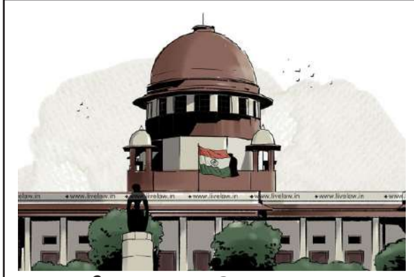
నీట్ పీజీ కటాఫ్ తగ్గింపుపై కేంద్రానికి సుప్రీం నోటీసు >> 3లో