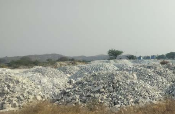
ఖనిజాన్ని వెలికితీసే సారంగం