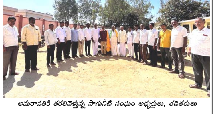
అమరావతికి తరలివెళ్తున్న సాగునీటి సంఘం అధ్యక్షులు, తదితరులు