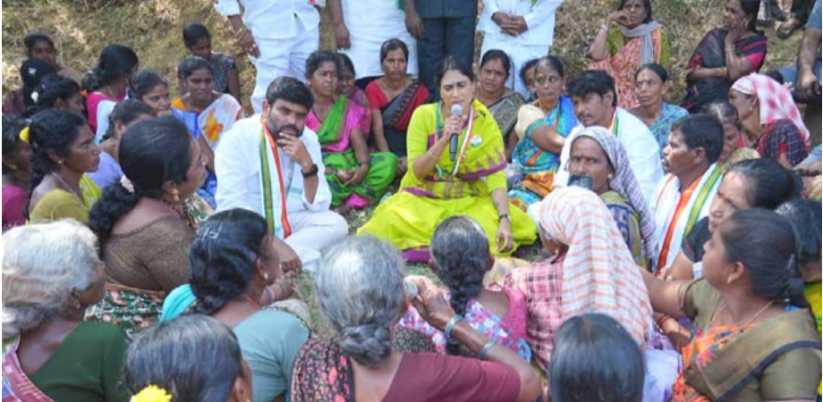
(మొదటి పేజీ (తరువాతి))

ఉపాధి హామీ చట్టం ప్రకారం వంద రోజుల పని కల్పించాలని బాధ్యత కేంద్రానిదేసిన గుర్తు చేశారు. కానీ నేడు చేశావచ్చాం (శ్రామికులకు సగం రోజుల పని కూడా దక్కని దయనీయ పరిస్థితి నెలకొందని ఆగ్రహం వ్యక్తం చేశారు. నిధులు తగ్గించడం, బిల్లులు ఆవడం, చెల్లింపులు ఆలస్యం చేయడం ద్వారా పేదలను ఆకలిచావుల వైపు నెట్టిస్తోందని కేంద్ర ప్రభుత్వాన్ని తీవ్రంగా దుయ్యబట్టారు. అత్యంత కలిగిన పేదల జాబ్ కార్డులను ఎటువంటి నోటీసు లేకుండా తొలగించడం ఘోరమైన అన్యాయమని పట్టణ అన్నాడు. కోట్లాది గ్రామీణ కుటుంబాలను ఉపాధి నుంచి దూరం చేయడమే కేంద్ర ప్రభుత్వ అసలైన లక్ష్యమని విమర్శించారు. కార్పొరేట్ వర్గాలకు వేల కోట్ల రూపాయల రాబులు ఇస్తున్న కేంద్రం, పేదల కోసం ఖర్చు చేయాలని నిధులను కట్టించడం దుర్మార్గమని తీవ్ర వ్యాఖ్యలు చేశారు. గ్రామ స్థాయిలో చట్ట మార్పుల