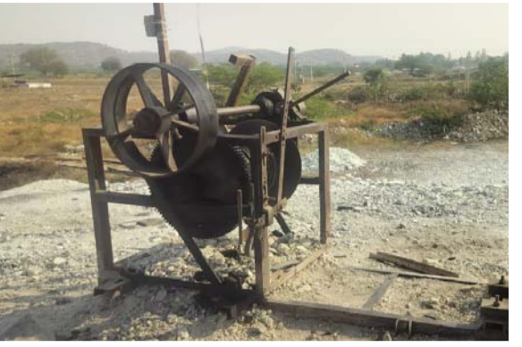
ఖనిజాన్ని వెలికితీసే సారంగం

పట్టించుకోవడం లేదు. ఏదైనా జరగడానిది జరిగితే సంబంధిత అధికారులు చేసే హడావుడిని తగ్గించడానికి వారి చేతులు తడిపి వీరి చేతులు దులుపుకుంటున్నారు. ఇక రాయల్టీల విషయంలో కొందరి అక్రమాల చూస్తే సంబంధిత అధికారులకే మతి పోతోంది. ప్రభుత్వం నిబంధనలు కఠినతరం చేసేకొద్దీ అక్రమార్కులు వక్రమార్గాలు ఎంచుకుంటూ ప్రభుత్వానికి చెల్లించాల్సిన రాయల్టీ సొమ్మును దోచుకొని దాచుకుంటున్నారు. ఏ ప్రభుత్వం వస్తే ఆ ప్రభుత్వ పెద్దలను అడ్డం పెట్టుకొని ఖనిజ దోపిడీని యధేచ్ఛగా సాగిస్తున్నారు. కొందరు కొండుపల్లిలో దొంగల్లాటలు దొరల్లా వ్యవహరిస్తున్నారని విమర్శలు వెల్లువెత్తుతున్నాయి. సమస్యయానికి సమూల సమాధి..