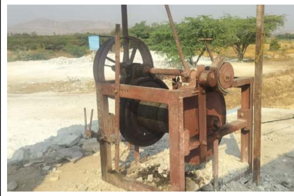
తనిఖీలకు వస్తారని తిప్పేసిన విడదీసిన యంత్రాలు