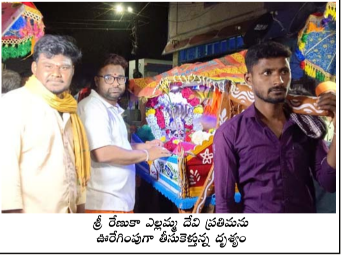
శ్రీ రేణుకా ఎల్లమ్మ దేవి ప్రతిమను ఊరేగింపుగా తీసుకెళ్తున్న దృశ్యం