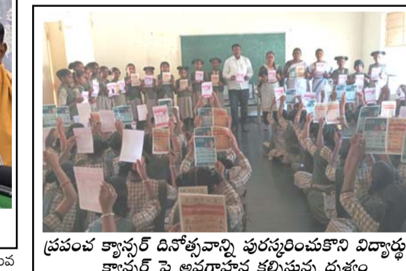
ప్రపంచ క్యాన్సర్ దినోత్సవాన్ని పురస్కరించుకొని విద్యార్థులకు క్యాన్సర్ పై అవగాహన కల్పిస్తున్న దృశ్యం