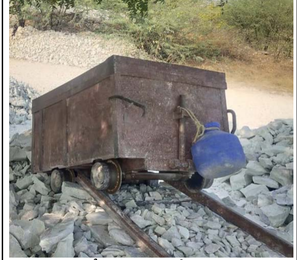
తనిఖీలకు వస్తారని తిప్పేసిన పెట్టెలు

కన్ను ఈ గనులపై వదుతోంది. అనుమతులు కొంత.. అక్రమాల భూగర్భమంతా అన్నట్లు భూగర్భంలో వక్కవాడి భూమిలోకి చొచ్చుకొని పోయి ఖనిజాన్ని తోచేయడం, పంచాయతీలు చేసుకోవడం, రాయల్టీలకు ఎగనామం పెట్టడం ఇక్కడ రివాజుగా మారింది. ఇక్కడున్న దాదాపు 42 భూగర్భ గనుల్లో ప్రమాదకర పరిస్థితుల్లో పనిచేయడానికి కడవుచేతవట్టుకొని వస్తున్న దాదాపు 600 మంది కార్మికుల రక్షణను గనుల భద్రత శాఖ గాని, యజమానులు గాని ఏ మాత్రం