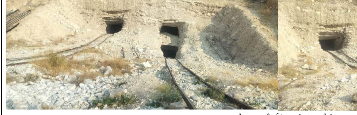
కొండుపల్లిలో ఖనిజ దోపిడీకి ఈ సారంగాలే సాక్షం

కొండుపల్లిలో సాగుతున్న ఖనిజ అక్రమ తవ్వకాలపై వచ్చే పర్యవేక్షణ సాగాలంటే సంబంధిత శాఖల మధ్య సమన్వయం ఉంటేనే అడ్డుకట్ట వడేది. రూ. కోట్లలో ప్రభుత్వానికి ఆదాయాన్నిచ్చే ఇక్కడి విలువైన ఖనిజం వట్ల ఏ శాఖా పూర్తి స్థాయిలో దృష్టి సారించడం లేదు. ఆయా గనుల భూములను సర్వే చేసి ఎన్ఎస్ఐ ఇచ్చే రెవెన్యూ శాఖ, గనులకు అనుమతిచ్చే గనుల భూగర్భ శాఖ, కార్మికులు, పరిసరాల రక్షణను పర్యవేక్షించే గనుల భద్రతా శాఖ, పర్యావరణాన్ని కాలుష్యాన్ని పట్టించుకునే కాలుష్య నియంత్రణ మండలి, ప్రమాదాలు జరిగితే కేసులు నమోదు చేసే కట్టడి చేయాలన్న పోలీసు శాఖ.. ఇలా అన్ని శాఖల మధ్య కొరవడినే సమన్వయం అక్రమార్కు లకు వరంగా మారింది. అడిగితేవచ్చు.. ఆపేదెవరు అన్నట్లు కొందరు అక్రమార్కులు తమ అక్రమ సంపాదనతో అద్దారి తోళ్తే అధికారులకు ఎరవేసే తమ పబ్లింగు గడుపుకుంటున్నారు. భూగర్భంలో హద్దులు దాటి ఎవరు.. ఎక్కడో వరకు తవ్వకుంటున్నారో పర్యవేక్షించే అధికారులు గాని, నిబంధనలు పాటించని గనుల్లో ప్రమాదాలు జరిగినప్పుడు తవ్వకాలు పునరావృతం కాకుండా నిబంధనలు పక్కా అమలయ్యేలా చూడాల్సిన అధికారులు గాని, తవ్వకాలు, రవాణా నికచ్చిగా జరుగుతోందా లేదా అని చూసే గనుల శాఖ, నిఘా అధికారులు గాని కంటికి కనిపించకపోవడంతో విలువైన ఖనిజం అక్రమార్కులకు కాసులు కురిపిస్తోంది.