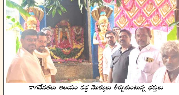
నాగదేవతల ఆలయం వద్ద మొక్కులు తీర్చుకుంటున్న భక్తులు