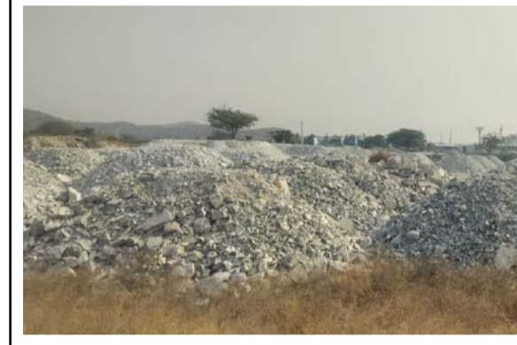
అక్రమంగా తవ్వి నిల్వ ఉంచిన ఖనిజం