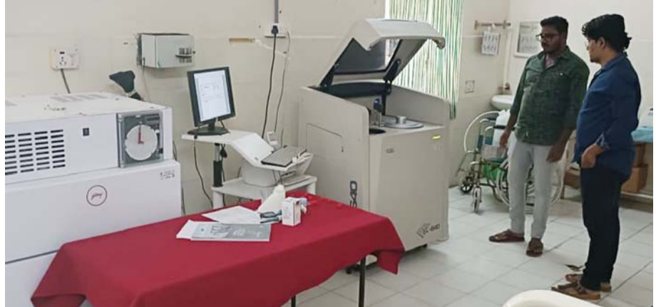
(మొదటి పేజీ (తరువాతి))

సిజీరియన్ డెలివరీలు కూడా అనువృత్తిలోనే సురక్షితంగా నిర్వహిస్తున్నామని, గర్భిణీ పరిస్థితి అత్యంత క్లిష్టంగా మారినప్పుడే ఇతర పెద్ద అనువృత్తులకు రిఫర్ చేస్తున్నామని వివరించారు. పూర్తిస్థాయిలో అనువృత్తిలోనే డెలివరీలు నిర్వహిస్తూ, వారంలో ఒక రోజు కుటుంబ నియంత్రణ శస్త్రచికిత్సలు కూడా నిర్వహిస్తున్నట్లు చెప్పారు. చిన్నపిల్లల వైద్యం అందుబాటులో ఉండడంతో అప్పుడే పుట్టిన శిశువుల ఆరోగ్య పరిస్థితిపై ప్రత్యేక వైద్య పరీక్షలు నిర్వహిస్తున్నామని తెలిపారు. అలాగే అత్యాధునిక సాంకేతికతతో కూడిన ఎక్స్-రే పరీక్షలు అనువృత్తిలో అందుబాటులో ఉండడంతో ఖచ్చితమైన వైద్య నిర్ధారణ సాధ్యమవుతోందన్నారు. మొత్తం ఎనిమిది మంది వైద్యాధికారులు విధులు నిర్వహిస్తూ అనువృత్తికి వచ్చే ప్రతి రోగికి నిరంతరంగా వైద్య సేవలు అందిస్తున్నారని చెప్పారు. రాత్రి వేళల్లో కూడా వైద్యులు అందుబాటులో ఉండడంతో అత్యవసర పరిస్థితుల్లోనూ ఎలాంటి ఇబ్బందులు లేకుండా సేవలు అందుతున్నాయన్నారు. అనువృత్తిలో గతరోజులాగా విద్యుత్ సమస్యలు లేవని స్పష్టం చేశారు. సూతంగా నిర్మించిన అనువృత్తి