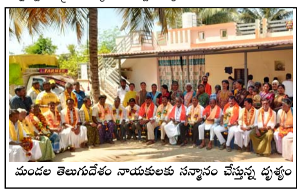
మండల తెలుగుదేశం నాయకులకు సన్మానం చేస్తున్న దృశ్యం