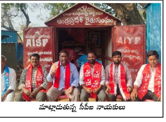
మాట్లాడుతున్న సీపీఐ నాయకులు