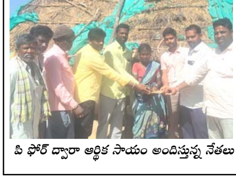
పీ ఫోర్ ద్వారా ఆర్థిక సాయం అందిస్తున్న నేతలు