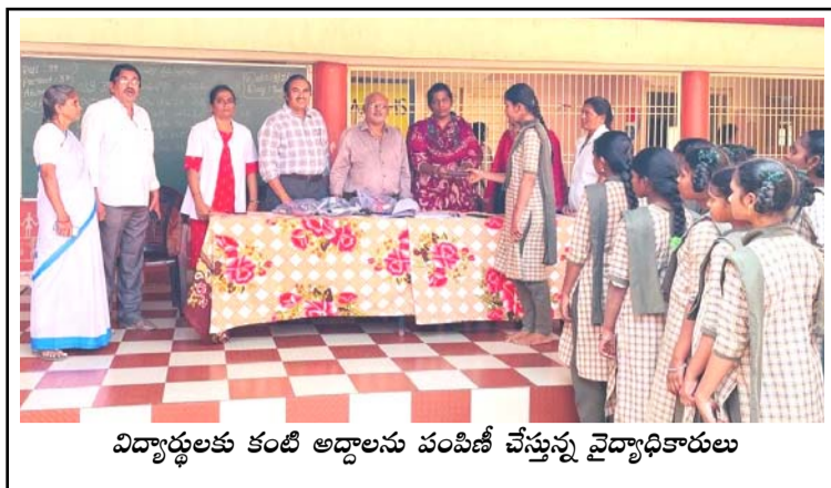
విద్యార్థులకు కంటి అద్దాలను పంపిణీ చేస్తున్న వైద్యాధికారులు

తెలియజేయాలని పిల్లలకు వివరించారు. అలాగే పిల్లల భద్రతకు సంబంధించిన పలు అంశాలపై ఆమె మార్గదర్శనం చేశారు. అపరిచితులిచ్చే బహుమతులు స్వీకరించవద్దని, తెలియని వ్యక్తులతో మాట్లాడటంపై జాగ్రత్తగా ఉండాలని పేర్కొన్నారు. పిల్లల్లో పెరుగుతున్న మొబైల్ ఫోన్ వినియోగంపై కూడా ప్రత్యేకంగా దృష్టి సారించారు. అధికంగా మొబైల్ ఉపయోగించడం వల్ల చదువుపై ఆసక్తి తగ్గడం, నిద్రలేమి, కంటి సమస్యలు, మానసిక ఒత్తిడి వంటి సమస్యలు తలెత్తే అవకాశం ఉందని తెలిపారు. 'భావనా' జీవితంలో ఆటలు, పుస్తకం చదవడం, కుటుంబంలో గడిపే సమయాన్ని పెంచాలని సూచించారు. తల్లిదండ్రులు బిల్లల మొబైల్ వినియోగంపై పర్యవేక్షణ ఉంచాలని పరిమిత సమయం మాత్రమే అనుమతించాలని కోరారు. ఈ కార్యక్రమంలో పాఠశాల సిబ్బంది , పోలీసు సిబ్బంది పాల్గొన్నారు.