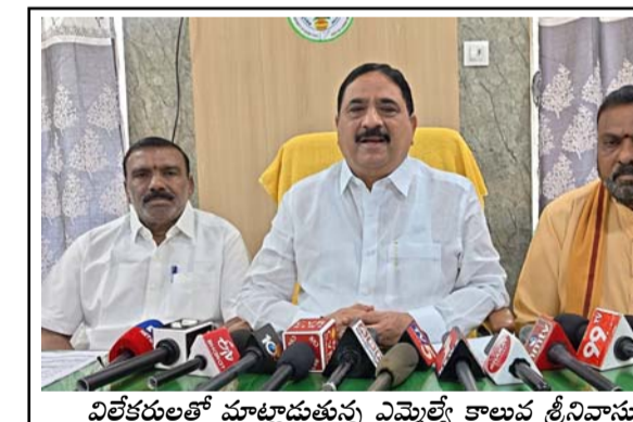
విలేజ్ కలెక్షన్ మాట్లాడుతున్న అమ్మల్నే కాలువ శ్రీనివాసులు