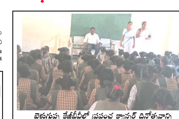
బెళగుప్ప కేజీబీవీలో ప్రపంచ క్యాన్సర్ దినోత్సవాన్ని పురస్కరించుకొని విద్యార్థులకు క్యాన్సర్ పై అవగాహన కల్పిస్తున్న