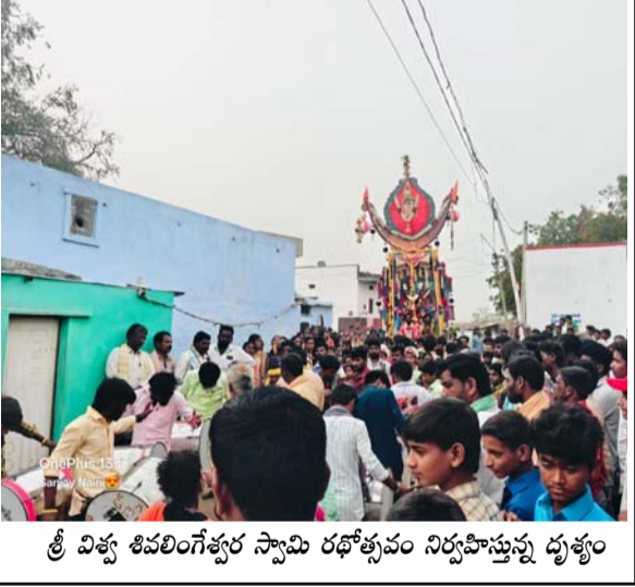
శ్రీ విశ్వ శివలింగేశ్వర స్వామి రథోత్సవం నిర్వహిస్తున్న దృశ్యం

కోసిగి (తెలంగాణ), ఫిబ్రవరి 4 : కోసిగి మండల పరిధి అగస్త్యుల గ్రామంలో శ్రీ విశ్వశివలింగేశ్వర స్వామి రథోత్సవం బుధవారం నాడు కన్నుల పండుగా జరిగింది. దేవాలయం ప్రధాన అర్చకులు గుడి ఈరన్న ఆధ్వర్యంలో బుధవారం ఉదయం నుంచి హోమంతో మొదలై జలభిక్షకం, అభిషేకం, కుంకుమార్చన, గాంధాభిషేకం, అకుపూజ, హోమ పూజ వంటి విశేష పూజలతో పాటు పెద్ద ఎత్తున పూలమాలలతో స్వామివారిని అలంకరించారు. స్వామివారి జాత్ర సందర్భంగా దేవాలయాన్ని పచ్చని తోరణాలు, రంగు రంగుల విద్యుత్ దీపాలతో అలంకరించారు. రథోత్సవంలో భాగంగా అన్ని రకాల పార్టీ నాయకులు ఉదయం స్వామి వారిని దర్శించుకుని ప్రత్యేక నిర్వహించారు. సాయంత్రం ఉత్సవ విగ్రహ మార్చులను రథోత్సవంలో ఉంచి డోళ్ళు, మేళతాలతో ఊరేగింపుగా శివస్వామిలను మరయి భక్తుల ఓం నమస్కారాలు అనే ధ్వనులు నడుమ రథోత్సవం ఎదురు బసవన్న గుడి వరకు ముందుకు సాగింది. రథోత్సవానికి ఆంధ్ర, కర్ణాటక రాష్ట్రాల నుంచి భక్తులు భారీ సంఖ్యలో తరలివచ్చారు. రథోత్సవం అనంతరం భక్తులు అన్నదాన కార్యక్రమంలో పాల్గొని ఈ జాతరను విజయవంతం చేశారు. ఈ కార్యక్రమంలో శివస్వామిలు, గ్రామ పెద్దలు, భక్తులు పాల్గొన్నారు.