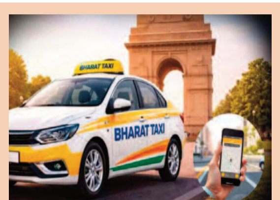
వివరాలు 4వ పేజీలో

మేఘాలయలో ఘోర ప్రమాదం జరిగింది. బొగ్గు గనిలో భారీ పేలుడు జరిగి 16 మంది ప్రాణాలు కోల్పోయారు. బొగ్గు గనిలో మరింత మంది చిక్కుకుని ఉండొచ్చని అధికారులు భావిస్తున్నారు. రెస్క్యూ టీం సహాయక చర్యలు కొనసాగిస్తోంది. తూర్పు జైంతియా హిల్స్ జిల్లాలోని గనిలో బొగ్గు తవ్వకాలు సమయంలో పేలుడు జరిగింది. గురువారం ఉదయం సమయంలో థాంగ్మ్యూ ప్రాంతంలో ఈ ఘటన జరిగింది. ఈ బొగ్గు గనిని అక్రమ బొగ్గు గనిగా అధికారులు గుర్తించారు.