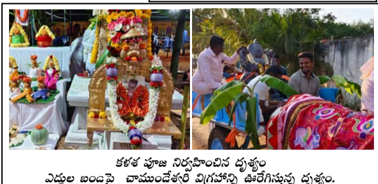
కళాశ పూజ నిర్వహించిన దృశ్యం ఎద్దుల బండపై చాముండేశ్వరి విగ్రహాన్ని ఊరేగింపు దృశ్యం.