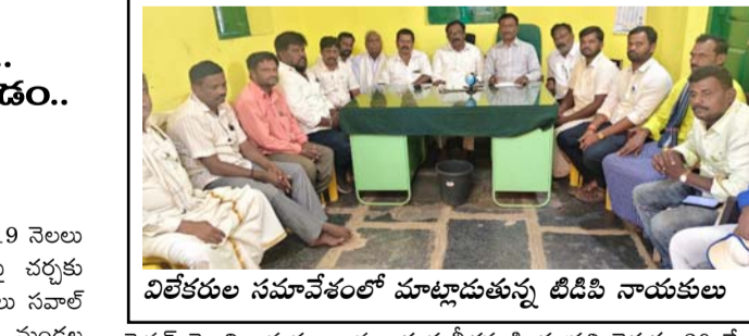
విలేజరుల సమావేశంలో మాట్లాడుతున్న టిడిపి నాయకులు