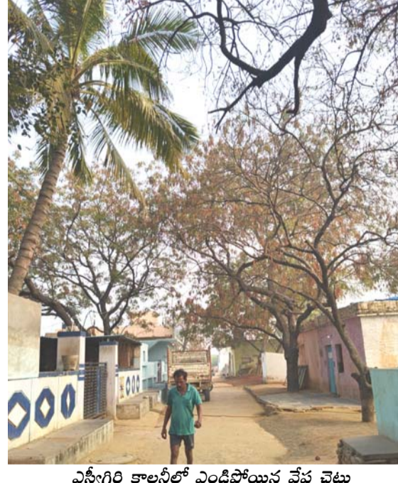
ఎన్టీఆర్ కాలనీలో ఎండిపోయిన వేప చెట్లు