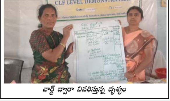
చార్టర్ ద్వారా వివరిస్తున్న దృశ్యం