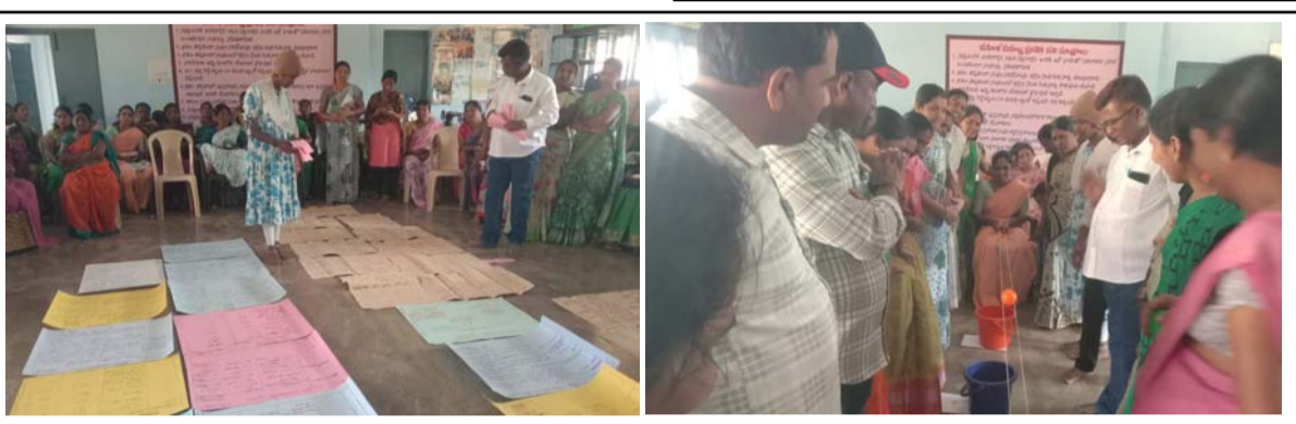
బాహుబలి చార్టర్ డారం బదిలీ ఆట.