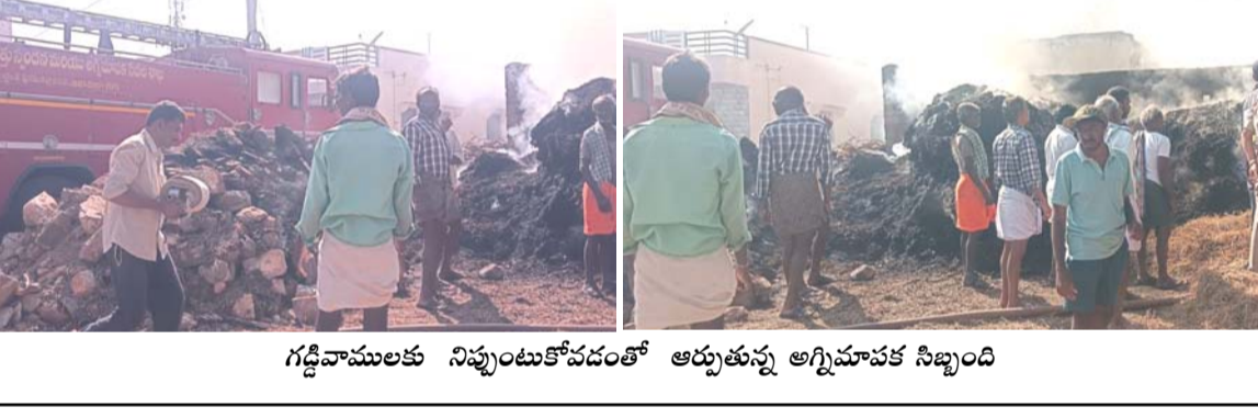
గడ్డివాములకు నిప్పుంటుకోవడంతో ఆర్పుతున్న అగ్నిమాపక సిబ్బంది