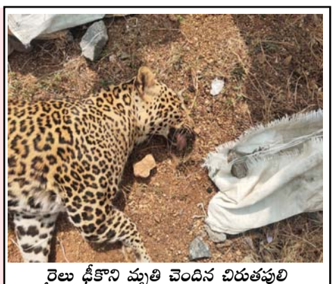
రైలు డికోని మృతి చెందిన చిరుతపులి