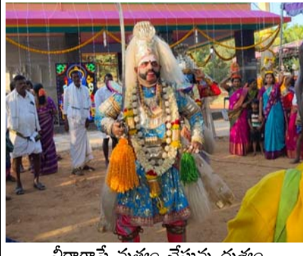
వీరాగాసే సృష్టం చేసేస్తు దృశ్యం

మండల చెర్లపల్లి గ్రామంలో నూతనంగా నిర్మించిన దేవాలయంలో గురువారం నుంచి రెండు రోజులపాటు జరిగి చాముండేశ్వరి దేవి విగ్రహ ప్రతిష్ఠపన కార్యక్రమంలో భాగంగా సాయంత్రం గంగాపూజ తో మొదలై వీరాగాసే సృష్టం తో అమ్మవారిని ఎద్దుల బండిపై గ్రామం లో ఊరేగింపు నిర్వహించారు. 6 న శుక్రవారం ఉదయం 5 గంటల నుండి 5:30 వరకు ప్రాణప్రాణిస్థాపన కార్యక్రమం చేపట్టడానికి ఏర్పాట్లు చేశారు. అనంతరం గురుగణపతి ప్రార్థన, దేవానంది, పంచాంగవ్య మేళన, అంకురార్పణ, కళాశ స్థాపన, నవగ్రహ ఆరాధన, అనంతరం మహామంగళారతి ఉంటుందన్నారు. సాయంత్రం కళాశారాధన, ప్రాణప్రతిష్ఠ, మంగళారతి, ఆదిత్యాది గణపతి హోమం ఉంటుందన్నారు. భక్తులకు అన్నదానం ఏర్పాటు చేయడం జరిగిందన్నారు. ప్రాణప్రాణిస్థాపన కార్యక్రమం లో అధిక సంఖ్యలో భక్తులు పాల్గొని స్వామి కృపకు పాత్రలు కావాలని తెలిపారు.