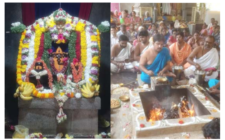
అలంకరణలో ఆలయంలో కొలువైన గణపతి. హోమం చేస్తున్న పండితులు