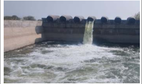
అంకంపల్లి వద్ద గల 10వ పంపు హౌస్ నుంచి ఒక మోటార్ తో శీర్షి బెళగుప్ప చెరువులకు నీటిని విడుదల చేస్తున్న దృశ్యం