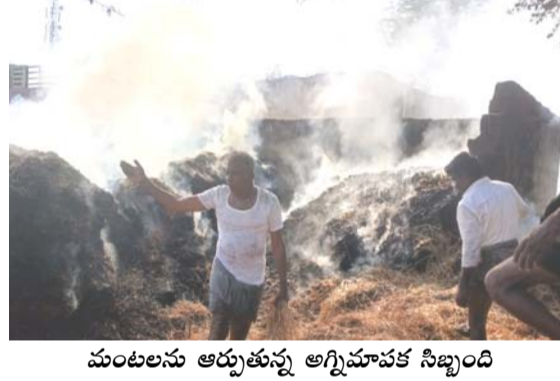
మంటలను ఆర్పుతున్న అగ్నిమాపక సిబ్బంది