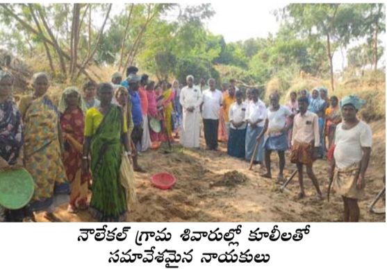
నౌకల్ గ్రామ శివారుల్లో కూలీలతో సమావేశమైన నాయకులు