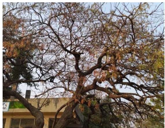
ప్రభుత్వ కార్యాలయం ఆవరణలో ఎండిపోయిన వేప చెట్లు