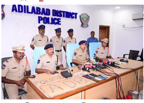
అమృత తెలంగాణ అదిలాబాద్ ప్రతినిధి నిందితుల వివరాలు