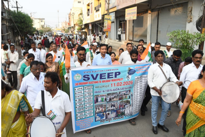
లేదా ఇతర ప్రలోభాలకు లొంగి ఓటు వేయవద్దని విజ్ఞప్తి చేశారు. ప్రలోభాలకు గురి ఓటు వేస్తే, భవిష్యత్తులో నాయకులను ప్రశ్నించే హక్కును కోల్పోతామని, స్వచ్ఛందంగా ఓటు వేసినప్పుడే బద్దేశపాటు ప్రజాప్రతినిధులను అడిగి హక్కు ఉంటుందని అన్నారు. బూత్ స్థాయి అధికారులు ఓటర్ చిట్టిలను తప్పనిసరిగా తీసుకోవాలని, అందకపోతే సంబంధిత దీక్షాను సంప్రదించాలని సూచించారు. ఓటు వేయడానికి ఓటర్ స్వేచ్ఛతో పాటు ప్రభుత్వం సూచించిన 18 రకాల గుర్తింపు కార్డులలో ఏదో ఒకటి వెంట తీసుకువెళ్లాలని, ప్రతి పోలింగ్ స్టేషన్ వద్ద ఓటర్లకు సహాయం చేయడానికి 'హెల్ప్ డెస్క్'లు అందజేయాలని ఉంటాయన్నారు. యువత, పట్టణ ప్రాంత ఓటర్లు ఓటింగ్ శాతాన్ని పెంచేలా ఉత్సాహంగా పాల్గొనాలని, సామాజిక మాధ్యమాల ద్వారా విస్తృత ప్రచారం కల్పించాలని కోరారు.