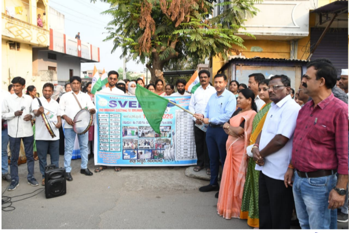
జెండా ఊపి ప్రారంభిస్తున్న అదిలాబాద్ జిల్లా కలెక్టర్ రాజర్షి షా