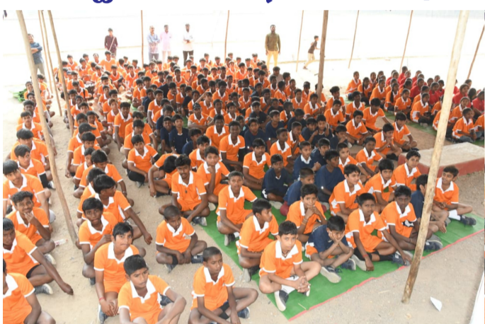
హాజరైన విద్యార్థిని విద్యార్థులు