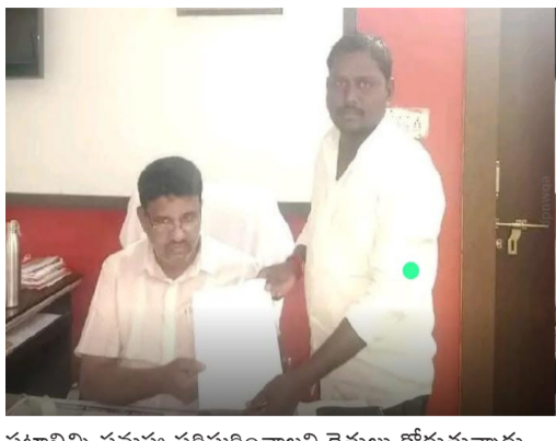
పట్టాలిచ్చి సమస్య పరిష్కరించాలని రైతులు కోరుతున్నారు