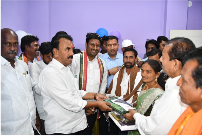
మంత్రి జూపల్లి కృష్ణారావు లబ్ధిదారులకు నూతన దుస్తులు అందజేస్తున్న దృశ్యం

అమృత తెలంగాణ డిలీ న్యూస్ పేద ప్రజలకు గౌరవప్రదమైన జీవనం కల్పించడమే ప్రభుత్వ ప్రధాన లక్ష్యమని, అందులో భాగంగానే ఇందిరమ్మ ఇళ్ల పథకాన్ని అత్యంత ప్రతిష్టాత్మకంగా అమలు చేస్తున్నామని రాష్ట్ర పర్యాటక, సాంస్కృతిక, ఎక్సైజ్ శాఖ మంత్రి మరియు ఉమ్మడి ఆదిలాబాద్ జిల్లా ఇన్చార్జ్ మంత్రి జూపల్లి కృష్ణారావు అన్నారు. శుక్రవారం ఆదిలాబాద్ జిల్లా డిలీ మండలం డోష్టాల గ్రామంలో నూతనంగా నిర్మించిన ఇందిరమ్మ ఇళ్ల గృహప్రవేశం కార్యక్రమానికి ఆయన ముఖ్య అతిథిగా హాజరయ్యారు. ఈ సందర్భంగా మంత్రి లబ్ధిదారుల ఇళ్ల వద్ద రిబ్బన్ కట్టిరించి గృహప్రవేశం చేయించారు. అనంతరం లబ్ధిదారులకు నూతన వస్త్రాలు అందించి శుభాకాంక్షలు తెలియజేస్తూ వారితో ముచ్చటించారు. ఈ సందర్భంగా