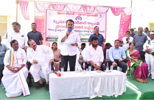
సమావేశంలో మాట్లాడుతున్న ఉమ్మడి ఆదిలాబాద్ జిల్లా ఇంచార్జ్ మంత్రి జూపల్లి కృష్ణారావు

నేరడిగొండలో వైద్య శిబిరాన్ని ప్రారంభించిన మంత్రి జూపల్లి