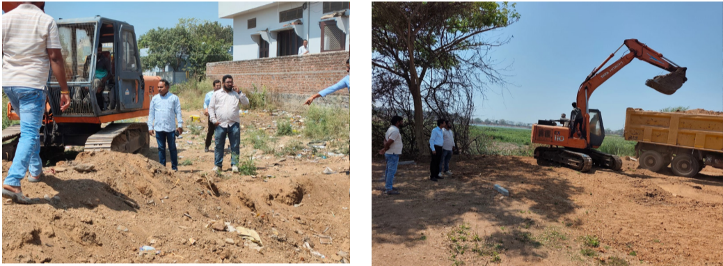
చెరువులో ఆక్రమ నిర్మాణాలను తొలగిస్తున్న అధికారులు

నిర్మల్ జిల్లా మార్చి 6 అమృత్ తెలంగాణ నిర్మల్ విక్రయించే ప్రయత్నం చేయగా, సమాచారం అందుకున్న రెవెన్యూ పట్టణ మండలం కంచరొని చెరువు శిఖం భూముల ఇరిగేషన్ ఆక్రమణలు అధికారులు తొలగించారు. చెరువు శిఖం అధికారులు ఆ ప్రదేశానికి వెళ్లి ఆక్రమణలు తొలగించారు. భూముల్లో గుర్తు తెలియని వ్యక్తులు ఫ్లాట్ లు ఏర్పాటు చేసి అక్కడ వేసిన మొరం తీసివేశారు.