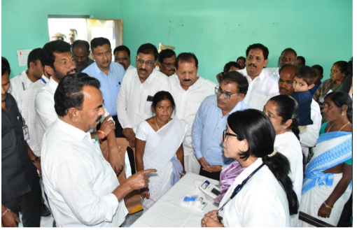
డాక్టర్తో మాట్లాడుతున్న మంత్రి జూపల్లి కృష్ణారావు

అమృత తెలంగాణ ఇన్చార్జ్ న్యూస్ గ్రామీణ ప్రాంత ప్రజలకు నిపుణులైన వైద్యులతో కూడిన మెరుగైన చికిత్సను వారి ఇంటి ముంగిటకే చేర్చడమే ప్రభుత్వ ప్రధాన లక్ష్యమని రాష్ట్ర పర్యాటక, సాంస్కృతిక, ఎక్సైజ్ శాఖ, ఉమ్మడి ఆదిలాబాద్ జిల్లా ఇన్చార్జ్ మంత్రి జూపల్లి కృష్ణారావు స్పష్టం చేశారు. 'ప్రజా పాలన - ప్రగతి ప్రణాళిక'లో భాగంగా శుక్రవారం ఆదిలాబాద్ జిల్లా నేరడిగొండ మండల కేంద్రంలోని ప్రాథమిక ఆరోగ్య కేంద్రం (గ్రాంజి)లో ఏర్పాటు చేసిన 'స్పెషలిస్ట్ మెడికల్ క్యాంప్'ను ఆయన ప్రారంభించారు. ఈ సందర్భంగా ఏర్పాటు చేసిన సభలో మంత్రి మాట్లాడుతూ.. గతంలో స్పెషలిస్ట్ వైద్యం కావాలంటే గ్రామీణులు పట్టణాలకు పరుగులు తీయాల్సి వచ్చేదని, ఆ ఇబ్బందులను తొలగించేందుకు ప్రభుత్వం రిమ్సీ (=xమీ) నుంచి ఆరుగురు నిపుణులైన వైద్యులను నేరుగా పల్లెలకే పంపిస్తోందని పేర్కొన్నారు. మధుమేహం, రక్తపోటు, డైరాయిడ్, క్యాన్సర్, గుండె, కిడ్నీ సంబంధిత వ్యాధులకు ఇక్కడ ప్రత్యేక పరీక్షలు నిర్వహించి, ఉచితంగా మందులు పంపిణీ చేస్తున్నట్లు తెలిపారు. అవసరమైన బాధితులకు రిమ్సీలో మెరుగైన చికిత్స అందేలా ఏర్పాట్లు చేస్తామని, ఇటువంటి శిబిరాలను ప్రతి నెలా అన్ని ప్రాథమిక ఆరోగ్య కేంద్రాల్లో నిర్వహించి ప్రజలపై ఆర్థిక భారం పడకుండా చూస్తామని మంత్రి హామీ ఇచ్చారు. వైద్య సేవల్లో ఎల్లీ పరిస్థితుల్లోనూ నిర్లక్ష్యాన్ని సహించేది లేదని మంత్రి జూపల్లి హెచ్చరించారు. "ప్రతి విభాగం అధిపతి (నాణ) ఉదయం రాగానే యోమెట్రిక్ వేయడంతో పాటు, వాట్సాప్ ద్వారా తమ హాజరు రిపోర్ట్ చేయాలన్నారు. సమయపాసన పాటించని వారిపై కఠిన చర్యలు తప్పవు" అని స్పష్టం చేశారు. అలాగే బోధ, ఇంద్రవల్లి ప్రాంతాల్లో త్వరలోనే దయాలసిస్ సెంటర్లను అందుబాటులోకి తెస్తామని వెల్లడించారు. అనంతరం "ఆరోగ్యమే మహాభాగ్యం"