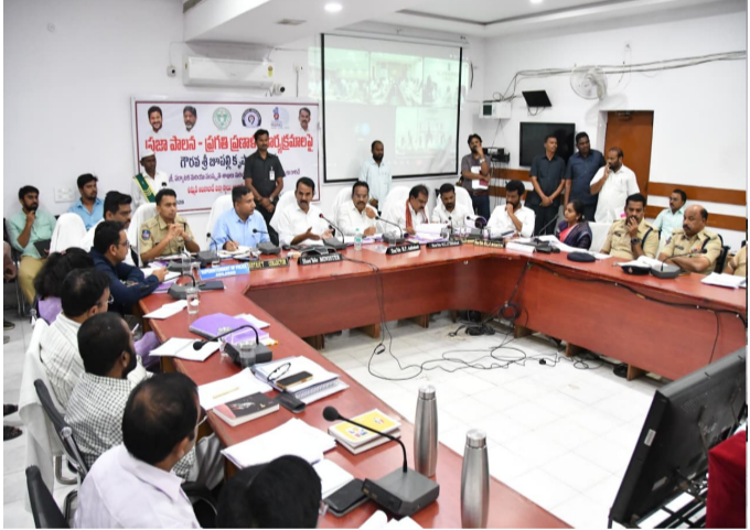
సమావేశంలో మాట్లాడుతున్న మంత్రి జూపల్లి కృష్ణారావు

అమృత తెలంగాణ ఆదిలాబాద్ న్యూస్ రాష్ట్ర ప్రభుత్వం ప్రతిష్టాత్మకంగా చేపట్టిన 'ప్రజా పాలన -- ప్రగతి ప్రణాళిక' 99 రోజుల కార్యాచరణను జిల్లాలో సమర్థవంతంగా అమలు చేయాలని పర్యాటక, సాంస్కృతిక, ఎక్సైజ్ శాఖ మంత్రి జూపల్లి కృష్ణారావు అధికారులను ఆదేశించారు. ఆదిలాబాద్ జిల్లా కలెక్టర్ కార్యాలయంలో శుక్రవారం నిర్వహించిన సమీక్షా సమావేశంలో అధికారులకు దిశా నిర్దేశం చేశారు.