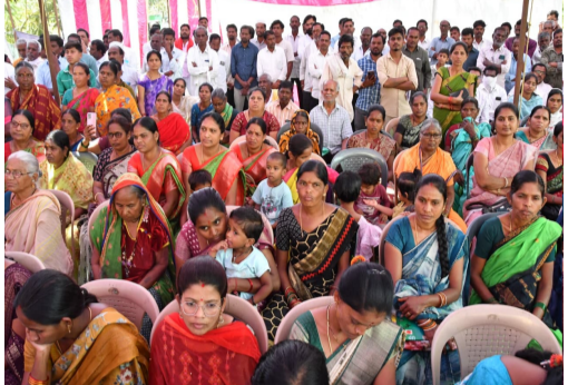
సమావేశంలో హాజరైన ప్రజలు

అని పేర్కొంటూ.. ప్రజలు జొన్న లొట్టెలు, పప్పు వంటి పోషకాహారం తీసుకోవాలని, నిత్యం వ్యాయామం చేయాలని సూచించారు.