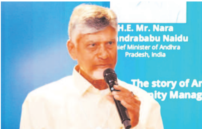
H.E. Mr. Nara Chandrababu Naidu Chief Minister of Andhra Pradesh, India