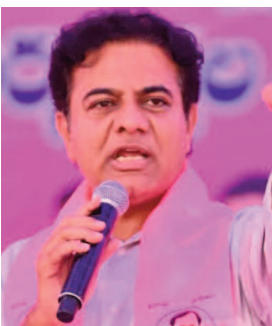
ప్రజాస్వామ్యార్థం కంటికి రెప్పలా కాపాడుకుంటుంది అని కేటీఆర్ అన్నారు.

పర్యటించాను ప్రగతి బాటలో నడిపింది మహాస్వత తల్లి కేటీఆర్, కానీ, నేడు అధికారం చేతిలో ఉండనే అంతాకారంకో, తన ప్రభుత్వం, తన ప్రభుత్వం అనీ అనీ కచ్చితంగా చేసినది ముఖ్యమంత్రి రేవంత్ రెడ్డి కేటీఆర్ మీద, ఆయన వ్యక్తిత్వం మీద విషం విముక్కయ్యారు.