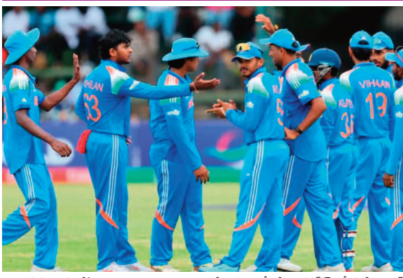
అలాగే స్వప్నం చూపిస్తోంది. అండర్-19 వరల్డ్ కప్ లో భారత్ విజయం శాతం 92.1 శాతంగా ఉంది. వరల్డ్ కప్ చరిత్రలో ఇది గొప్ప రికార్డులో ఒకటి. మొత్తంగా మాస్ట్.. 2016 నుంచి అండర్-19 వరల్డ్ కప్ లో భారత్ యొక్క విజయ శాతం అనూహ్యం అనే చెప్పాలి. వరల్డ్ కప్ లో ప్రతిసారి ఫైనల్స్ చేరడం, అధిక విజయ శాతం సమాచారం చేయడం భారత్ క్రైకెట్ వ్యవస్థ పరిష్కారకు నిదర్శనం. ఈ యువ అటామిక్ ట్యాంకులో అత్యంత డీమెండ్ యాంట్ మార్కెట్ ను సమర్థించే అభివృద్ధి బలంగా ఉంది.