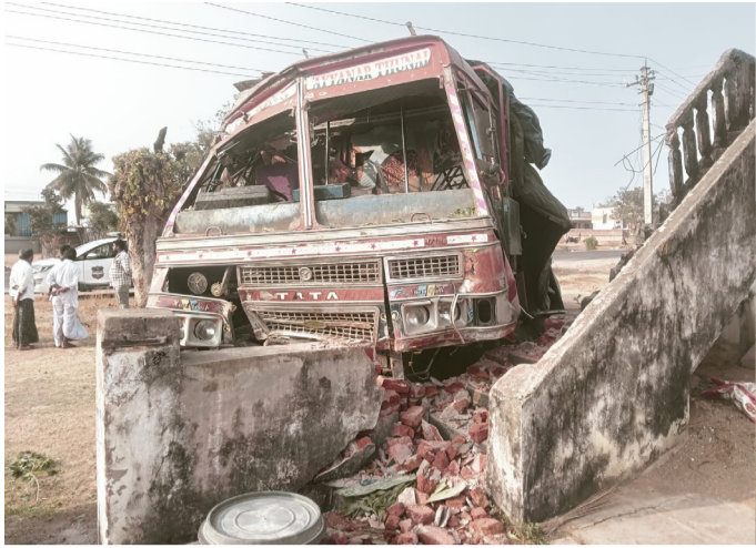
రాంపూర్ లో ఇంటి కాంపౌండ్ వాల్ ను ఢీ కొట్టిన లారీ