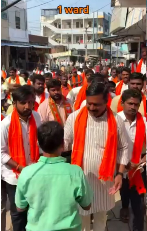
మున్సిపల్ ఎన్నికల ప్రచారంలో బీజేపీ కార్యకర్తలతో బీజేపీ నేత ఎమ్మెల్యే మహేశ్వర్ రెడ్డి