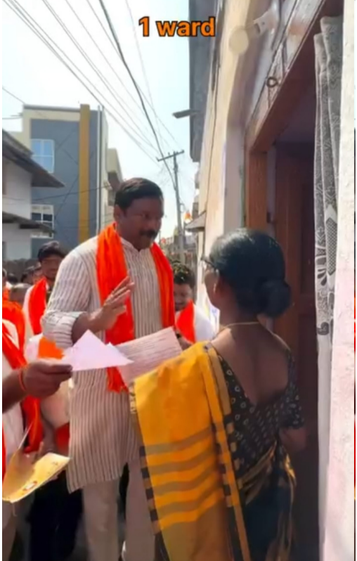
బిజెపికి ఓటు వేయాలని మహిళను అభ్యర్థిస్తున్న ఎమ్మెల్యే