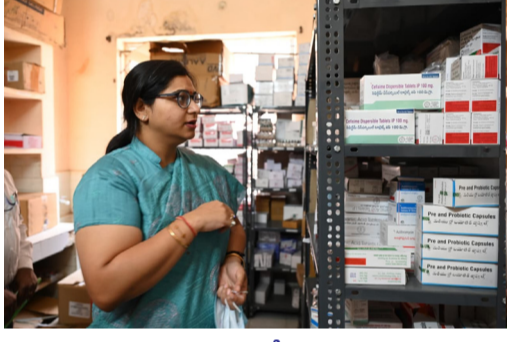
మెడికల్ షాపును పరిశీలిస్తున్న జిల్లా కలెక్టర్