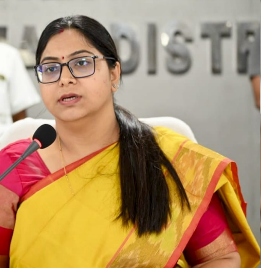
: కలెక్టర్ అభిలాష అభినవ్

నిర్మల్ జిల్లా ఫిబ్రవరి7 అమృత తెలంగాణ నిర్మల్ జిల్లా స్థాయి అక్రిడిటేషన్ కార్డుల జారీ కొరకు దరఖాస్తులు స్వీకరిస్తున్నట్లు జిల్లా అక్రిడిటేషన్ కమిటీ చైర్మన్, జిల్లా కలెక్టర్ అభిలాష అభినవ్ శనివారం ఒక ప్రకటనలో తెలిపారు. సమాచార, పౌర సంబంధాల శాఖ అధ్యక్షులలో అక్రిడిటేషన్ మాడ్యూల్తో కూడిన వెబ్ సైట్ ను ప్రారంభించినట్లు ఆమె తెలిపారు. 2026--28 సంవత్సరాలకు గాను అక్రిడిటేషన్ కార్డుల జారీ కోసం ఆన్లైన్ దరఖాస్తులు స్వీకరించబడుతున్నాయని తెలిపారు. ప్రస్తుతం అమల్లో ఉన్న అక్రిడిటేషన్ కార్డుల గడువు ఈ నెల 28వ తేదీతో ముగియనుందని, అర్బులైన వర్సింగ్ జర్నలిస్టులకు నూతన అక్రిడిటేషన్ కార్డులు జారీ చేయబడతాయని పేర్కొన్నారు. మీడియా యాజమాన్యాలు