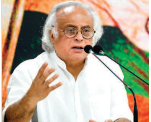
కొలింతలు, దిగిన ఘోటోలు పెద్దగా ఫలింపలేదు. నమస్తే ట్రంప్.. మోడీ మోడీపై స్కోర్ చేసింది. స్నేహితుడు ఇకపై స్నేహితుడు కాదు అని జైరాం రమేష్ అన్నారు.

చమురు కొనుగోలు చేస్తే 25 శాతం జరిమానాను భారత్పై తిరిగి విధించిన అమెరికా ప్రకటించింది' అని రమేష్ ఎక్స్ ప్రెస్సులో పేర్కొన్నారు. ఈ సందర్భంగా ప్రధాని మోడీని ఆయన విమర్శించారు. 'ట్రంప్తో మోడీ దిగిన ఘోటోలను ప్రస్తావిస్తూ.. 'ఫోటో ఆఫ్ భారతదేశానికి పెద్దగా ప్రయోజనం చేకూర్చలేదని, దౌత్య వైఫల్యాన్ని సూచిస్తున్నాయని ఆయన అన్నారు. భారతీయ రైతులను వణంగా పెట్టి అమెరికన్ రైతులకు సహాయం చేయడానికి భారతదేశం దిగుమతి సుంకాలను తగ్గిస్తుంది. ఈ ఒప్పందంతో అమెరికా నుండి భారత్ వార్షిక దిగుమతులు మూడురెట్లు పెరుగుతాయి. మన దీర్ఘకాల వస్తువుల వాణిజ్య మిగులు తుడిచిపెట్టుకుపోతుంది. భారత్ నుంచి అమెరికాకు ఐటీ, ఇతర సేవల ఎగుమతులపై తీవ్ర అనిశ్చితి కొనసాగుతుంది. అలాగే అమెరికాకు ఎగుమతులు చేసే భారత్ వస్తువులపై గతకంటే ఎక్కువ సుంకాలు విధిస్తారు. దీన్నిబట్టి చూస్తే.. ట్రంప్ను చేసుకున్న