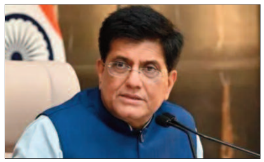
పైవిలుకు జీసీసీలు ఉన్నాయని అన్నారు. వీటితో ఉద్యోగాలు, ప్రభుత్వానికి పన్ను ఆదాయం లభిస్తోందని అన్నారు. ఉద్యోగులు తమ కుటుంబాలకు దగ్గరగా ఉండగలుగు తున్నారని అన్నారు. గోబల్ సంస్థల లాభదాయకత కూడా పెరుగుతోందని చెప్పారు.

లు స్వల్ప సంఖ్యలో ఉన్న వీసాల కోసం అధికంగా దరఖాస్తులను సమర్పించాల్సిన పరిస్థితి వచ్చిందని అన్నారు. కొవిడ్ తరువాత ప్రపంచం ఎంతో మారిపోయిందని, నాటి రోజులు ఎప్పుడో పోయాయని వ్యాఖ్యానించారు. హెచ్-1బి వీసా అంతంపై అమెరికాతో చర్చించాలని తనను ఏ కంపెనీ కరోనా సంక్షోభం తరువాత అభ్యర్థించ లేదని మంత్రి తెలిపారు. ఒకప్పుడు అమెరికాలో ఆన్లైన్ టీలో చేసిన పనిని భారత్ నుంచే రిమోట్గా చేయొచ్చన్న విషయాన్ని కంపెనీలు గుర్తించాయని అన్నారు. అమెరికాలో హెచ్-1బి వీసా ఉద్యోగులకు సంస్థలు భారీగా జీతాలు చెల్లించాల్సి వచ్చేదని కూడా అన్నారు. గోబల్ కేవలబిటి సెంటర్లకు (జీసీసీ) పనుల ఔట్సోర్సింగ్తో అటు కంపెనీలకు ఇటు భారత ఆర్థిక వ్యవస్థకు లాభం కలుగుతుందని చెప్పారు. భారత్లో ప్రస్తుతం 1800