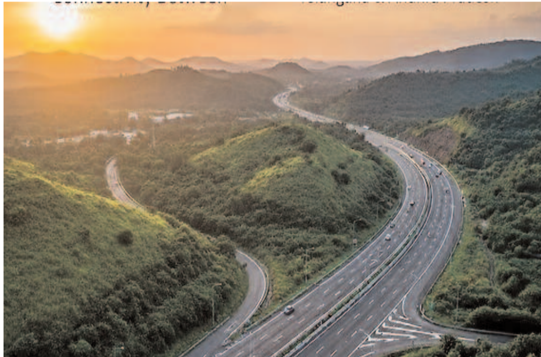
రాయ్ పూర్ 6 గంటల్లో వెళ్లొచ్చుంటున్నాను.