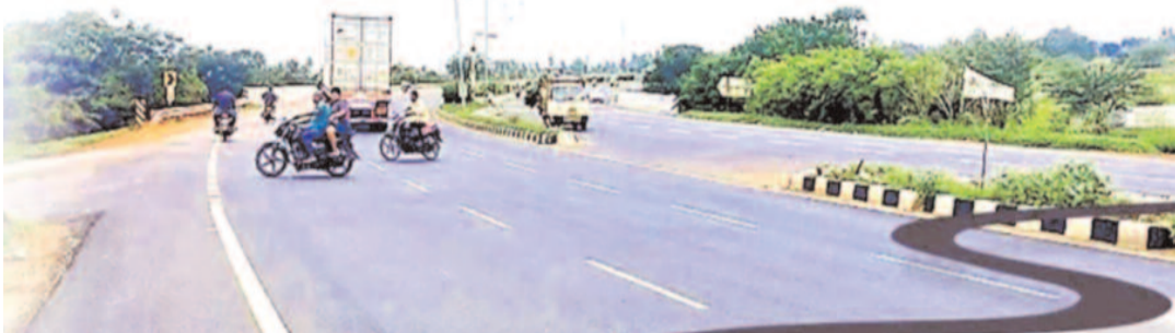
ఎం జాగ్రత్తలు తీసుకుంటారు అంటే? నగదు రహిత చికిత్స అందించేలా:

అమరావతి: ఆ జిల్లాలో రహదారులు నిత్యం రక్తమోడుతున్నా ఉన్నాయి. ఓ వైపు అక్కడ పెద్ద పెద్ద రహదారులు, మరోవైపు ప్రాణాలు తోడేసే పెనుగండూలు కూడా ఉన్నాయి. ఎంతగానంటే దేశంలో అత్యంత ఎక్కువ సంఖ్యలో ప్రమాదాలు జరుగుతున్న జిల్లాల్లో ఇవి కూడా చేరాలంటే ప్రమాదాలు ఏ స్థాయిలో జరుగుతున్నాయో మీ ఊహకే వదిలేస్తున్నాను. ఈ ప్రమాదాలను గురించి అధ్యయనం ఏం చెబుతుందో ఈ కథనంలో తెలుసుకుందాం రండి. కేంద్ర రోడ్డు రవాణా, హైవేల మంత్రిత్వశాఖ (మార్ట్) సీమ్ లైఫ్ ఫౌండేషన్ సహకారంతో రోడ్డు ప్రమాదాలపై అధ్యయనం చేయగా ఈ విషయాలు వెలువడ్డాయి. ఈ నివేదికల ప్రకారం దేశంలోనే అత్యంత సంక్లిష్టమైన 100 జిల్లాలను గుర్తించింది. వాటిలో రాష్ట్రంలోని ఉమ్మడి ప్రకాశం, గుంటూరు, నెల్లూరు, అనంతపురం, కడప, చిత్తూరు జిల్లాలు ఉన్నాయి. ఈ జిల్లాలను 2023, 2024లో జరిగిన ప్రమాదాలు, మరణాల ఆధారంగా ఎంపిక చేశారు. మొత్తంగా ఈ రెండు ఏళ్లలో ప్రమాదాలు, అందులోని మరణాలను విశ్లేషించగా అత్యధిక మృతులు ఉన్న జిల్లాలకు ర్యాంకింగ్స్ కూడా ఇచ్చారు. ఇందులో అత్యధికంగా ఉత్తరప్రదేశ్ లోని 20, తమిళనాడులోని 19 జిల్లాలు ఉండగా, ఏపీలో 6 ఉన్నాయి.