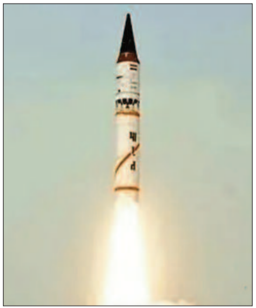
చేయగల సత్తా భారత్ సాంతమైందని రక్షణ రంగ విశ్లేషకులు చెబుతున్నారు.

అగ్ని-1 క్షిపణి 700 కిలోమీటర్ల దూరంలోని లక్ష్యాలను ఛేదించగలదు. దీనిని 220 కిలోమీటర్ల తక్కువ దూరంలోని లక్ష్యాలను ధ్వంసం చేయడానికి కూడా వినియోగించవచ్చని డీఆర్డీఓ పర్ణాల తెలిపాయి. అగ్ని-2 క్షిపణి 2 వేల కిలోమీటర్ల పరిధిని కలిగి ఉంది. తాజాగా పరీక్షించిన అగ్ని-3 క్షిపణి 3 వేల కిలోమీటర్ల దూరంలోని శత్రు స్థావరాలను బూడిద చేయగలదు. అగ్ని-4 క్షిపణి 4 వేల కిలోమీటర్ల దూరంలోని లక్ష్యాలను తాకగలదు. ఇక అగ్ని-5 అత్యధికంగా 5 వేల కిలోమీటర్ల పరిధిని కలిగి ఉండి, ఖండాంతర క్షిపణిగా దేశానికి రక్షణ కవచంగా నిలుస్తోంది.