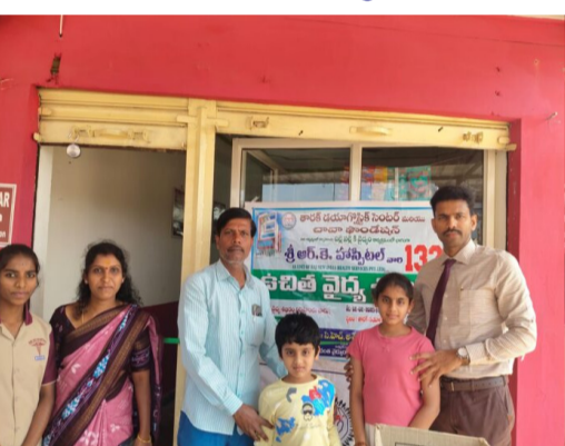
క్రమం తప్పకుండా పరీక్షలు నిర్వహించుకోవడం వల్ల పెద్ద పెద్ద వ్యాధుల బారిన పడకుండా నివారించుకోవచ్చునని కృతజ్ఞతలు తెలియజేశారు.