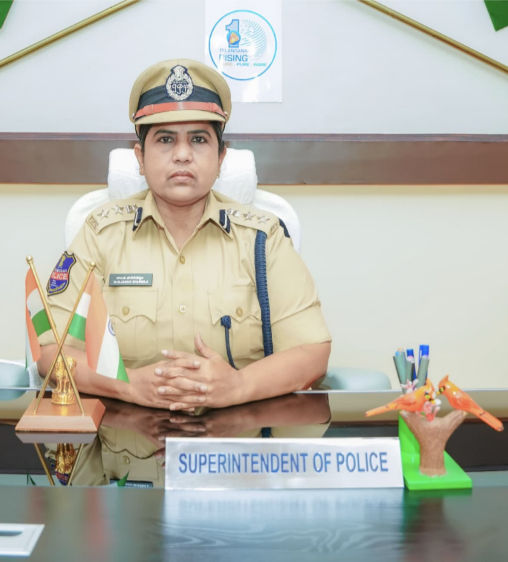
నిర్ణయ జిల్లా ఎస్పీ జానకి పర్వల

అమృత తెలంగాణ నిర్ణయ ప్రతినిధి . ఈ నెల 11వ తేదీన నిర్ణయ జిల్లాలోని మూడు మున్సిపాలిటీలకు జరగనున్న ఎన్నికలను ప్రశాంతంగా, నిష్పక్షపాతంగా నిర్వహించేందుకు జిల్లా పోలీస్ శాఖ పటిష్ట బందోబస్తు ఏర్పాటు చేసింది అని జిల్లా ఎస్పీ డా. జి. జానకి పర్వల బహిష్కరించారు. ఎన్నికల సమయం మొదలు కొని ఫలితాలు వెల్లడించే వరకు ఎక్కడా ఎలాంటి అవాంఛనీయ ఘటనలు జరగకుండా జిల్లా అంతటా ముందస్తు చర్యలు చేపట్టమని, ఎన్నికల ప్రక్రియ మొత్తం కమాండ్ అండ్ కంట్రోల్ సెంటర్, ఎలక్షన్ సెల్ ద్వారా నిరంతరం పర్యవేక్షణలో ఉంటుందని తెలిపారు. అన్ని పోలింగ్ కేంద్రాలు మరియు కీలక ప్రాంతాలు సీసీ కెమెరాల నిఘాలో ఉన్నాయని స్పష్టం చేశారు. ప్రచార సమయం రేపు అనగా 9వ తేదీ సోమవారం సాయంత్రం 5 గంటలకు ముగిస్తుందని తెలిపారు. ప్రచార సమయం ముగిసిన తర్వాత ప్రచారం మధ్యతరగారుల ఎవరూ కూడా ప్రచారం నిర్వహించరాదని ఆదేశించారు. నిబంధనలు ఉల్లంఘించి ప్రచారం నిర్వహిస్తే సంబంధిత వ్యక్తులపై చట్టపరమైన చర్యలు తీసుకోవడం జరుగుతుందని, కేసులు నమోదైతే అభ్యర్థిత్వం కూడా కోల్పోయే అవకాశముందని హెచ్చరించారు. సోమవారం సాయంత్రం 5 గంటల నుంచి ఎన్నికల ఫలితాలు వెలువడే వరకు సైబర్ డేగా పరిగణించడం జరుగుతుందని తెలిపారు. ఈ సమయంలో స్థానికీతరులు, ఓటర్లు కానివారు కాలనీలు, వార్డుల్లో సంబంధించిన, అక్కడ ఉండకూడదని