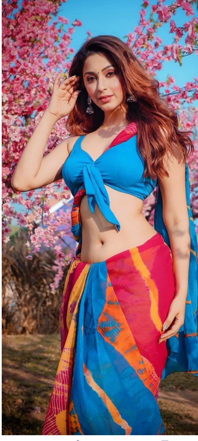
ఈశాన్యామహేశ్వరి హాట్ ఇన్ బ్లూ