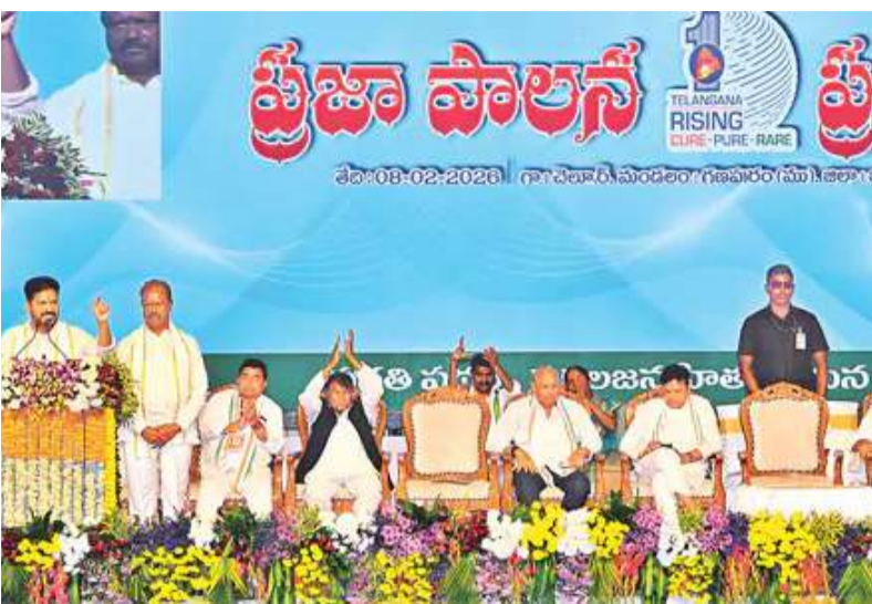
పిలుపునిచ్చారు. సింగరేణి కార్మికులకు న్యాయం చేయడానికి ప్రభుత్వం ప్రయత్నం చేస్తోందన్నారు. 'బీఆర్ఎస్ ను ఇక నుంచి భాక్తమయిల్ రాజకీయ సమితి అని పిలుస్తా. ఫోన్ ట్యాపింగ్ ద్వారా భాక్తమయిల్ చేసి రూ. వందల కోట్లు దోచుకున్నారు. బీఆర్ఎస్ భాగాలో రూ. 1,500 కోట్లు ఎవడమ్మ సొమ్ము' అని రేవంత్ ప్రశ్నించారు. అక్కలు దసరా రోజు పాలపిట్టల్లా ఉన్నారని 'మా అక్కలు దసరా పండుగ రోజు పాలపిట్టల్లా కని

4.5 లక్షల ఇళ్లు నిర్మిస్తున్నాం. వచ్చే బడ్జెట్ లో రెండో విడత ఇందిరమ్మ ఇళ్లు మంజూరు చేస్తాం అని స్పష్టం చేశారు. కేసీఆర్, మోదీని చూసి ఓటు వేయాలని ఓఆర్ఎస్, బీజేపీ చెబుతున్నాయి. గతంలో మోదీని కేసీఆర్ పట్టి తీస్తాడా? కేసీఆర్, మోదీ బొమ్మలు చూపించి ఓట్లు అడగడానికే పనికి వస్తారు. పెళ్లి పెద్దను చూసి పిల్లను ఇస్తే సంసారం ఆగం అవుతుంది అని రేవంత్ రెడ్డి పేర్కొన్నారు. కాంగ్రెస్ కు ఓటిస్తే మీ సమస్యలు పరిష్కారం అవుతాయని, ఎర్రవెల్లి పాంచానిలో బోర్లబొక్కల పడుకున్న కేసీఆర్ నిరులు ఇప్పుడని అన్నారు. రాష్ట్రంలోని మున్సిపాలిటీలు, కార్పొరేషన్లకు రూ.17,442 కోట్లు మంజూరు చేశామని స్పష్టం చేశారు. 2027 గోదావరి పుష్కరాల సందర్భంగా బాసర నుంచి భద్రాచలం వరకు పర్యాటక ప్రాంతాన్ని రూ. 3.4 వేల కోట్లు ఖర్చు పెట్టి అభివృద్ధి చేస్తామన్నారు. సింగరేణి అభివృద్ధి పథకం.. సింగరేణి వారసత్వ ఉద్యోగాలు, మెడికల్ బోర్డు రద్దు చేస్తారని విషప్రచారం చేసే వారిని మోకాళ్లపై కూర్చో బెట్టాలని కాంగ్రెస్ నాయకులు, కార్యకర్తలకు రేవంత్