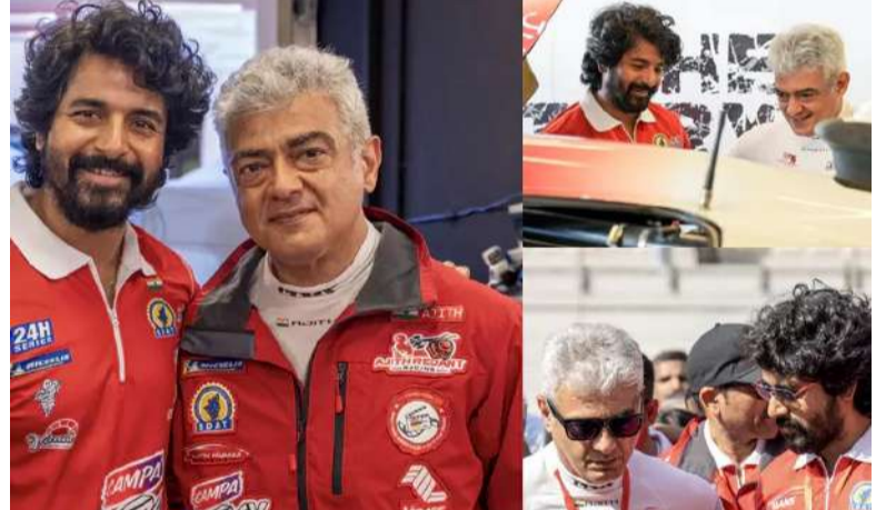
గతేడాది 'విదాముర్యా', 'గుడ్ బ్యాడ్ అగ్గీ' తో ప్రేక్షకుల ముందుకొచ్చారు అజిత్. శివకార్తికేయన్ లేట్ డి. ప్రస్తుతం ఓటీటీ 'జీ 5'లో ఫ్రీమింగ్ అవుతోంది.

అబుదాబిలో జరుగుతున్న 'యూఎస్ డి ఫెస్టివల్'లో ప్రముఖ నటుడు, ప్రొడ్యూసర్ శివకార్తికేయన్ మరో నటుడు శివకార్తికేయన్ కలిశారు. ఆయనతో దిగిన ఫొటోలను అభిమానులతో పంచుకుంటూ.. "స్పూర్తి దాయకమైన వ్యక్తి ఒకరోజు" అంటూ ఆనందం వ్యక్తం చేశారు. చేసే పనిపై ఆసక్తి, ఆంకితభావం అంటే ఏంటో ప్రశ్నలు చూశానంటూ అజిత్ ను కొనియాడారు. ఈ ఫొటోలు నెట్టింట్ వైరల్ గా మారాయి. 'కాంటిన్యూస్ అదిరింది' అంటూ ఈ ఫొటోల ఫ్యాన్స్ సోషల్ మీడియాలో కామెంట్లు వదుతున్నారు. రేసింగ్లో అజిత్ డీవీఎ అంతర్జాతీయ పోటీల్లో సత్కారాలను సంగతి తెలిసింది. అబుదాబిలోని యూఎస్ మెరిటా న్యూస్ డిజిటల్ జరుగుతున్న రేస్ లో పాల్గొంది. నేటి (ఫిబ్రవరి 8) ఫెస్టివల్ ఫూల్ కానుంది. అజిత్ రేసింగ్ తెలిస్తే ఓ ప్రాజెక్టు తెరకెక్కించనున్నట్లు దర్శకుడు ఎ.ఎల్. విజయ్ ఇటీవల ఓ ఇంటర్వ్యూలో చెప్పడం గమనార్హం. సినిమాల విషయానికొస్తే..