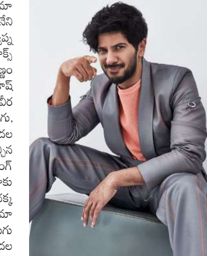
చేస్తున్నారు. ప్రస్తుతం ఈ న్యూస్ న్యూస్ సోషల్ మీడియాలో వైరల్ గా మారింది.