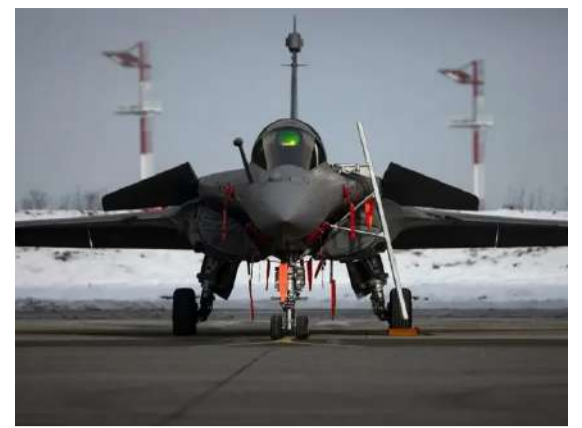
114 రఫేల్ జెట్ల ఒప్పందం ఖరారు!