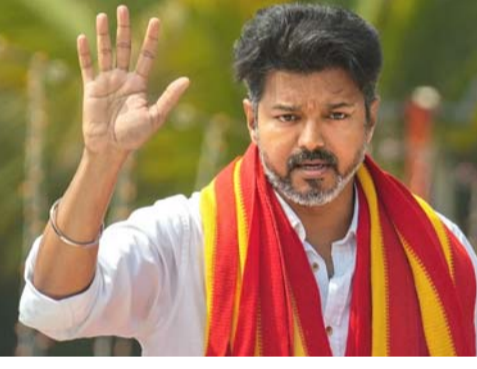
చెన్నై (తెలుగోడు), ఫిబ్రవరి 8 :

ప్రజాదరణే ఓట్లుగా మార్చే సమరానికి సిద్ధం.. చెన్నై నుంచి తొలి పోరు.. వి అనే అక్షర నియోజకవర్గాలపై గురి.. భారతీయ జనతాపార్టీ సిద్ధాంత శత్రువు.. ధ్రావిడ ముందేటి సంఘం రాజకీయ ప్రత్యర్థి.. స్థానిక ఎన్నికల విజయంతో శాసన సభపై భారీ ఆశలు..