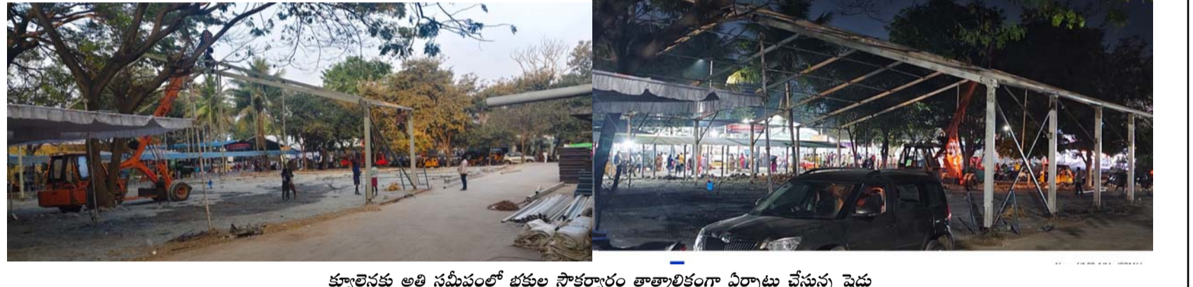
కూర్మలైస్లకు అతి సమీపంలో భక్తుల సౌకర్యార్థం తాత్కాలికంగా ఏర్పాటు చేస్తున్న షెడ్యూల్