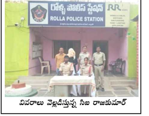
వివరాలు వెబ్సైటుపై సీబి రాజకుమార్