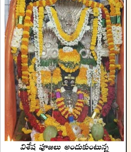
విశేష పూజలు అందుకుంటున్న కాటి కోటేశ్వరుడు

కాటి కోటేశ్వరుడికి ప్రత్యేక పూజలు.. ఇతలపల్లి (తెలంగాణ), ఫిబ్రవరి 8 : మాఘమాసాన్ని పురస్కరించుకుని మండలంలోని పలు గ్రామాల్లో మాఘమాస దీక్షలు చేపట్టిన మహిళలు మాడవ ఆదివారం సందర్భంగా దేవాలయాల వద్ద భక్తిశ్రద్ధలతో పాల పొంగుల కార్యక్రమాన్ని నిర్వహించారు. ఆదివారం తెల్లవారుజామునే భక్తులు సమీప దేవాలయాలకు చేరుకుని స్వామివారికి ప్రదక్షణలు చేసి ప్రత్యేక పూజలు నిర్వహించారు. అనంతరం మొక్కులు వెల్లించుకోవడంతో ఆలయ ప్రాంగణాలు భక్తులతో కిక్కిరిసిపోయాయి. దేవాలయాల వద్ద మహిళలు కొత్త కుండల్లో పాలు, బియ్యం కలిపి సంప్రదాయబద్ధంగా నైవేద్యాన్ని తయారు చేశారు. అనంతరం వండిన నైవేద్యాన్ని స్వామివారికి సమర్పించి తీర్ధప్రసాదాలను పంపిణీ చేశారు. మండలంలోని నండవపూర్ కాటికోటేశ్వర, సంగమేశ్వర క్షేత్రాలు, కోడేకండ్ల వీరనారాయణ స్వామి ఆలయం, మ్యాంపంతం, రామాపురం, డి.చెల్లపల్లి సిద్ధేశ్వరాలయం, దంపెట్ల చెన్నకేశవాలయం, ముద్దూరు, పోట్లమర్రి శివాలయం, గంటాపూర్ అప్పస్వామి దేవాలయాలలో పాల పొంగుల ఉత్సవం వైభవంగా జరిగింది. మండలవ్యాప్తంగా ప్రధాన ఆలయాల వద్ద భక్తుల రాకతో పండుగ సందడి నెలకొంది.