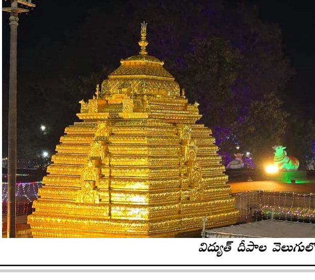
విద్యుత్ దీపాల వెలుగులో ఆలయ గోపురాలు

వాస్తు హోమం తరువాత మండపారాధన చేసి రుద్ర కలశస్థాపన చేయబడింది. కలశస్థాపన తరువాత కలశార్చన జరిపించారు. తరువాత పంచావరణార్చనలు నిర్వహించారు. అనంతరం లోకకల్యాణం కోసం జపానుష్ఠానాలు జరిపించారు.. అంకూరార్చణం.. బ్రహ్మోత్సవాల మొదటిరోజు సాయంకాలం జరిగే అంకూరార్చణం ఎంతో విశేషముంది. ఈ కార్యక్రమములో ఆలయ ప్రాంగణంలోని నిర్మిత పునీత