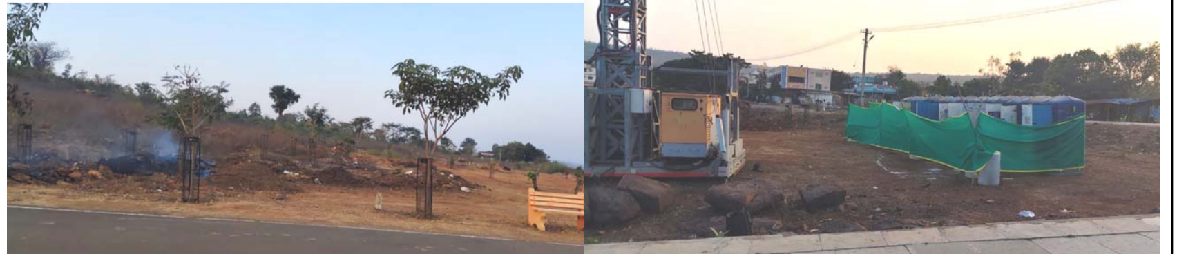
రింగ్ రోడ్ లో ఇంకా చదును చేస్తున్న పార్కింగ్ ప్రదేశాలు