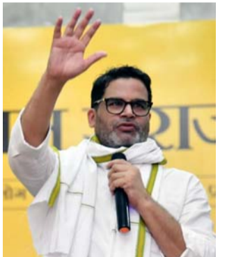
బాగాహి (తెలుగోడు), ఫిబ్రవరి 8 :

రెండున్నర నెలల తర్వాత క్రియాశీలక రాజకీయాల్లోకి రి అంటి.. బహుగా నుంచి బీహార్ నవ నిర్మాణ అభియాన్ కు శ్రీకారం.. డబుల్ ఇంజన్ సర్కార్ పై తీవ్ర విమర్శలు..