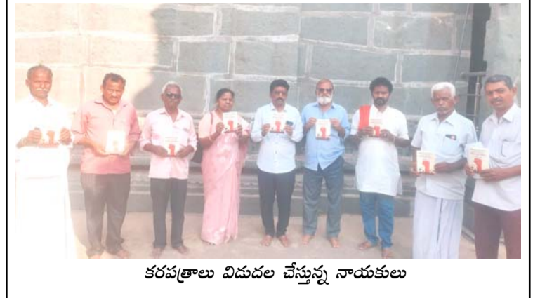
కరవత్రాలు విడుదల చేస్తున్న నాయకులు