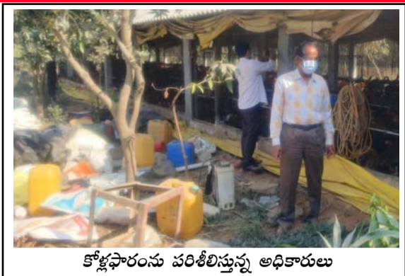
కోళ్ల ఫారాలను పరిశీలిస్తున్న అధికారులు