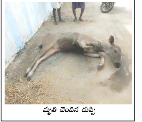
మృతి చెందిన దుప్పి