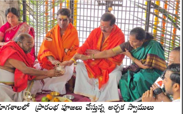
యాగశాలలో ప్రారంభ పూజలు చేస్తున్న అర్చక స్వాములు

దేశం కాంతి సౌభాగ్యాలతో విలసిల్లాలి. ప్రకృతి వైపరీత్యాల నింభందించకుండా సకాలంలో తగినంత చర్యలు కురిసి దేశం పాడిపంటలతో తులతూగాలని, జనులందరికీ ఆయురారోగ్యాల కలిగి వారికి అకాల మరణాలు రాకుండా ఉండాలని, దేశంలో అగ్నిప్రమాదాలు, వాహన ప్రమాదాలు మొదలైనవి జరగకుండా ఉండాలని, ప్రజలందరూ సుఖశాంతలతో ఉండాలంటూ ఆలయ అర్చకులు, వేదపండితులు సంకల్పపఠనం చేశారు. పుణ్యాహవచనం.. గణపతిపూజ తరువాత పుణ్యాహవచనం జరిపించబడింది. వృద్ధి మరియు అభ్యుదయాలు కోసం ఈ పుణ్యాహవచనం జరిపించారు. చందీశ్వరపూజ.. సంకల్పపఠనం తరువాత చందీశ్వరపూజ జరిపించారు. బ్రహ్మోత్సవాలు సృష్టికర్త అయిన బ్రహ్మదేవుని ఆధ్వర్యంలో, క్షేత్రపాలకుడైన వీరభద్రస్వామి పర్యవేక్షణలో, శివపరివార దేవతలలో ఒకరైన చందీశ్వరుని నాయకత్వంలో నిర్వహించబడుతాయని చెప్పారు. అందుకే యాగశాల ప్రవేశం తరువాత చందీశ్వరుని ప్రత్యేకంగా పూజాదికాలు జరిపించడం