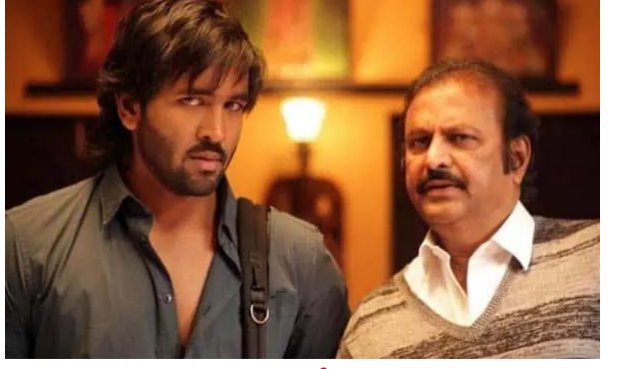
తిరుపతి (తెలుగోడు), ఫిబ్రవరి 8 :

మంచు మోహన్ బాబు విశ్వవిద్యాలయానికి సంబంధించిన విద్యార్థి నేతల కిడ్నాప్ కేసులో కీలక పరిణామం చోటుచేసుకుంది. నటుడు, మూవీ ఆర్టిస్ట్ అసోసియేషన్ అధ్యక్షుడు మంచు విష్ణుపై కేసు నమోదు కావడంతో ఈ వ్యవహారం ఇప్పుడు సిసీ, రాజకీయ వర్గాల్లో సంవలనంగా (మిగతా 2లో)