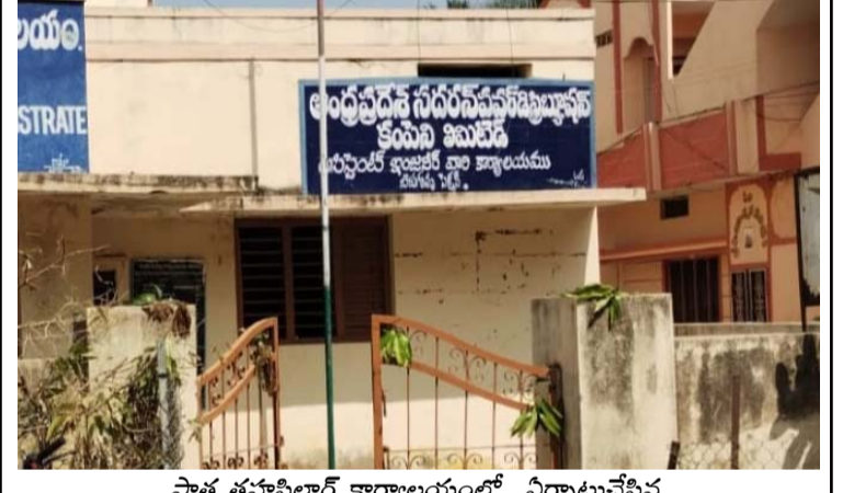
పాత తహసీల్దార్ కార్యాలయంలో ఏర్పాటుచేసిన విద్యుత్, అంగన్వాడీ కార్యాలయాలు