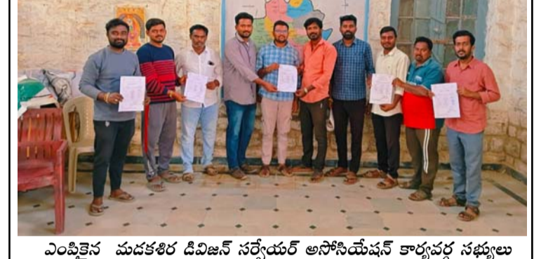
ఎంపికైన మదకశిర డివిజన్ సర్వేయర్ అసోసియేషన్ కార్యవర్గ సభ్యులు