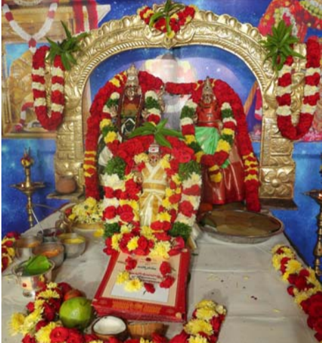
అమరావతి (తెలుగోడు), ఫిబ్రవరి 8 :

దర్శన విధానాల్లో మార్పులు, భక్తుల సౌకర్యాలనికీ ప్రత్యేక ఏర్పాట్లు..