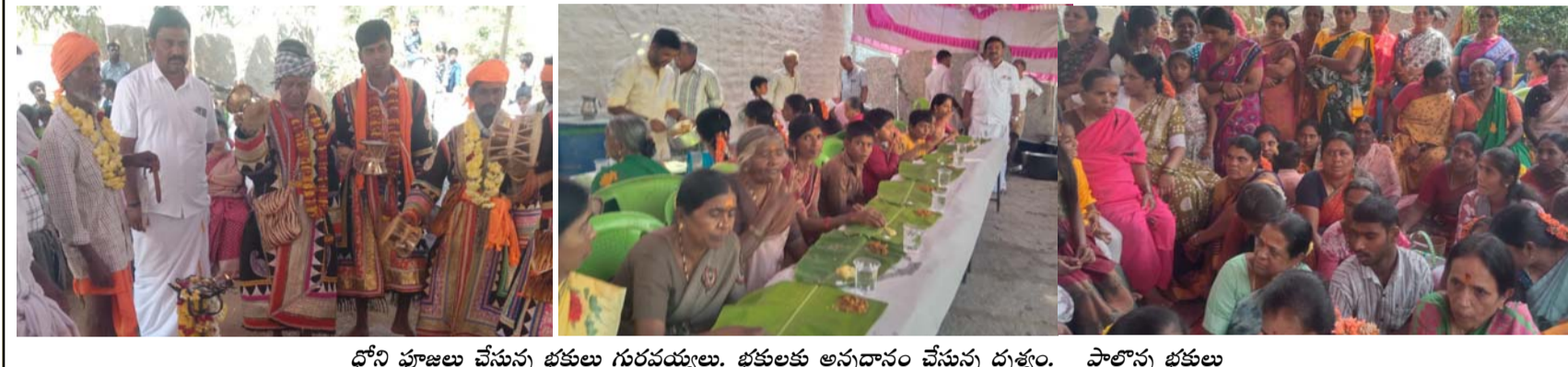
ధోని పూజలు చేస్తున్న భక్తులు గురవయ్యలు. భక్తులకు అన్నదానం చేస్తున్న దుప్పి. పాల్గొన్న భక్తులు