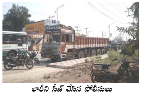
లారీని సీజ్ చేసిన పోలీసులు