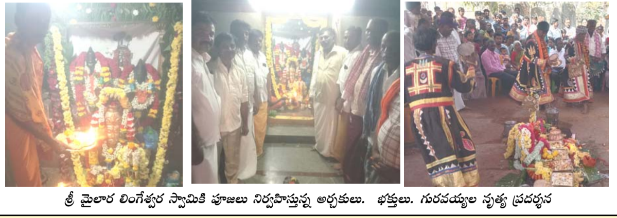
శ్రీ మైలార లింగేశ్వర స్వామికి పూజలు నిర్వహిస్తున్న అర్చకులు. భక్తులు, గురవయ్యల సృష్ట ప్రదర్శన