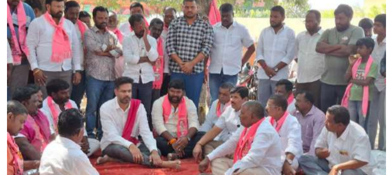
జీఆర్ఎస్ అభ్యర్థులతో కలిసి ప్రచారం నిర్వహిస్తున్న సాయిబాబా