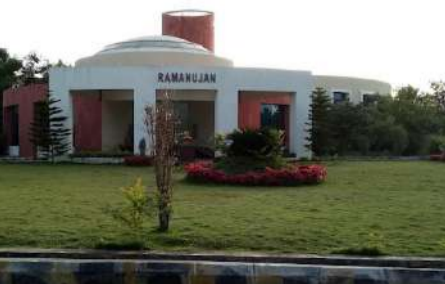
వర్షాల్లోని సీ ఆర్ రావు విభాగం