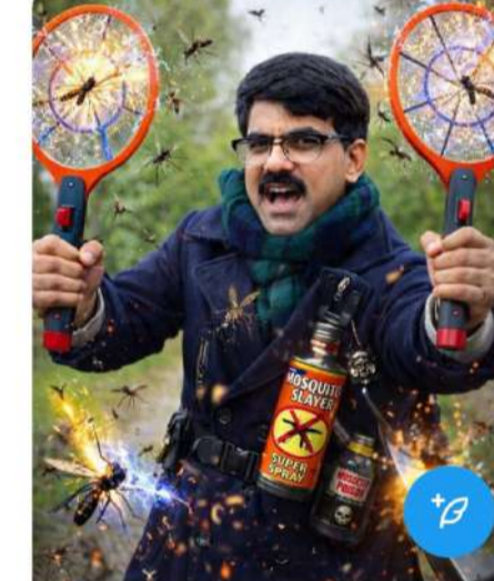
నగర వాసి సోషల్ మీడియాలో చేసిన పోస్టు

Mosquitoes here are not a nuisance but endangering lives of humans. Mosquito bats are a basic Show more