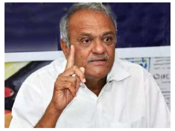
పాంసలేటితోనే సీఎంకు పదవీ గండం: నారాయణ 3లో