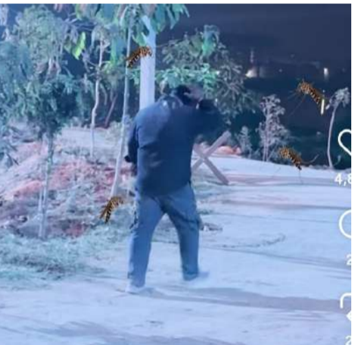
వైరల్ గా మారిన కార్మికియ వీడియో

ఈ-కబురు, శేరిలింగంపల్లి : ""జిహెచ్ఎంసీలో జీవించాలంటే ముందు దోమలను చంపడం నేర్చుకోవాలి.. లేదంటే రక్తం పీల్చే దోమలు మీ ప్రాణాలను హరించడం ఖాయం... అంటూ సోషల్ మీడియా వేదికగా ఓ నగర జీవ ఆక్రోశం.. వీ డోంట్ ట్రబుల్ దీ ట్రబుల్... దీ ట్రబుల్ కేమ్ టూ అస్... అంటూ ఓ స్టూర్ డైరెక్టర్ కుమారుడు సెటైర్ వీడియో తీసి ఉక్రోశం... రక్తం పీల్చి, విష జ్వరాల బాలన పడవేస్తున్న దోమలపై యుద్ధం ప్రకటించి ధర్మా నిర్వహించిన నగరంలోని ఓ కాలనీ... రేషన్ దుకాణం ముందు దోమలతో కన్నీ పడుతున్న ప్రజల అగణాత్ముల వీడియో తీసి వైరల్ చేసిన మరో సోషల్ మీడియా వారియర్... ఇంతగా ఆందోళనలు, నిరసనలు వ్యక్తం అవుతున్నా జిహెచ్ఎంసీ అధికారులు మాత్రం మొద్దు నిద్ర వీడడం లేదు. ప్రజల సమస్యలను పరిష్కరించకుండా గాలికి వదిలేసి, తమ జేబులు నింపుకోవడంపై దృష్టి సారీస్తున్నారు. ""