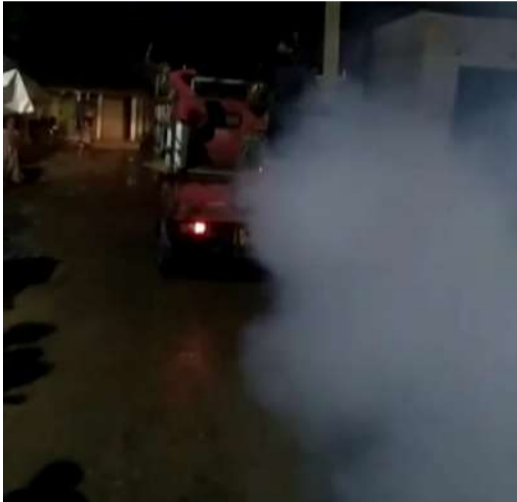
నగరంలో కనిపించని ఫాగింగ్

గ్రేటర్ హైదరాబాద్ పరిధిలో దోమలు స్వైర విహారం చేస్తున్నాయి. పగలు, రాత్రి సంబంధం లేకుండా విజృంభిస్తున్నాయి. నగర ప్రజలకు కంటిమీద కుసుకులేకుండా చేస్తున్నాయి. దోమల బెడదతో ప్రజలు తీవ్ర ఇబ్బందులకు గురవుతున్నారు. సీజన్ తో సంబంధం లేకుండా దోమలు వ్యాపిస్తున్న తీరుపై నగర ప్రజానీకం ఆందోళన చెందుతోంది. దోమల దాడికి వందలాది మంది విషజ్వరాల భారిన పడుతున్నారు. ఫాగింగ్ లేకపోవడం, పారిశుధ్యం అవస్థలూ మారడం, చెరువుల్లో గుర్రపు దొంగ తొలగించకపోవడం కారణంగా దోమల బెడద ఎక్కువవుతోందని ఆరోపణలు వెల్లువెత్తుతున్నాయి. మురుగు కాలువలు, నాలల్లో పూడిక తీయకపోవడంతో దోమలకు ఆవాస కేంద్రాలుగా మారుతున్నాయి. దోమల దాడికి బల్బియా ప్రజలు బెంబేలెత్తుతున్నారు. ముఖ్యంగా హైటెక్ సిటీ దోమల మయంగా మారింది. ఎక్కడ చూసినా తీవ్రమైన దోమల బెడదతో ప్రజలు అభ్రాంతులై, జీ హెచ్ఎంసీ అధికారులు మాత్రం మొద్దునిద్రలో ఉంటున్నారు. గతకొన్ని నెలలుగా క్షేత్రస్థాయిలో ఫాగింగ్, యాంటీ లార్వా స్ప్రేయింగ్ పనులను దాదాపుగా జీహెచ్ఎంసీ ఆపేసిందని ప్రజలు ఆరోపిస్తున్నారు. సాయంత్రం అయితే ఇళ్లు, బాల్కనీలు, అపార్ట్మెంట్లు, ఓపెన్ ఫ్లోరులకు క్షేత్రస్థాయిలో దోమలు విజృంభిస్తున్నాయి.