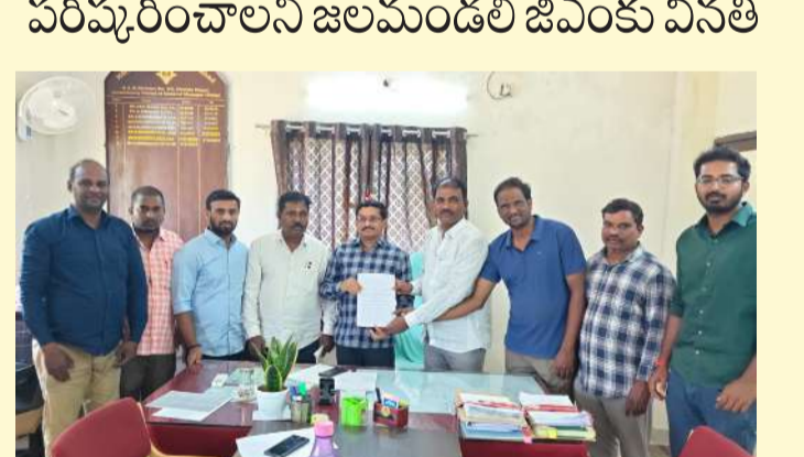
జలమండలి జీవించి వినతిపత్రం సమర్పిస్తున్న అంజయ్య నగర్ వాసులు

ఈకబురు, శేరిలింగంపల్లి : శేరిలింగంపల్లి నియోజకవర్గ పరిధిలోని అంజయ్య నగర్ లో త్రాగునీటి సమస్యతో స్థానికులు తీవ్ర ఇబ్బందులు పడుతున్నారని, వెంటనే సమస్యను పరిష్కరించాలని కోరుతున్న సోమవారం స్థానికులు జలమండలి జనరల్ మేనేజర్ కు వినతి పత్రం సమర్పించారు. ఈ సందర్భంగా అంజయ్య నగర్ వాసులు మాట్లాడుతూ అంజయ్య నగర్ జి.ఎస్.ఆర్. తాగునీటి సమస్య స్థానికులను తీవ్ర ఇబ్బందులకు గురి చేస్తున్నదని, పలు ప్రాంతాల్లో నీటి సరఫరా జరగకపోగా, మరికొన్ని ప్రాంతాల్లో ప్రైవేట్ త్రాగునీటి సరఫరా జరుగుతున్నదని, ఇప్పటివరకు టైల్స్ నెట్