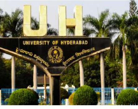
హెచ్ నీ యు

రు. క్షాన్ రూమ్ లో ఉన్న 50 లాప్ టాప్ లను దుండగులు చోరీ చేసి అక్కడి నుంచి ఉదారించారు. తరగతి గదిలో ల్యాప్ టాప్ లు మాయం కావడం సోమవారం ఉదయం గమనించిన వర్షాల్లో యూజిమాస్యం గచ్చిబౌలి పోలీసులకు పిచ్చుకలు చేసింది. విచారించిన పోలీసులు తరగతి గది కిటికీ గ్రెట్స్ తొలగించి ఉండడం, కారు టైర్ గుర్తులు ఉన్నట్లుగా గుర్తించారు. వివరాల కోసం వర్షాల్లోని సిసి టెమెరాలను మొత్తం పరిశీలిస్తున్నారు. కాగా సీఆర్ రావు ఇన్స్టిట్యూట్ విభాగం తరగతి గదిలో భారీ ఎత్తున ల్యాప్ టాప్ లు ఉన్నాయని తెలిసిన వారే చోరీకి పాల్పడి ఉంటారని పోలీసులు భావిస్తున్నారు. దీంతో సదరు విభాగంలో పనిచేస్తున్న సిబ్బంది, విద్యార్థుల వివరాలను మొత్తం సేకరిస్తున్నారు. కాగా మొత్తం 50 లాప్ టాప్ లు చోరీకి గురికావడంతో చోరీలో పాల్గొన్నవారు ఒక్కరు అయ్యే అవకాశం లేదని, ఎక్కువ మంది కలిసి ఈ చోరీ చేసి ఉంటారని అనుమానిస్తున్నారు. కాగా చోరీకి గురైన లాప్ టాప్ లు చుట్టూ రోజే వర్షాల్లోకి తీసుకురాగా, వీటి విలువల క్షేత్రంలో ఉంటుందని తెలుస్తుంది. ఈ మేరకు గచ్చిబౌలి పోలీసులు కేసు, సమాచారం చేసుకొని దర్యాప్తు చేపట్టారు.