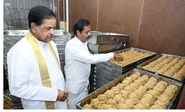
తిరుమల (తెలుగోడు), ఫిబ్రవరి 9 :

ప్రతి కౌంటర్ వద్ద యూపిఐ పేమెంట్.. భక్తులకు సులభంగా శ్రీవారి ప్రసాదం అందించేందుకు టీటీడీ కీలక నిర్ణయాలు