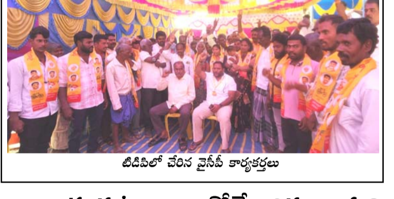
టిడిపిలో చేరిన వైసిపి కార్యకర్తలు