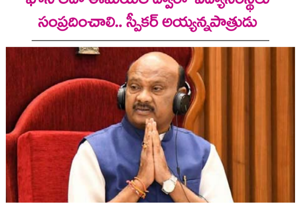
అమరావతి (తెలుగోడు), ఫిబ్రవరి 9 :

ఫోన్ లేదా ఈమొబిల్ ద్వారా విద్యార్థులకు సంప్రదించాలి.. స్పీకర్ అయ్యన్నపాత్రుడు