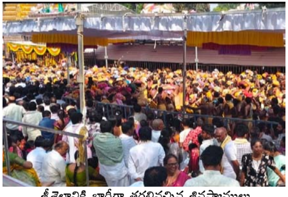
శ్రీశైలానికి భారీగా తరలివచ్చిన శివస్వాములు

మౌలిక వసతులు లేవంటూ నిరసన.. ఈఓ డౌన్ డౌన్ అంటూ నినాదాలు.. రెండవ రోజే ఇట్లా ఉంటే మహాశివరాత్రి రోజు పరిస్థితి ఏంటి అని ప్రశ్నించారు. శివ స్వాముల తాకిడి ఎక్కువగా ఉంటుందని తెలిసి దేవస్థానం అధికారులు సరైన ఏర్పాట్లు చేయలేదని, స్వర్ణ దర్భణంలో అంతటినీ జాప్యం పట్ట ఆసనానం వ్యక్తం చేశారు. భక్తులు, శివ స్వాముల పట్ల దేవస్థానం అధికారుల తీరు బాగాలేదని గంటల తరబడి క్యూ లైన్లో నిలిచి అలసిపోయిన వారికి కనీస మౌలిక వసతులు కూడా లేవని, ఇదేమీ పాలన అంటూ నిరసన వ్యక్తం చేశారు. శివ భక్తులపై భద్రత సిబ్బంది రోడ్లెల్లా ప్రవర్తిస్తున్నారని, భక్తులు, శివ స్వాముల భద్రతను ప్రమాదంలోకి నెట్టి అధికారులు చోడ్డం చూస్తున్నారని శివ స్వాములు వాపోయారు. క్యూలైన్లలో గంటల తరబడి వేచిఉన్న తమ పట్ల అధికారుల దురుసు ప్రవర్తన, సెక్యూరిటీ సిబ్బంది మాట తీరు సరిగా లేదని శివ స్వాములు నిరసనకు దిగారు. కృష్ణదేవరాయ క్యూలైన్ విరగొట్టి లోపలికి వెళ్లే పరిస్థితి వచ్చింది. ఇంత జరుగుతున్నా అధికారులు నిమ్మకు నీరెత్తివట్టే ఉన్నారే తప్ప ఎటువంటి మౌలిక వసతులు ఏర్పాటు చేయలేదని శివస్వాములు పెద్ద ఎత్తున ఈఓ డౌన్ డౌన్ అంటూ నిరసనకు దిగారు. ఇప్పుడే పరిస్థితి