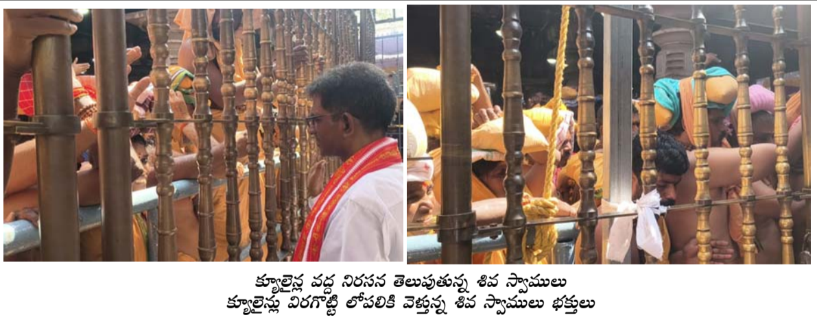
క్యూలైన్ల వద్ద నిరసన తెలుపుతున్న శివ స్వాములు క్యూలైన్ల విరగొట్టి లోపలికి వెళ్తున్న శివ స్వాములు భక్తులు