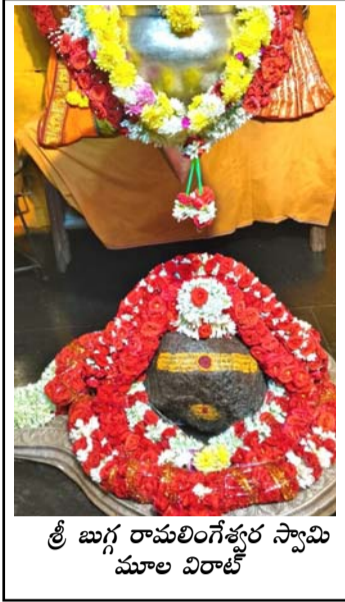
శ్రీ బుగ్గ రామలింగేశ్వర స్వామి మూల విరాట్

వెలుతారు. స్థల పురాణం ప్రకారం తాటికి రాక్షసిని సంహరించిన అనంతరం ప్రాయశ్చిత్తంగా శ్రీరామచంద్రుడు ఇక్కడ స్వయంభూ శివలింగాన్ని ప్రతిష్ఠించాడని, అప్పటినుంచి ఈ ఆలయం శ్రీ బుగ్గ రామలింగేశ్వర స్వామి ఆలయంగా ప్రసిద్ధి చెందిందని చరిత్రకారులు పేర్కొంటున్నారు. శ్రీ.శ. 1460 ప్రాంతంలో ఈ ఆలయ నిర్మాణం జరిగినట్లు సమాచారం. ప్రతి సంవత్సరం చైత్ర, వైశాఖ, జ్యేష్ఠ మాసాల్లో ప్రధాన ద్వారం గుండా సాయంత్రం సూర్యకిరణాలు నేరుగా స్వామి లింగంపై పడటం మరో విశేషం.