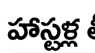
అమరావతి (తెలుగోడు), ఫిబ్రవరి 9 :

2027 గోదావరి పుష్కరాలకంటే ముందే పూర్తి లక్ష్యం.. పెండింగ్ బకాయిల విడుదలపై కేంద్రంపై ఒత్తిడి.. కేంద్ర జలశక్తిమంత్రి సీఎల్ పాటిల్ తో కీలక భేటీ.. గత ప్రభుత్వ నిర్ణయాల ప్రాజెక్టు నష్టానికి కారణం.. పోలవరం జాతికి అంకితం చేయడమే ప్రభుత్వ లక్ష్యం..