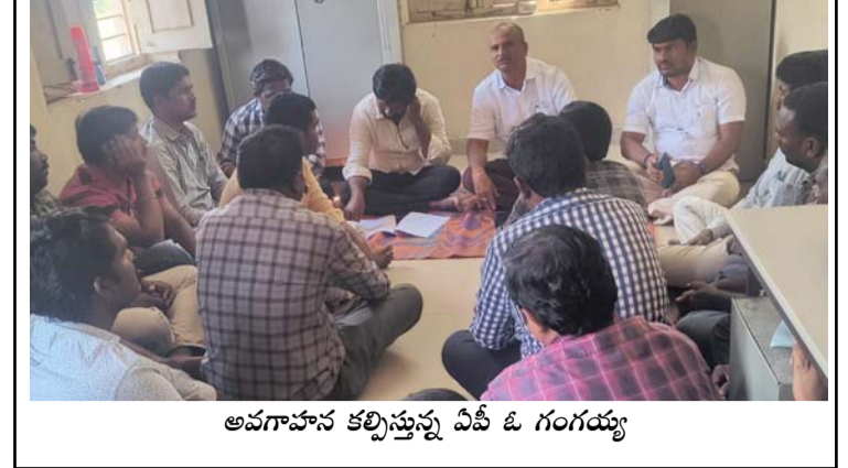
అవగాహన కల్పిస్తున్న ఏపీ ఓ గంగయ్య