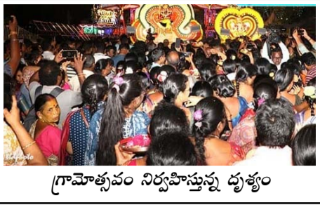
గ్రామాభివృద్ధి నిర్వహిస్తున్న భువ్వం