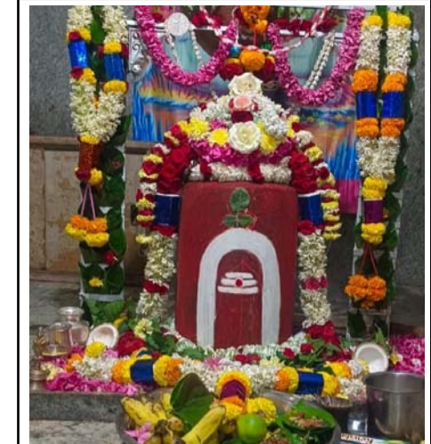
ప్రత్యేక అలంకరణలో మరకత లింగ శ్రీ రామేశ్వర స్వామి