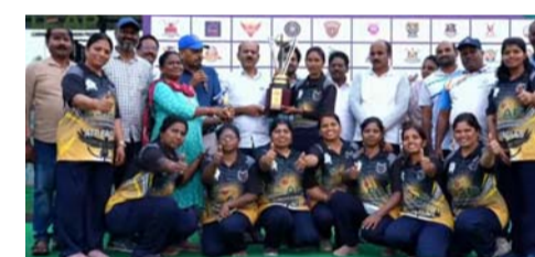
రాష్ట్రస్థాయి లిప్స్ త్రోబాల్ పోటీల్లో అనంతపురం జట్టు విజేత