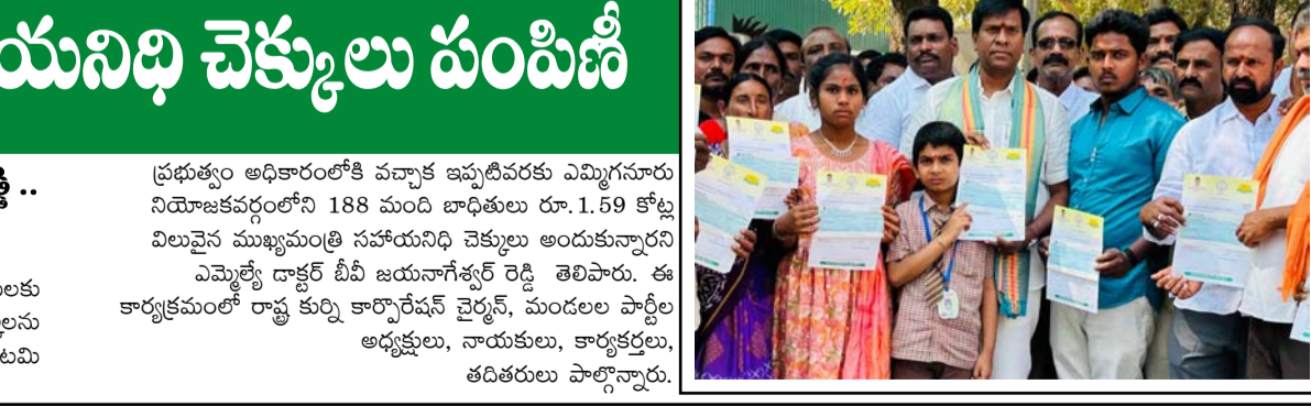
అభిదారులకు ముఖ్యమంత్రి సహాయనిధి చెక్కులు పంపిణీ చేస్తున్న అమ్మెళ్లె డాక్టర్ బీబీ జయనాగేశ్వర్ రెడ్డి