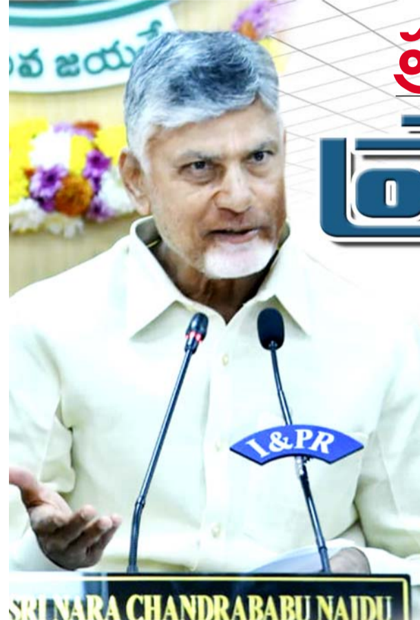
SRI NARA CHANDRABABU NAIDU

Published From - Vijayawada, Anantapur, Sri Satyasai, Kurnool, Nandyala, Kadapa, Annamayya, Srikakulam, Nellore, chittoor, Tirupati