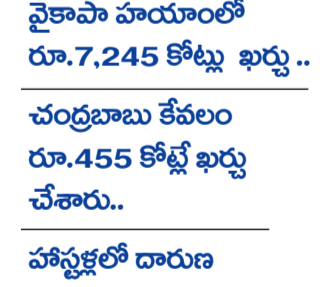
అమరావతి (తెలుగోడు), ఫిబ్రవరి 9 :