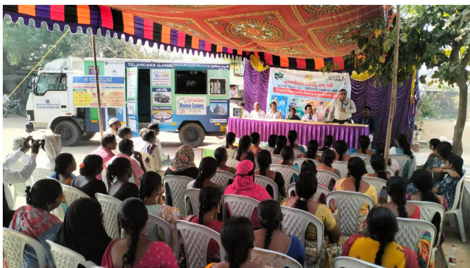
అవగాహన కార్యక్రమంలో పాల్గొన్న ప్రజలు

నిర్మల్ జిల్లా బీరవెల్లి మార్చ్ 9 అమృత్ తెలంగాణ తెలంగాణ గ్రామీణ బ్యాంకు ప్రాంతీయ శాఖ ఆధ్వర్యంలో సారంగాపూర్ మండలంలోని బీరవెల్లి గ్రామంలో సోమవారం, సైబర్ నేరాలపై బ్యాంకు అధికారులు అవగాహన కార్యక్రమం నిర్వహించారు. సంచార వాహనం ఏర్పాటు చేసి, నేటి సమాజంలో జరుగుతున్న సైబర్ మోసాలు, సైబర్ నేరాలపై అప్రమత్తత, బ్యాంకింగ్ వ్యవస్థతో ముడిపడి ఉన్న