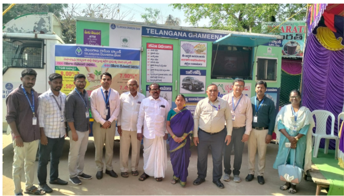
బీరవెల్లిలో ప్రజలకు సైబర్ నేరాలపై అవగాహన కల్పిస్తున్న బ్యాంకు అధికారులు