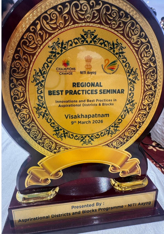
నీతి అయోగ్ బెస్ట్ అవార్డు పొందిన దృశ్యం

నిర్వహణ, అక్షరాస్యత, విద్యార్థుల్లో నైపుణ్యాల పెంపు, మౌళిక సదుపాయాల మెరుగు, తదితర అంశాల్లో అద్భుత ప్రగతి సాధించినట్లు కలెక్టర్ వివరించారు. స్థానిక ప్రజల భాగస్వామ్యం, అధికారుల సమష్టి కృషివల్ల పెంబి భాగస్వామిత్వం సుందరిగా పనిచేసింది గా పేర్కొన్నారు. సంతోషం వ్యక్తం చేశారు. కాగా పెంబి భాగస్వామిత్వం చేపట్టిన కార్యక్రమాలకు గాను, నీతి అయోగ్ బెస్ట్ ప్రాక్టీసెస్ సెమినార్ కు నిర్మల్ జిల్లా ఎంపికయ్యింది. తెలంగాణ నుంచి కేవలం రెండు జిల్లాలు మాత్రమే ఎంపికయ్యడం మన జిల్లాకు గర్వకారణం. పెంబి భాగస్వామిత్వం విజయ ఖ్యాతి మరోసారి చాటిచెప్పేందుకు ఈ నీతి అయోగ్ బెస్ట్ ప్రాక్టీసెస్ సెమినార్ వేదికయ్యింది పెంబి భాగస్వామిత్వంలో పాలుపంచుకున్న అధికారులకు, ప్రజలకు మరోసారి కలెక్టర్ కృతజ్ఞతలు తెలియజేశారు.