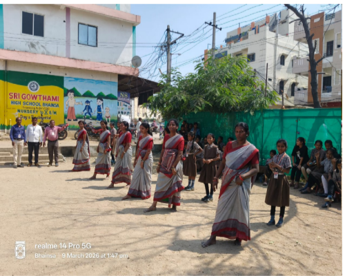
రస్నింగ్ పోటీకి సిద్ధంగా ఉన్న మహిళా ఉపాధ్యాయులు