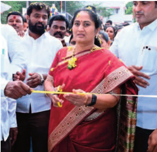
అన్ని అంశాల్లో ప్రాధాన్యత కల్పించింది సీఎం చంద్రబాబేనని పేర్కొన్నారు. ప్రతి ఇంటా మహిళా ఎంటర్ ప్రెన్యూర్ రావాలన్నదే చంద్రబాబు లక్ష్యమని సుష్టం చేశారు.

దారుణాలు అంతా చూశారన్నారు. మహిళా డ్రోహి సీఎం చంద్రబాబు అంటూ జగన్ మాట్లాడడం దుర్మార్గమని పేర్కొన్నారు. ప్రశ్నిస్తే మహిళలపై కూడా కేసులు పెట్టారంటూ సీఎంగా జగన్ వ్యవహరించిన తీరును ఈ సందర్భంగా మంత్రి సవిత తూర్పారబట్టారు. హిందువులు, మహిళలు, బీసీల అభివృద్ధి అంటే సరిపోదంటూ జగన్ కు చిరకలంటించారు. మీ హయాంలో జరిగిన అరాచకాలపై నివేదిక తయారు చేసి గవర్నర్ కు ఇప్పటికే అందజేశామన్నారు. శుభవార్తగా సాగునీటి గురించి మాట్లాడే నైతిక హక్కు వైసీపీ నేతలకు లేదని కుండ బద్దలు కొట్టారు. వారు రాయలసీమ డ్రోహులున్నారు. ఏ రోజు ఒక్క రూపాయి కూడా ఖర్చు పెట్టలేదంటూ వైసీపీ నేతలపై ఆగ్రహం వ్యక్తం చేశారు. డైవర్షన్ పాలిటిక్స్ కోసం వైసీపీ నాయకులు సభలు నిర్వహిస్తున్నారని విమర్శించారు. అయితే ప్రజలు, మహిళలు చాలా క్షారిణిగా ఉన్నారు. మహిళా సాధికారత గురించి ఆలోచించింది పూలే ఆ తర్వాత డాక్టర్ బీ.ఆర్. అంబేద్కర్ అని మంత్రి సవిత తెలిపారు. పూర్వ ఎన్టీఆర్ తర్వాత చంద్రబాబు మాత్రమే మహిళా సాధికారత కోసం పని చేస్తున్నారని సుష్టం చేశారు. మహిళలకు