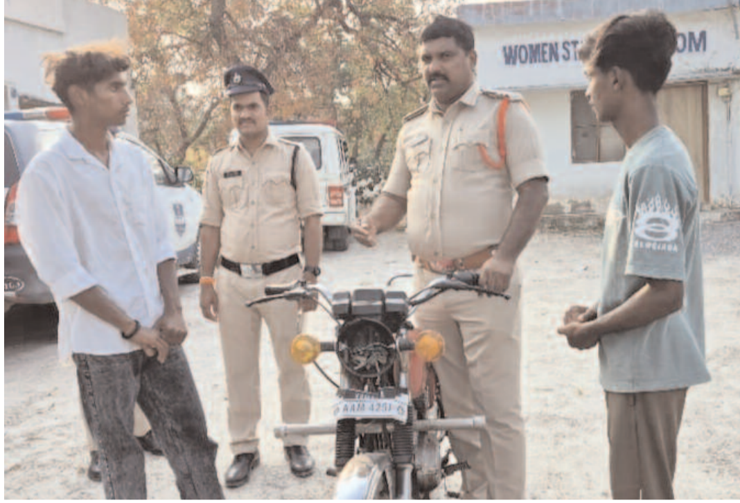
తీసుకోవడం జరుగుతుందని అలాగే మద్యం సేవించి వాహనాలు నడిపితే, చట్టపరమైన చర్యలు చేపడతామని, ప్రతి ఒక్కరూ డ్రైవింగ్ లైసెన్స్ తీసుకోవాలని రోడ్డు నియమాల పట్ల అవగాహన కలిగి ఉండాలని తెలిపారు, కాగా ద్విచక్ర