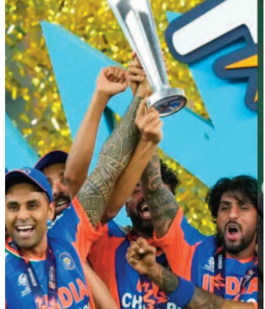
ఢిల్లీ: 2026 టీ20 ప్రపంచకప్లో భారత జట్టు అద్భుత విజయంపై పాకిస్తాన్ మాజీ షేయర్ షోయబ్ అక్తర్ ప్రశంసల వర్షం కురిపించాడు. టీమిండియా అద్భుత

భారత క్రికెట్ వ్యవస్థకు సలాం అంటూ షాకింగ్ కామెంట్స్