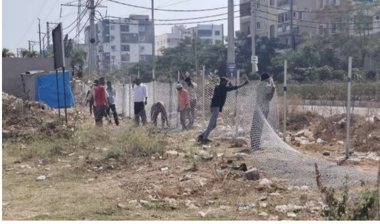
చెరువు భూమి చుట్టూ ఫెన్సింగ్ వేస్తున్న దృశ్యం

రూ.700 కోట్ల విలువైన 4 ఎకరాల చెరువును కాపాడి ఫెన్సింగ్ వేసిన అధికారులు