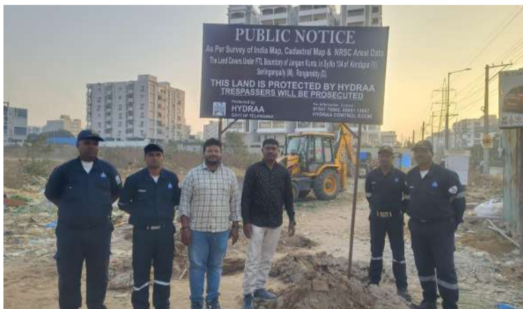
అక్రమణలను తొలగించి జంగమోనికుంటలో బోర్డులు ఏర్పాటు చేస్తున్న హైద్రా