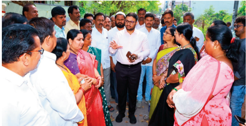
క్రైమ్ కౌంటర్ న్యూస్ కోదాడ మార్చి 10 కోదాడ నియోజకవర్గం ప్రతినిధి