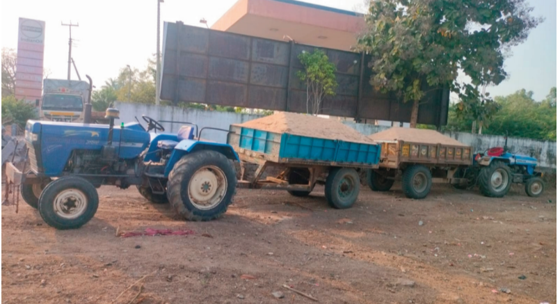
క్రైమ్ కౌంటర్ న్యూస్ కోదాడ, అనంతగిరి, మార్చి 10 కోదాడ నియోజకవర్గ ప్రతి నిధి