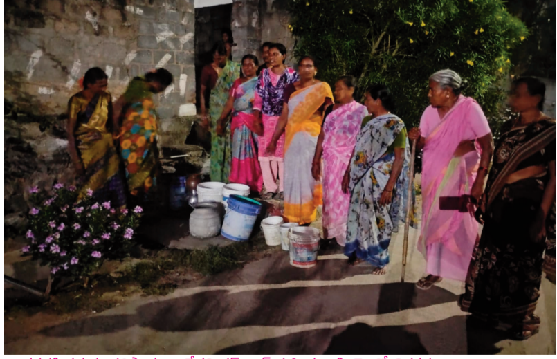
అంతవరకే సమస్య పరిష్కారం కాకపోతే ఫస్ట్ వార్డ్ మహిళలు బిందెలతో నిరసన