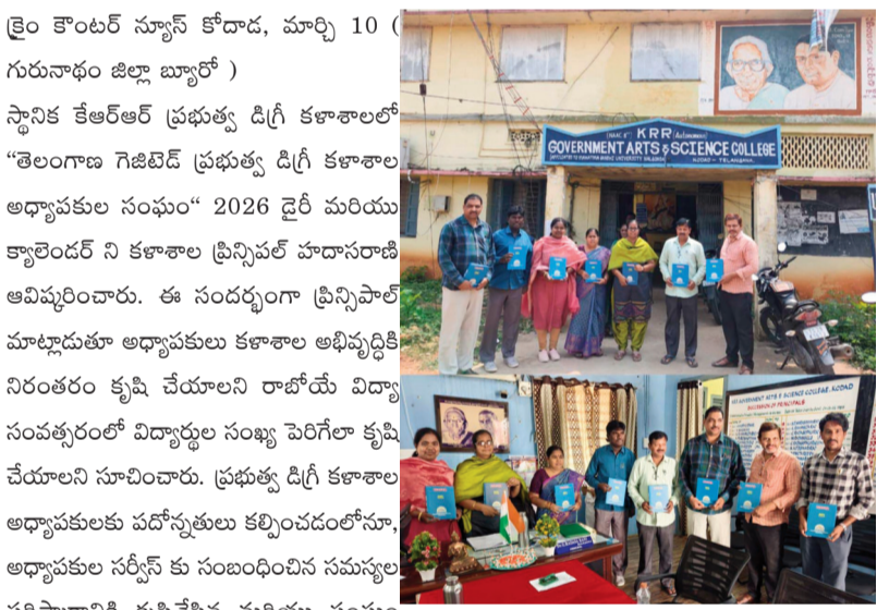
క్రైమ్ కౌంటర్ న్యూస్ కోదాడ, మార్చి 10 ( గురునాథం జిల్లా బ్యూరో )