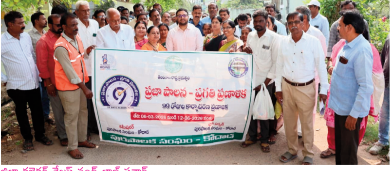
జిల్లా కలెక్టర్ తేజస్ నంద్ లాల్ పవార్.