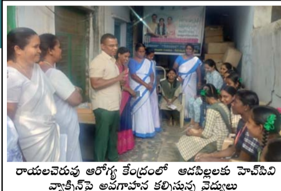
రాయలచెరువు ఆరోగ్య కేంద్రంలో ఆడపిల్లలకు హెచ్.పి.వి వ్యాక్సిన్పై అవగాహన కల్పిస్తున్న వైద్యులు