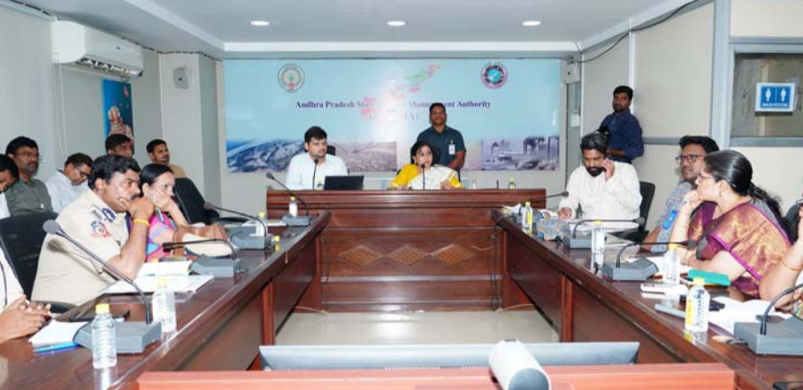
(మొదటి పేజి (తరువాతి))

నిర్వహించారు. ఏపీఎన్డీఎంఏ కార్యాలయంలో జరిగిన ఈ సమావేశంలో కలెక్టర్లు, డైరీ డిపార్ట్మెంట్ల అధికారులు, వివేకానితల సంస్థ అధికారులు పాల్గొన్నారు. ఈ సందర్భంగా 'హాట్ వేవ్ యాక్సన్ ఎ+ -లాన్-2026'ను హోంమంత్రి అభివృద్ధిచేశారు. అధికారులందరూ ఈ ఎ+ -లాన్ ను అనుసరించి ముందుకు సాగాలని ఆదేశించారు. సెంట్రల్ ఆంధ్ర, రాయలసీమ ప్రాంతాల్లో సాధారణం కంటే ఎక్కువ ఉష్ణోగ్రతలు నమోదయ్యే అవకాశం ఉందని ఏపీఎన్డీఎంఏ ఎంపీ ప్రఖ్యాత జైన్ తెలిపారు. రాబోయే రోజుల్లో ఉష్ణోగ్రతలు మరింత పెరిగి వడగాల్లులు ఎక్కువగా వీచే అవకాశం ఉందని మంత్రి ఆ ప్రాంతాల్లో అధికారులను సహజంగా పనిచేయాలని.. వడదెబ్బ కారణంగా ఎలాంటి ప్రాణనష్టం జరగకుండా చూడాలని హోంమంత్రి ఆదేశాలు జారీ చేశారు. పశువుల రక్షణకు సంబంధించి