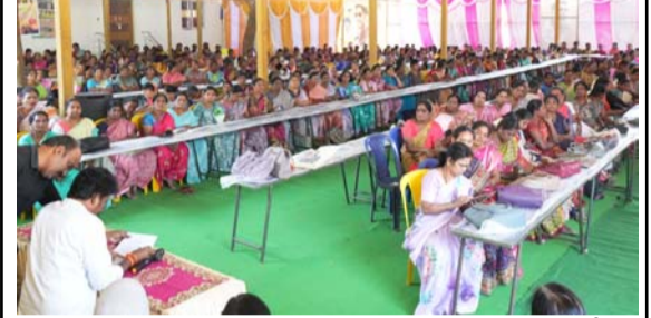
మడకశిర క్యాంపు కార్యాలయంలో నిర్వహించిన అంగన్వాడీల సమావేశంలో సమస్యలు తెలుసుకుంటున్న ఎమ్మెల్యే ఎం.ఎస్.రాజు