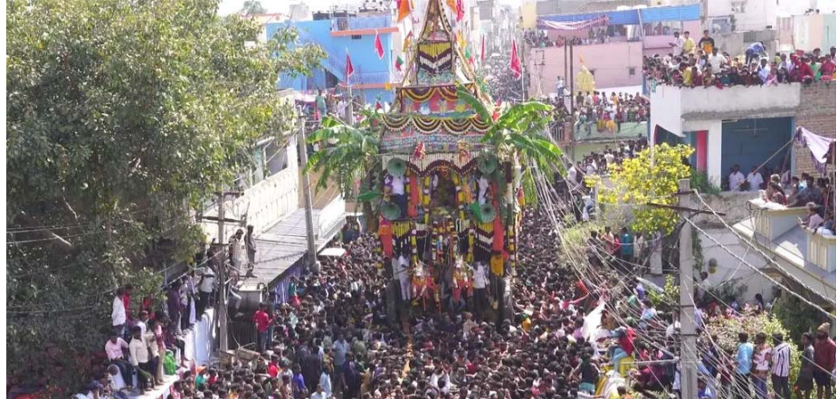
(మొదటి పేజి (తరువాతి))

స్వరణతో తిరువీధులు పులకించాయి. రథంపై స్వామివారు శ్రీదేవి, భూదేవి సమేతంగా భక్తులకు దర్శనమిచ్చారు. లక్షలాది మంది తిలకిస్తుండగా భక్తి భావంతో భక్తులు రథాన్ని లాగుతూ 'లక్ష్మీనరసింహ స్వామికి జై', 'గోవిందా గోవిందా' అంటూ నినాదాలు చేశారు. రథం ఆలయం చుట్టూ ఉన్న ప్రధాన వీధుల మీదుగా మెల్లగా సాగింది. రథయాత్రను వీక్షించేందుకు ఇళ్లపై, దుకాణాలపై నిలబడి భక్తులు స్వామివారిని దర్శించుకున్నారు. రథం సాగుతున్న మార్గంలో భక్తులు హారతులు ఇచ్చి స్వామివారికి నమస్కరించారు. మహిళలు కుంకుమ, పసుపులతో స్వామివారిని ఆహ్వానించారు. పలుచోట్ల భక్తులు సానకం, బెల్లం నీళ్లు, తాగునీరు అందిస్తూ సేవలు అందించారు. అలాగే వివిధ దాతల ఆధ్వర్యంలో అన్నదాన కార్యక్రమాలు నిర్వహించి వేలాది మంది భక్తులకు భోజన సదుపాయం కల్పించారు. భక్తుల రద్దీని దృష్టిలో ఉంచుకుని జిల్లా యంత్రాంగం విస్తృత ఏర్పాట్లు చేసింది. పోలీసులు