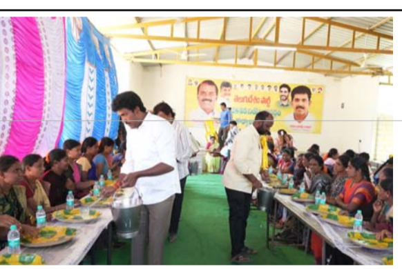
అంగన్వాడీలకు భోజనం వడ్డిస్తున్న ఎమ్మెల్యే