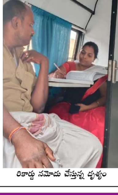
రికార్డు సమాధు చేస్తున్న దృశ్యం