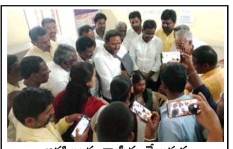
ఆడపిల్లలకు వ్యాక్సిన్లు వేయిస్తున్న ఎమ్మెల్యే కంచర్ల శ్రీకాంత్ తదితరులు