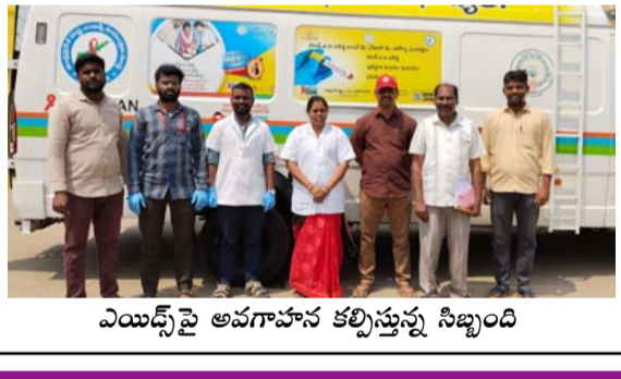
ఎయిడ్స్ పై అవగాహన కల్పిస్తున్న సిబ్బంది

కోసిగి మండలంలో మంగళవారం రాష్ట్ర ఎయిడ్స్ కంట్రోల్ సొసైటీ, జిల్లా ఎయిడ్స్ నియంత్రణ సంస్థ ఆదేశాల సహకారంతో కోసిగి మండలంలో సంచార వాహనం ద్వారా సుఖ వ్యాధులకు సంబంధించి హెచ్ఐవీ పరీక్షలు నిర్వహించడంపై అవగాహన కల్పించారు. ప్రతి గ్రామంలో కూడా 20 ఏళ్ల పైబడిన వారు కచ్చితంగా పరీక్షలు చేసుకొని వారి స్థితిని తెలుసుకోవాలన్నారు. ఈ అవకాశాన్ని గ్రామ ప్రజలందరూ సద్వినియోగం చేసుకోవాలన్నారు. వ్యాధులను తగ్గరగా