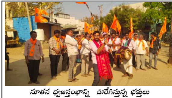
సూతన ధ్వజస్తంభాన్ని ఊరేగిస్తున్న భక్తులు

యాడికి (తెలుగోడు), మార్చి 10 : యాడికి మండల పరిధిలోని చింతలయపల్లి గ్రామ సమీపంలో ఉన్న శ్రీ లక్ష్మీ కొత్త వెంకటరమణ కొత్త రాయుడు స్వామి ఆలయంలో ఏర్పాటు చేయనున్న సూతన ధ్వజస్తంభాన్ని భాజాభజనాత్రిలతో ఊరేగింపు ప్రత్యేక పూజలు చేశారు. శ్రీ లక్ష్మీ వెంకటేశ్వర స్వామి దేవస్థానం నుండి శోభాయాత్రగా యాడికి పురపిఠాల్లో ఉర్రేగించారు. భక్తులు భక్తిచర్యలతో పూలు పండ్లు తింకాయలు సమర్పించారు. భాజానాచా పేల్చి, కాషాయ జెండాలతో యాడికి పురపిఠాల్లో ఊరేగించారు. ఈ కార్యక్రమంలో మహిళలు, పిల్లలు పెద్ద ఎత్తున పాల్గొని గోవిందా గోవిందా అంటూ నినాదాలు చేశారు.