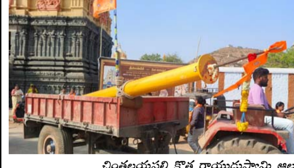
చింతలయపల్లి కొత్త రాయుడుస్వామి ఆలయం సూతన ధ్వజస్తంభాన్ని ఊరేగిస్తున్న భక్తులు