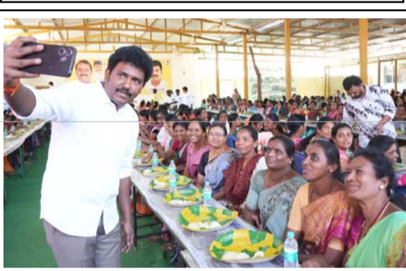
అంగన్వాడీల సమావేశంలో సెల్ఫీ తీస్తున్న ఎమ్మెల్యే ఎం.ఎస్.రాజు. అంగన్వాడీలకు భోజనం వడ్డిస్తున్న ఎమ్మెల్యే