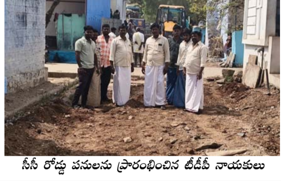
సీసీ రోడ్డు పనులను ప్రారంభించిన టీడీపీ నాయకులు