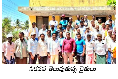
నిరసన తెలుపుతున్న రైతులు