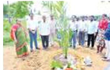
గుర్ల జూలై 10, (మనసులో మాట)

గుర్ల మండలం జమ్మ్యగ్రామంలో నిర్వహించిన ఆయిల్ పామ్ సాగు విస్తరణ కార్యక్రమంలో జిల్లా కలెక్టర్ పాల్గొని ఆయిల్ పామ్ మొక్కలను నాటి కార్యక్రమాన్ని ప్రారంభించారు. అనంతరం ఆయిల్ పామ్ సాగు చేస్తున్న రైతులతో ముఖాముఖి నిర్వహించి, సాగు విధానాలు, తోటల నిర్వహణ, దిగుబడులు, మార్కెటింగ్, ఆదాయం, రైతులు ఎదుర్కొంటున్న సమస్యలపై చర్చించారు. ఈ సందర్భంగా జిల్లా కలెక్టర్ మాట్లాడుతూ, రాష్ట్ర ప్రభుత్వం చేపట్టిన "మిషన్ హార్టికల్చర్" కార్యక్రమంలో భాగంగా జిల్లాలో సాంప్రదాయ పంటల నుంచి అధిక ఆదాయం అందించే ఉద్యాన పంటల వైపు పంటల వైవిధ్యీకరణకు ప్రాధాన్యం ఇస్తున్నట్లు తెలిపారు. ఉద్యాన పంటల విస్తరణ ద్వారా రైతుల ఆదాయం పెరగడంతో పాటు నీటి వనరులను సమర్థవంతంగా వినియోగించుకోవచ్చని పేర్కొన్నారు.