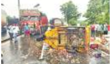
డీకొట్టింది. దీంతో ఆటో పక్కనే ఉన్న ద్విచక్ర వాహనాన్ని డీకొట్టడంతో పాటు అదే సమయంలో రోడ్డుపై నడుచుకుంటూ వెళ్తు

మండలంలోని ఉద్గండపురం జంక్షన్ వద్ద జరిగిన రోడ్డు ప్రమాదంలో ఒకరు తీవ్రంగా గాయపడగా మరో ముగ్గురికి స్వల్ప గాయాలయ్యాయి. శుక్రవారం జరిగిన ప్రమాదానికి సంబంధించి సీఐ జె.మురళి తెలిపిన వివరాల ప్రకారం పలాస నుంచి హైదరాబాద్ వెళ్తున్న ఐచ్ఛర్ వ్యాన్ ఉద్గండ పురం జంక్షన్ లో కూరగాయల లోడ్తో యూటర్న్ తీసుకుంటున్న ఆటోను