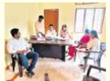
శాతం వరకు సర్ సర్వే పూర్తయిందని

సర్ కార్యక్రమాన్ని వేగవంతం చేయాలని ఎంపీడివో చంద్రశేఖర్ ఆదేశించారు. శుక్రవారం జిల్లూరు సచివాలయంలో సర్ కార్యక్రమానికి సంబంధించి డిజిటలైజేషన్ ప్రక్రియను పరిశీలించారు. ప్రజలు పూర్తిచేసి ఇచ్చిన ఎన్యూమరేషన్ ఫారాలను వెంటనే డిజిటలైజేషన్ చేయాలన్నారు. ఇప్పటివరకు మండలంలో 90