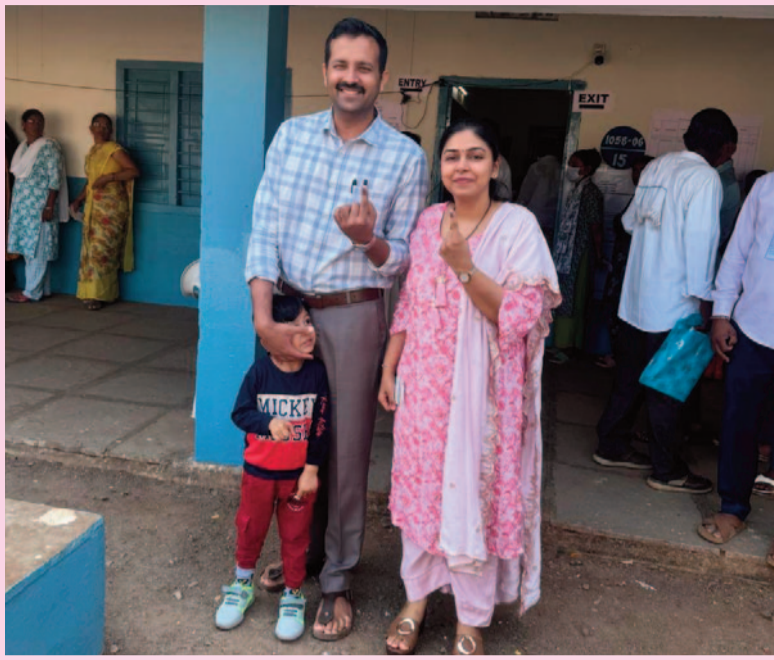
వికారాబాద్, ఫిబ్రవరి, 11(సమయం న్యూస్): మునిసిపల్ ఎన్నికలలో భాగంగా వార్డు నంబర్ 6, పోలింగ్ స్టేషన్ 15 ద్వారా తన కుటుంబ సభ్యులతో కలిసి ఓటు హక్కును బుధవారం వినియోగించుకున్న జిల్లా కలెక్టర్ మరియు మేజిస్ట్రేట్ జిల్లా ఎన్నికల అధికారి ప్రతీక్ జైన్.