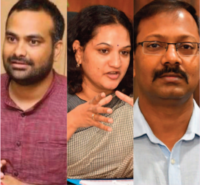
జీహెచ్ఎంసీ కార్పొరేషన్ల కమిషనర్గా ఆర్వీ కర్ణం, సైబరాబాద్ కార్పొరేషన్ల కమిషనర్గా శ్రీజన మల్కాజ్గిరి కార్పొరేషన్ల కమిషనర్గా వినయ్ కృష్ణ రెడ్డిలను నియమించిన ప్రభుత్వం వీరితో సహా 10 మంది ఐఏఎస్ అధికారుల బదిలీ సింగరేణి సిఎండిగా జ్యోతి బుద్ధ ప్రకాష్ను నియమిస్తూ ఉత్తర్వులు జారీ చేసిన ప్రభుత్వం.....!!

జీహెచ్ఎంసీ, మల్కాజ్గిరి, సైబరాబాద్ లను కార్పొరేషన్లుగా ఏర్పాటు చేస్తూ ఉత్తర్వులు