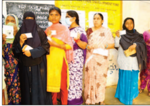
గంటల వరకు కొనసాగింది. అక్కడక్కడా స్వల్ప ఉద్రిక్తతలు మినహా రాష్ట్రవ్యాప్తంగా ఓటర్లు ఉత్సాహంగా

పూర్వం. రాష్ట్రవ్యాప్తంగా అక్కడక్కడా చెదురుచెదురు ఫుటనలు మినహా పోలింగ్ ప్రశాంతంగా ముగిసింది. ఈ నెల 13న ఓట్లు లెక్కింపు ఉంటుంది, 16న కార్పొరేషన్ల మేయర్, డిప్యూటీ మేయర్, మున్సిపాలిటీల చైర్మన్, వైస్ చైర్మన్ ఎన్నిక ఉంటుంది అధికారులు తెలిపారు. తుది ఓటింగ్ శాతం రాత్రికి వెళ్లిడి కానుంది. ఎన్నికల బరిలో ఉన్నవారి అభ్యుత్సాహం ఈనెల 13న తేలబోతుంది. ఈ నెల 13న ఉదయం 8 గంటలకు 136 కేంద్రాల్లో ఓట్ల లెక్కింపు చేపట్టనున్నారు. 16న కార్పొరేషన్ల మేయర్, డిప్యూటీ మేయర్, మున్సిపల్ చైర్మన్, వైస్ చైర్మన్ ఎన్నిక ఉంటుంది. ఉదయం 7 గంటలకే ప్రారంభమైన ఓటింగ్ పక్రియ, సాయంత్రం 5