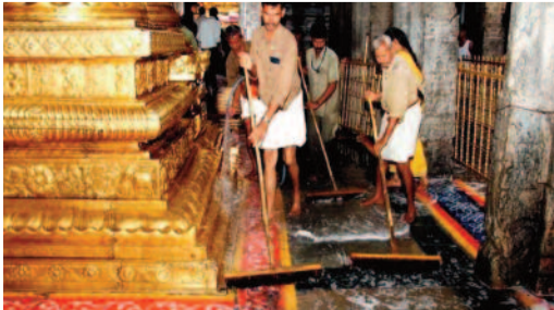
కారణంగా 18వ తేదీ వీటినీ బ్రేక్ దర్శనాలకు సిఫార్సు లేఖలు స్వీకరించరని టీడీపీ తెలిపింది.

ఆక్వార్ తిరుమంజనం నిర్వహించడం ఆపవాయితీగా పోయింది. ఉగాది, ఆదివారం ఆస్వానం, బ్రహ్మోత్సవం, వైకుంఠ ఏకాదశి పర్వదినాల ముందు వచ్చే మంగళవారం కోయిల్ ఆక్వార్ తిరుమంజనం నిర్వహించడం ఆపవాయితీ. కోయిల్ ఆక్వార్ తిరుమంజనం కారణంగా 17న వీటినీ బ్రేక్ దర్శనాలు, అష్టదశ పాదపద్మారాధన సేవను టీడీపీ రద్దు చేసింది. 16వ తేదీ ప్రోటోకాల్ ప్రముఖులకు మినహా వీటినీ బ్రేక్ దర్శనాలకు సిఫార్సు లేఖలు స్వీకరించబడవు. అదేవిధంగా మార్చి 19న ఉగాది ఆస్వానం సందర్భంగా ప్రోటోకాల్ ప్రముఖులకు మినహా వీటినీ బ్రేక్ దర్శనాలు రద్దు చేయడమైంది. ఈ