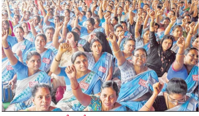
కార్మిక లోకం కేంద్ర ప్రభుత్వం పై విజృంభన