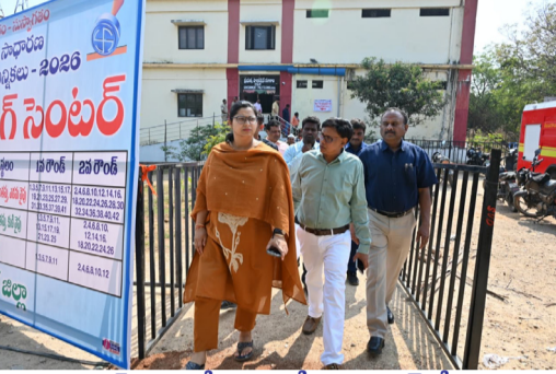
నిర్మల్ జిల్లా కేంద్రంలో కౌంటింగ్ కేంద్రాన్ని పరిశీలిస్తున్న జిల్లా కలెక్టర్