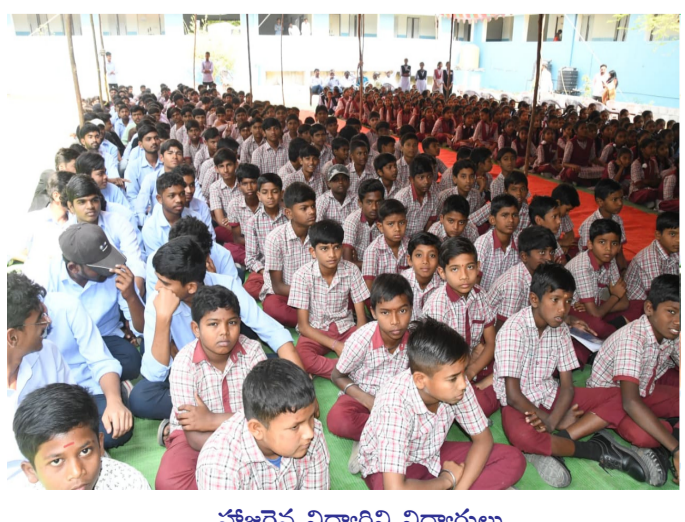
హాజరైన విద్యార్థిని విద్యార్థులు