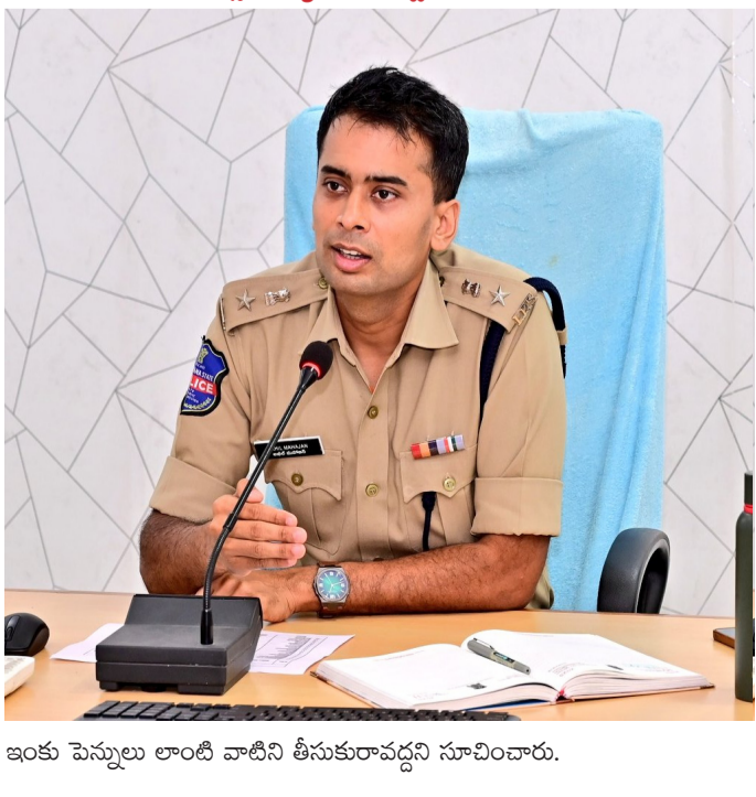
ఇంకు పెన్లులు లాంటి వాటిని తీసుకురావద్దని సూచించారు.

అమృత తెలంగాణ అదిలాబాద్ న్యూస్ అదిలాబాద్ జిల్లా కేంద్రంలో జరగనున్న మున్సిపాలిటీ ఎన్నికల లెక్కింపు ప్రక్రియలో ప్రతిష్టమైన పోలింగ్ బందోబస్తు ఏర్పాటు చేయడం జరిగిందని జిల్లా ఎస్పీ ఖైల్ మహ్జబ్ ఐపీఎస్ తెలియజేశారు. కౌంటింగ్ కేంద్రం పూర్తిగా మూడంచల భద్రతతో పట్టిష్టమైన ఏర్పాట్లను పూర్తి చేసినట్లు తెలిపారు. ఓట్ల లెక్కింపు కార్యక్రమం స్థానిక టీటీడిసి ప్రాంగణం నందు జరగనుండగా ప్రాంగణం పరిసర ప్రాంతాలలో 163 బిఎస్ఎస్ఎస్ (144 సెక్షన్) అమలులో ఉందని, ప్రజలు గుంపులు గుంపులుగా తిరగడానికి అనుమతులు లేవని తెలిపారు. ముఖ్యంగా ఎన్నికలలో విజయం పొందిన నాయకులు విజయోత్సవ ర్యాలీలు నిర్వహించడానికి అనుమతులు లేవని తెలిపారు. మరుసటి రోజు సంబంధిత అధికారుల అనుమతులు తీసుకొని నిర్దేశించిన రోజు మాత్రమే విజయోత్సవ ర్యాలీలను నిర్వహించాలని తెలిపారు. టపాకాయలు పేల్చడానికి, డీజే సౌందీ లకు అనుమతులు లేవని స్పష్టం చేశారు. ప్రజలందరూ నియమ నిబంధనలు పాటించి, ఎన్నికల కోడ్ ఉల్లంఘనలకు పాల్పడకుండా ప్రశాంతంగా ఎన్నికల కౌంటింగ్ ప్రక్రియ పూర్తి అయ్యే విధంగా సహకరించాలన్నారు. కౌంటింగ్ సందర్భంగా “ ఐ లవ్ అదిలాబాద్ సుండి మావల పోలిస్ స్టేషన్ వరకు” ట్రాఫిక్ అంక్షలు ఉండనున్నట్లు, రేపు ఉదయం నుండి ఎన్నికల ఓటింగ్ ప్రక్రియ పూర్తి అయ్యేంతవరకు అంక్షలు కొనసాగుతాయని ప్రజలు పట్టణంలోని అంతర్గత రోడ్లను చినియోగించుకోవాలని సూచించారు. ఎన్నికల కోడ్ ఉల్లంఘించిన వారిపై చట్ట ప్రకారం చర్యలు తీసుకోబడతాయని హెచ్చరించారు. కౌంటింగ్ కేంద్రాలలోనికి వచ్చే ఏజెంట్లకు గానీ అభ్యర్థులకు గానీ సెల్ ఫోన్లు, ఎలక్ట్రానిక్ వస్తువులకు అనుమతులు లేవని, అదేవిధంగా