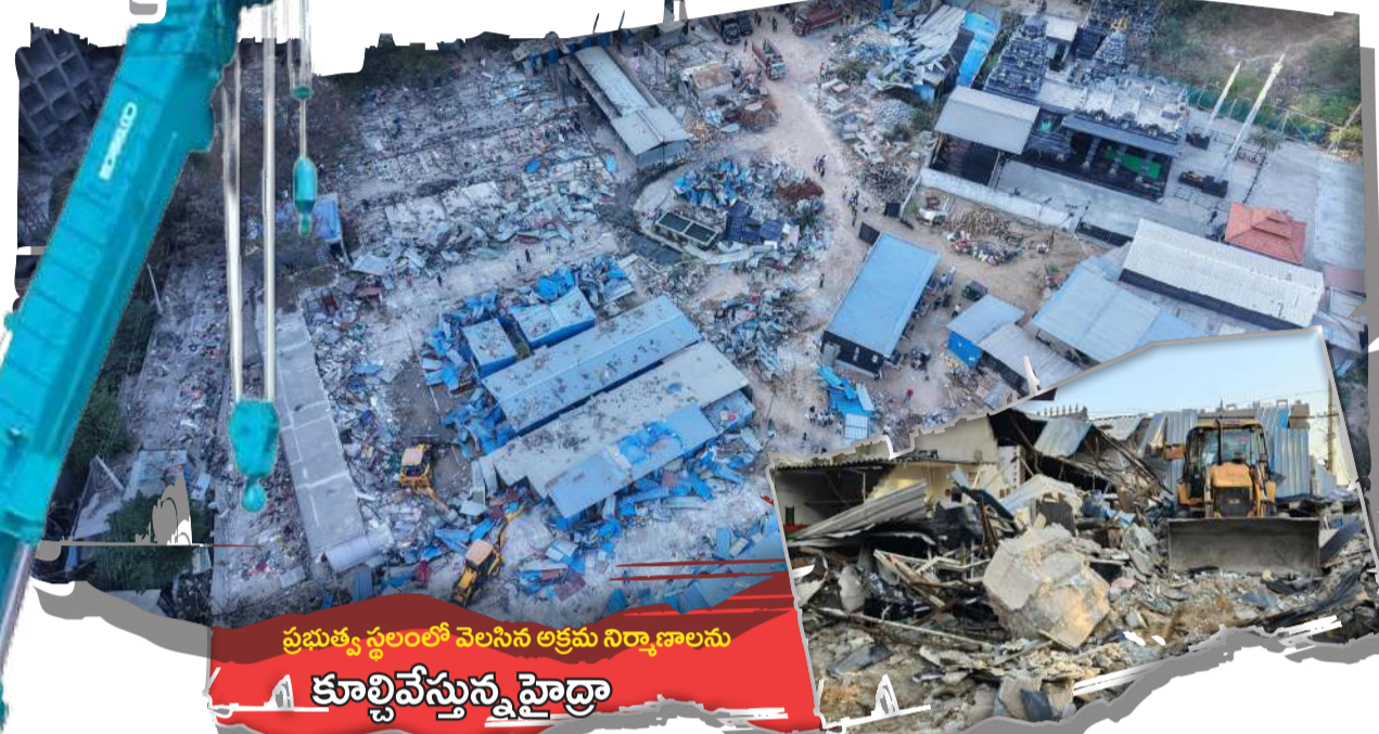
ప్రభుత్వ స్థలంలో వెలసిన అక్రమ నిర్మాణాలను కూల్చివేస్తున్న హైద్రా

ఈ-కబురు, శేరిలింగంపల్లి : "అతని రాజకీయ పార్టీ నాయకుడు... తనకు ఉన్న రాజకీయ "హస్తం" అందడందలతో ఏకంగా ప్రభుత్వ భూములు, చెరువు మీద కన్నేసాడు... వందల కోట్ల విలువైన భూములను హస్తగతం చేసుకొని షెడ్యూ, తాత్కాలిక నిర్మాణాలు చేపట్టాడు... వాటిని వ్యాపార సముదాయాలకు అద్దెకు ఇచ్చి నెలనెలా దాదాపు 40 లక్షల మేర జేబులో వేసుకుంటున్నాడు... చివరికి స్థానికుల ఫిర్యాదులతో హైద్రా రంగంలోకి దిగడంతో ఈ రాజకీయ నాయకుడి అక్రమ సామ్రాజ్యం నేలమట్టమైంది."