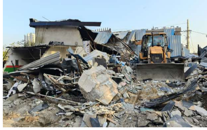
భానామెట్ లో నిర్మాణాలను కూల్చివేస్తున్న హైద్రా అధికారులు