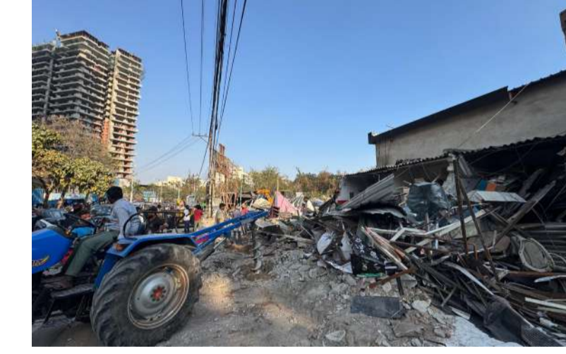
ప్రభుత్వ స్థలంలో వెలసిన అక్రమ నిర్మాణాలను కూల్చివేస్తున్న హైద్రా

దీంతో పాటు పక్కనే ఉన్న ప్రభుత్వ భూమిలో సైతం ఓ దేవాలయానికి ఆసునందానంగా భారీ షెడ్యూలు ఏర్పాటు చేసి నెలవారీ ఆదైలు వసూలు చేయసాగారు. సదరు భూమిపై కోర్టులో కేసు ఉన్నప్పటికీ యథేచ్ఛగా ఎకరాల కొద్ది విస్తీర్ణంలో కట్టాల సామాజియాన్ని నెలకొల్పారు. ఈ విషయమై స్థానికులు ఈ మధ్యే హైద్రా ప్రజాశాసనసభలో పిర్యాదు చేశారు. దీంతో హైద్రా కమిషనర్ ఏవీ రంగనాథ్ ఆదేశాల మేరకు హైద్రా అధికారులు, స్థానిక రెవెన్యూ అధికారులతో కలిసి జనవరి 31వ తేదీన సర్వే నిర్వహించి, విచారణ చేపట్టారు. ఈ విచారణలో కట్టాదారులు సైతం పాల్గొన్నారు. కట్టాదారుల సమక్షంలోనే రెవెన్యూ అధికారులు మొండికుంట చెరువుతో పాటు ప్రభుత్వ భూమి అక్రమణకు గురైందని