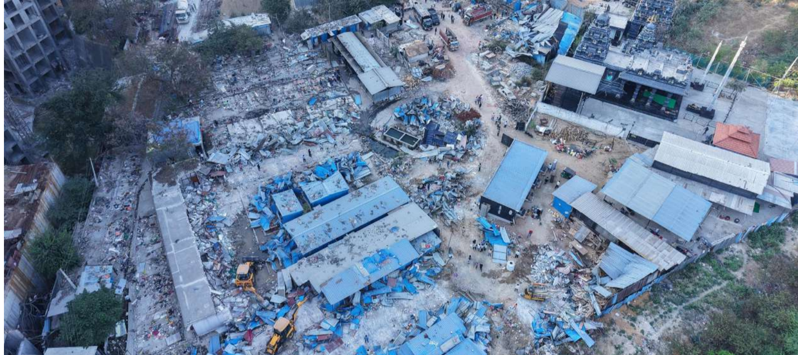
ప్రభుత్వ స్థలంలో వెలసిన అక్రమ నిర్మాణాలను కూల్చివేస్తున్న హైద్రా