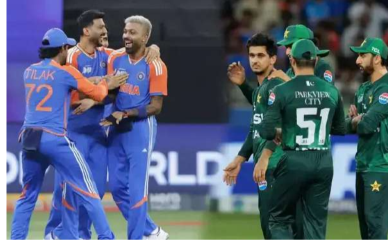
చివరిగా ఎప్పుడు 20వ ఓవర్ వేశారు. ఫహీమ్ 20వ ఓవర్ వేయగలడే.. లేదో.. అని సక్రయన్ విశ్లేషించారు. హైలైట్ మోడల్ లో జరుగుతున్న టీ20 ప్రపంచకప్ లో పాకిస్తాన్ తన మ్యాచ్ లోని శ్రీలంక వేదికగానే ఆడుతోంది. ఇప్పటివరకు రెండు మ్యాచ్ లు

టీ20 వరల్డ్ కప్ (ICC Mens T20 World Cup) 2026లో భాగంగా ఆదివారం కొలంబోలోని ప్రేమదాస్ స్టేడియం వేదికగా భారత్, పాక్ మ్యాచ్ జరిగింది. దీనిపై పాకిస్తాన్ మాజీ క్రికెటర్ సక్రయన్ నీ ముస్తాక్ వివాదాస్పద వ్యాఖ్యలు చేశాడు. ఐసీసీ (ICC) బీసీసీబి (BCCI) ప్రభావితం చేస్తుందన్న ప్రస్తుతమున్న సాంకేతిక పరిష్కారంతో కొలంబోలోని పిచ్ ను ఎప్పుడైనా మార్చొచ్చని నిరాధార ఆరోపణలు చేస్తూ.. తన అభిప్రాయం వెల్లడించాడు. 'ఐసీసీ ఎవరి ఒత్తి పీడితే తగ్గి పనిచేస్తుందే మనం దరికీ తెలుసు. ప్రస్తుత ఆధునిక కాలంలో ఎలాంటి సాంకేతిక పరిష్కారం ఉండదంటే.. దాని సాయంతో మనకు తెలియకుండానే గ్రౌండ్స్ మేన్స్ ఎప్పుడైనా పిచ్ ను మార్చొచ్చు' అని సక్రయన్ ముస్తాక్ అన్నాడు. అలాగే అతడు బౌలింగ్ అర్డర్ గురించి మాట్లాడాడు. 'భారత్ తో మ్యాచ్ ముందు ఉన్నా తొలికే ఆటపిస్తానని పాడు. కానీ పిచ్ ఇద్దరు పేసర్లు ఒక ఆల్ రౌండ్ ర్ అవసరమైతే మొత్తం సమీకరణం మారిపోతుంది. జిమ్మీ నీషమ్ ను చూడండి. అతడు ఫహీమ్ అప్రమ్ లాంటివాడు. పాకిస్తాన్ తరపున 20వ ఓవర్ ఎవరు వేస్తారు? తారిక్? నవాజ్? షాదాబ్? అజాద్? వారు