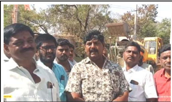
మాట్లాడుతున్న టిడిపి జిల్లా నాయకులు పెద్ద తిప్పయ్య