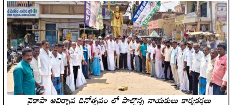
వైకాపా ఆవిర్భావ దినోత్సవం లో పాల్గొన్న నాయకులు కార్యకర్తలు