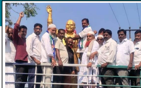
వైఎస్ఆర్ విగ్రహానికి నివాళులు అర్పిస్తున్న దుశ్యం.