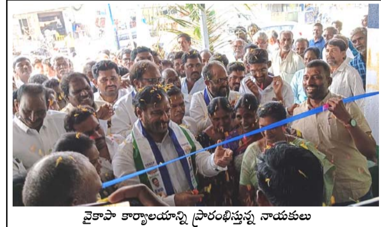
వైకాపా కార్యాలయాన్ని ప్రారంభిస్తున్న నాయకులు