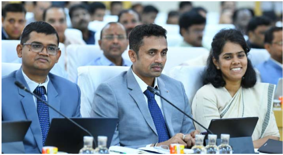
(మొదటి పేజీ (తరువాయి))