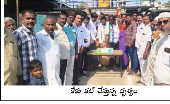
కేకు కట్ చేస్తున్న దుశ్యం