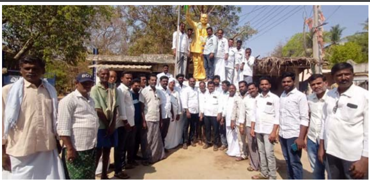
దివంగత ముఖ్యమంత్రి వైఎస్ రాజశేఖర్ రెడ్డి విగ్రహానికి పూలమాలలు వేసి ఆర్పిస్తున్న వైసీపీ నాయకులు