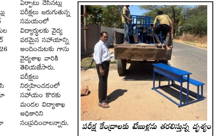
పరీక్ష కేంద్రాలకు టేబుళ్లు తరలిస్తున్న దృశ్యం