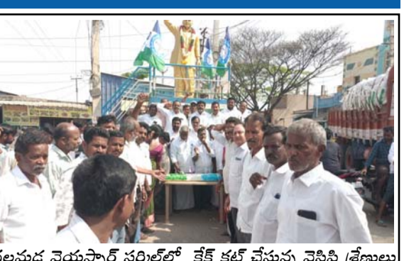
నల్లమాడ వైఎస్సార్ సర్కిల్లో కేక్ కట్ చేస్తున్న వైసీపీ శ్రేణులు