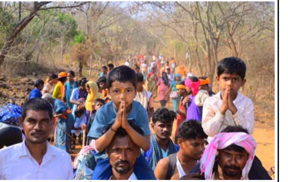
కాలినడకన శ్రీశైలం చేరుకుంటున్న కన్నడ భక్తులు

సంతృప్తికరమైన దర్శనాన్ని అందించేందుకు ఏర్పాట్లు చేస్తున్నారు అధిక సంఖ్యలో వచ్చిన భక్తుల రద్దీకి అనుగుణంగా సేమియానాలు టెంట్లు ఏర్పాట్ల ప్రదేశాలలో ప్రత్యేక ఏర్పాట్లు దేవస్థానం వారు ఇప్పటికే చేసి ఉన్నారని భక్తుల తాకిడి రోజురోజుకూ పెరుగుతోంది.