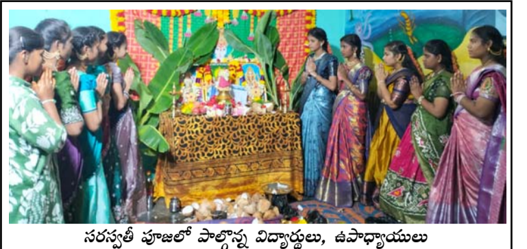
సరస్వతి పూజలో పాల్గొన్న విద్యార్థులు, ఉపాధ్యాయులు