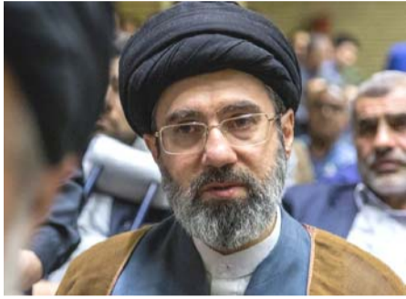
బిక్రన్ (తెలుగోడు), మార్చి 12 :

రెండు ట్యాంకర్లపై 'సూసైడ్ బోటు' తో దాడి..