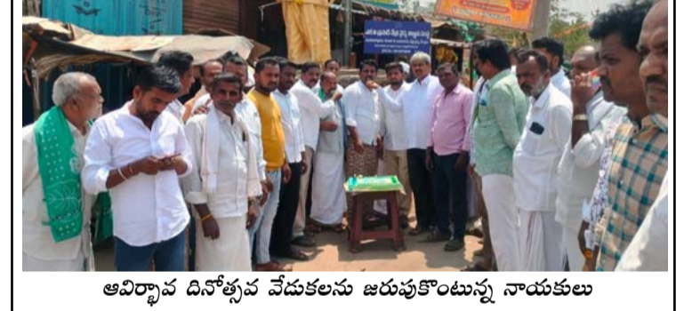
ఆవిర్భావ దినోత్సవ వేడుకలను జరుపుకొంటున్న నాయకులు