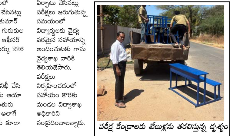
పరీక్ష కేంద్రాలకు టేబుళ్లు తరలిస్తున్న దృశ్యం