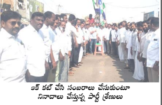
కేక్ కట్ చేసి సంబరాలు చేస్తుంటూ నివాదాలు చేస్తున్న పార్టీ శ్రేణులు