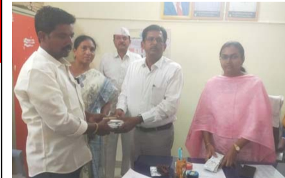
మెడికల్ కిట్లు ఓఆర్ఎస్ ప్యాకెట్లు అందజేస్తున్న దుశ్యం