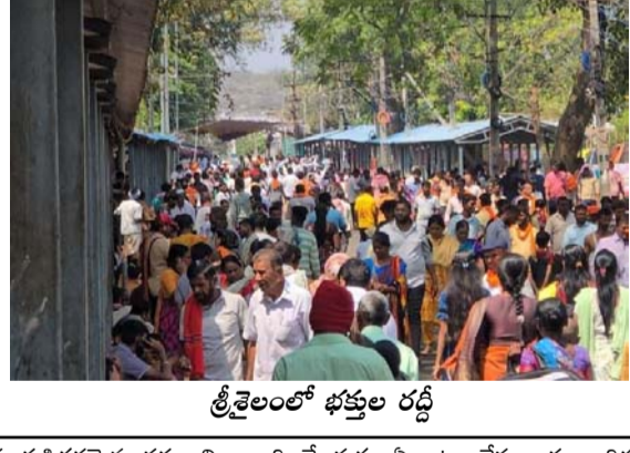
శ్రీశైలంలో భక్తుల రద్దీ

శ్రీశైలం (తెలుగోడు), మార్చి 12 : ప్రముఖ శైవ శ్రేణులగా శక్తిపీఠంగా విరాజిల్లుతున్న శ్రీశైలం మహా శ్రేణులలోని శ్రీ భ్రమరాంబ మల్లికార్జున స్వామివార్లను ఉగిది పర్వతినాన దర్శించుకునేందుకు కర్ణాటక రాష్ట్రం నుంచి అధిక సంఖ్యలో భక్తులు కాలినడకన వాహనాల్లో అధిక సంఖ్యలో శ్రీశైలం చేరుకుంటున్నారు. ప్రతి ఏటా మాదిరిగానే ఉగిది కర్ణాటక రాష్ట్రం నుంచి అధిక సంఖ్యలో భక్తులు కాలినడకన వాహనాల్లో శ్రీశైలం చేరుకొని శ్రీ భ్రమరాంబ మల్లికార్జున స్వామి వారిని సేవింపకోవడం ఆనవాయితీగా వస్తుంది అందులో భాగా ఉన్నాయి అధిక సంఖ్యలో భక్తులు శ్రీశైలం చేరుకుంటున్నారు 60 వేలకు మంది హైగా భక్తులు స్వామి అమ్మవార్లను దర్శించుకున్నారు అంచనా భక్తుల రద్దీ ఎక్కువగా ఉండటంతో ఆలయ అధికారులు ఆలయ వేళలో మార్పులు చేసి భక్తులందరికీ కూడా