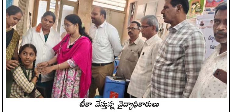
టీకా వేస్తున్న వైద్యాధికారులు