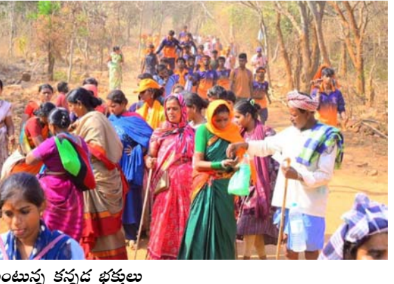
కాలినడకన శ్రీశైలం చేరుకుంటున్న కన్నడ భక్తులు