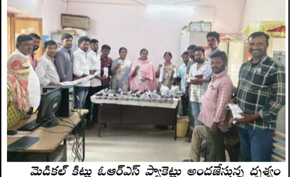
మెడికల్ కిట్లు ఓఆర్ఎస్ ప్యాకెట్లు అందజేస్తున్న దుశ్యం