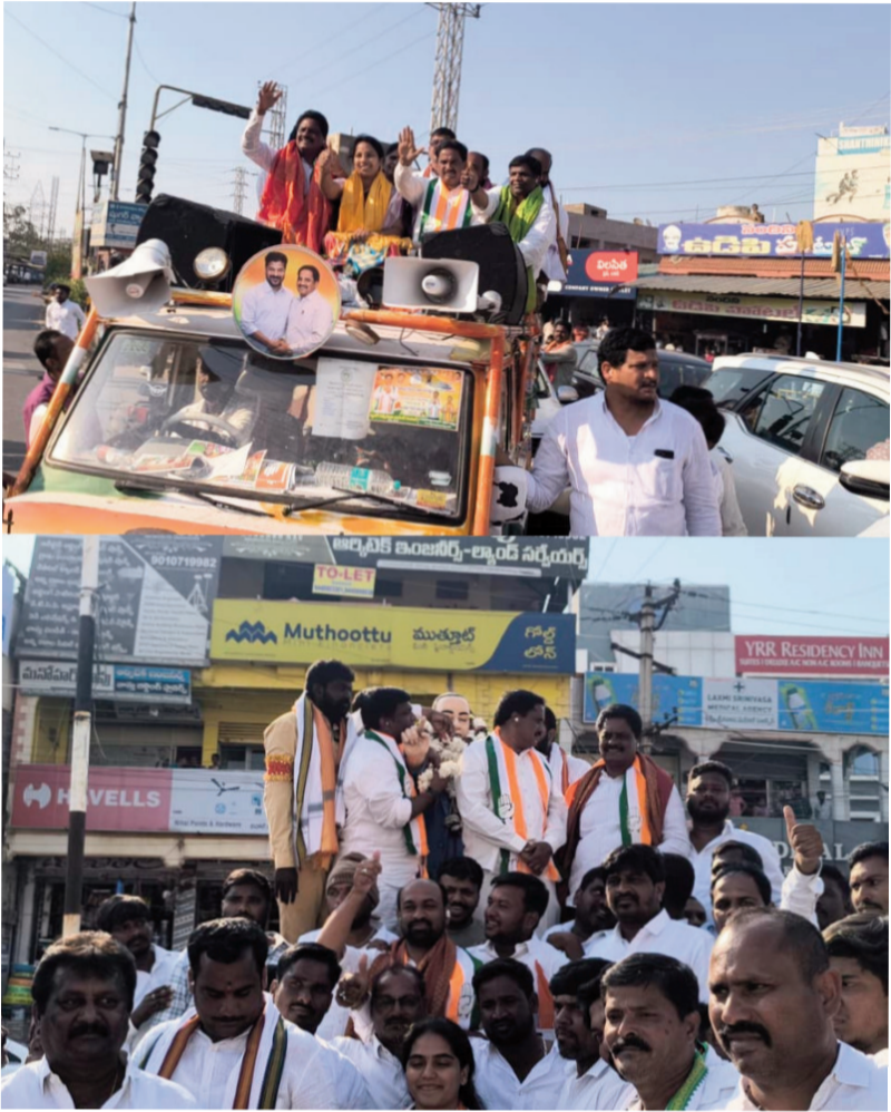
13 కాంగ్రెస్, 5 బిజెపి 3 బీఆర్ఎస్, 1 స్వతంత్ర అభ్యర్థి.