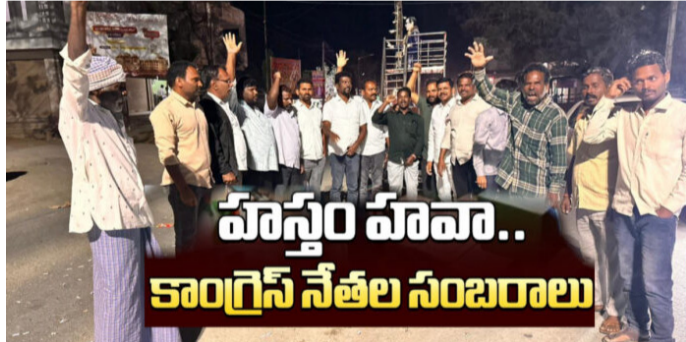
హస్తం హమా.. కాంగ్రెస్ నేతల సంబరాలు