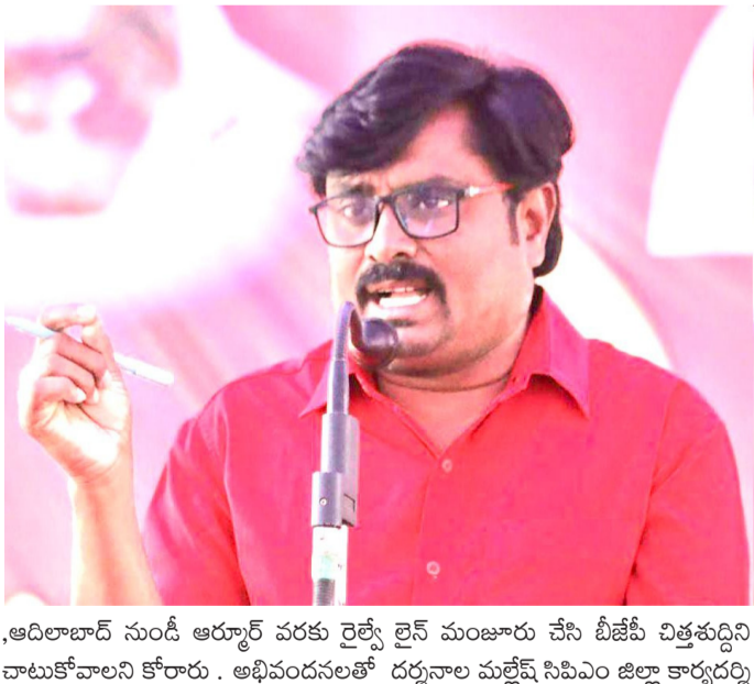
ఆదిలాబాద్ నుండి ఆర్యూర్ వరకు రైల్వే లైన్ మంజూరు చేసి బీజేపీ విజయం చాటుకోవాలని కోరారు. అభివృద్ధిలో దర్బారులు మల్లెట్ల సిపిఎం జిల్లా కార్యదర్శి

అమృత తెలంగాణ ఆదిలాబాద్ నూస్ : సిపిఎం పోటీ చేసిన రెండు వార్డులలో సిపిఎం కు ఓటు వేసిన ప్రజలకు సిపిఎం జిల్లా కమిటీ ధన్యవాదాలు తెలియజేస్తుంది. డబ్బు, కులం, మతం కు లొంగి కుండా నిఖార్సై ఓట్లు సిపిఎం కు వచ్చాయి. సిపిఎం పార్టీ ఈ ఎన్నికల్లో సైదాంతిక రాజకీయ పోరాటం చేసింది. కాంగ్రెస్ అసెంబ్లీ, లోకీ పార్టీల ను కలుపు కొని పని చేయకపోవడం వల్లనే బీజేపీ చైర్మన్ స్థానాన్ని కైవసం చేసుకునే పరిస్థితి వచ్చిందని సిపిఎం జిల్లా కమిటీ అభిప్రాయపడుతోంది. బీజేపీ విజయం లోకీ వాదానికి, భారత రాజ్యాంగానికి గొడ్డలి పెట్టు లాంటిది. పట్టణ ప్రజల ఆకాంక్షలయిన సిపిఎం పరిశ్రమను తెలిపింది. విమానాశ్రయం నిర్మించి