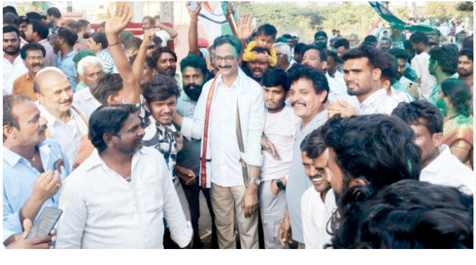
బీఆర్ఎస్ నుంచి గెలిచిన 8 మందిలో కనీసం ఇద్దరినీ తమ వైపు మలుపుకోవాలి. కొత్తగూడెం నగరపాలక సంస్థ మినహా ఉమ్మడి ఖమ్మం జిల్లాలో ఎన్నికలు జరిగిన ఏడు మున్సిపాలిటీలను కాంగ్రెస్ స్వచ్ఛమైన మెజారిటీతో 'చే' జిక్కించుకుంది.