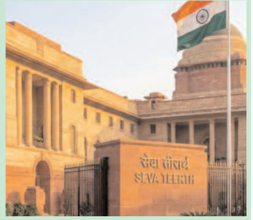
ప్రధాన మంత్రి సరేంద్ర మోడి శుక్రవారం (ఫిబ్రవరి 13, 2026) నాడు కొత్త ప్రధాన మంత్రి కార్యాలయం 'సేవా తీర్థ' తో పాటు కేంద్ర సచివాలయ భవనాలు కర్వపు భవన్-1 మరియు 2లను ప్రారంభించనున్నారు.