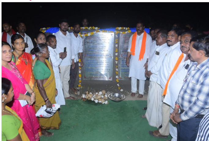
లోకల్ వెల్వెల్లో అభివృద్ధి కార్యక్రమాలకు శంకుస్థాపన చేసిన ఎమ్మెల్యే మహేశ్వర్ రెడ్డి