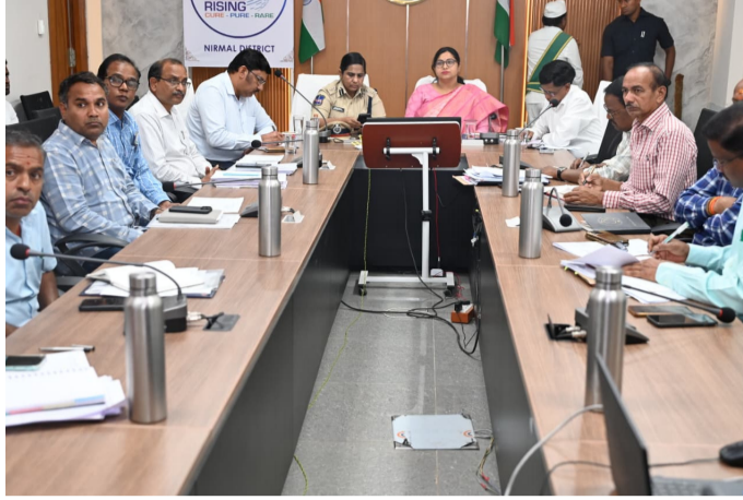
వీడియో కాన్ఫరెన్స్ లో హాజరైన సంబంధిత జిల్లా అధికారులు

జిల్లాలో గ్యాస్ సిలిండర్ల కొరత లేదు జిల్లా కలెక్టర్ అభిలాష అభినవ్