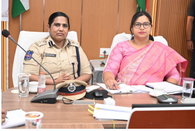
వీడియో కాన్ఫరెన్స్ లో కలెక్టర్ ఎస్సీ