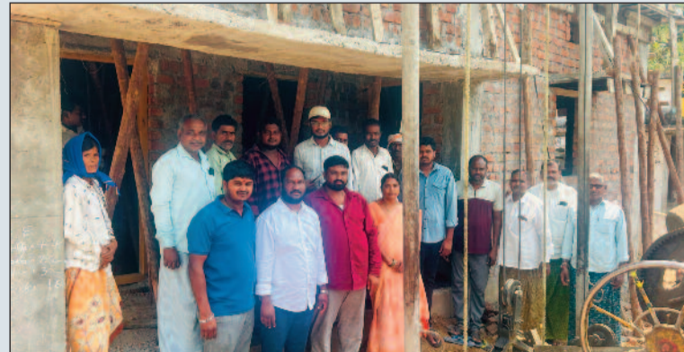
గొల్లపల్లి, మార్చి 14 (మనసులో మాట):

మంత్రి అడ్డూరి లక్ష్మణ్ కుమార్ ఆదేశాలతో స్టాబ్ పనులు పూర్తి పిల్లల భవిష్యత్తుకు బాటలు వేస్తున్న సంక్షేమ శాఖ