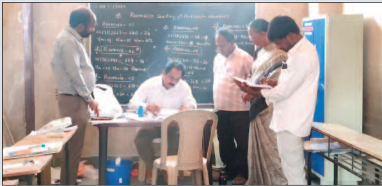
మెదక్, మార్చి 14 (మనసులో మాట):