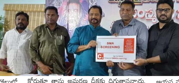
కొరుతూ తాను అమరణ దీక్షకు దిగుతానన్నారా.

రాజమహేంద్రవరం (మనసులో మాట), మార్చి 14: రాష్ట్రంలోని కూటమి ప్రభుత్వం కక్ష సాధింపు కేసులకు ఇస్తున్న ప్రాధాన్యత గత ప్రభుత్వంలో దళితులపై జరిగిన కేసులపై ఎందుకు ఇవ్వడం లేదని లోక్ సభ మాజీ సభ్యుడు జీవీ హర్షకుమార్ ప్రశ్నించారు.