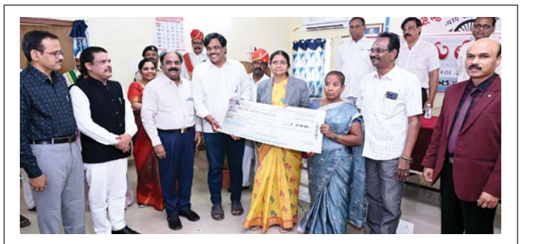
రాజీ కాదగిన కేసులు రాజీ చేసుకుంటే సమయం, డబ్బు ఆదా అవుతుంది