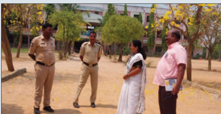
మెదక్, మార్చి 14 (మనసులో మాట):

పరీక్షా కేంద్రాలను పర్యవేక్షించిన జిల్లా విద్యాశాఖ అధికారి విజయ