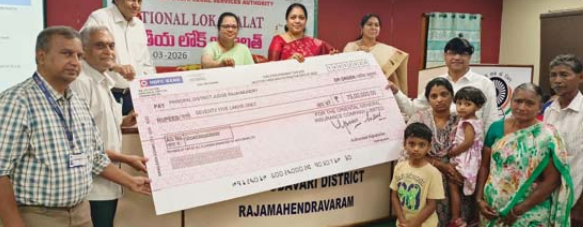
ఆదా అవుతుంది తెలిపారు. ఉమ్మడి తూర్పు గోదావరి జిల్లా వ్యాప్తంగా కోర్టుల్లో పెండింగ్ లో ఉన్న కేసులలో మధ్యవర్తిత్వం ద్వారా రాజీ సాధ్యమయ్యే కేసులను గుర్తించి ఈ లోక్ అదాలత్ లో ఇరువజ్జాలను చర్చించి సమ్మతి లభించిన కేసులను పరిష్కరించడం జరుగుతుందని తెలిపారు.