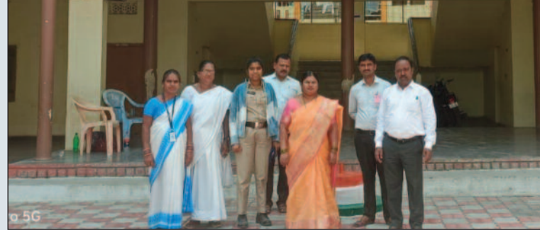
మెదక్, మార్చి 14 (మనసులో మాట):

విద్యార్థులకు ఇబ్బందులు కలగకుండా మౌలిక వసతుల పరిశీలన