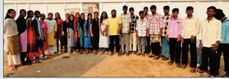
గొల్లపల్లి, మార్చి 14 (మనసులో మాట):

పరీక్షలకు వెళ్లే చిన్నారులకు ఆర్థిక తోడ్పాటు వంద శాతం ఉత్తీర్ణత సాధించాలని శుభాకాంక్షలు