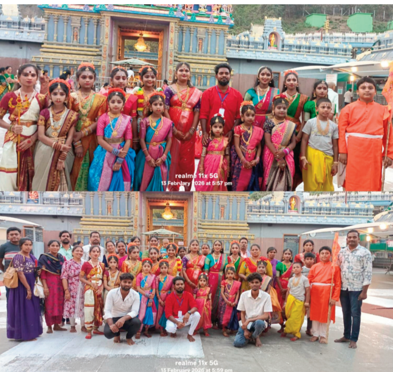
త్రైకొంటర్ స్టూన్ కోదాడ, ఫిబ్రవరి 15 ( జిల్లా బ్యూరో )