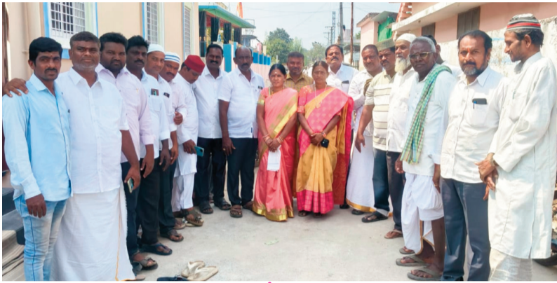
క్రైమ్ కౌంటర్ సూన్స్ చిలుకూరు ఫిబ్రవరి 15 కోదాడ నియోజకవర్గ ప్రతినిధి

మహాశివరాత్రి సందర్భంగా పాత చిలుకూరు శివాలయంలో అభిషేకాలు పూజలు, అన్నదాన కార్యక్రమం