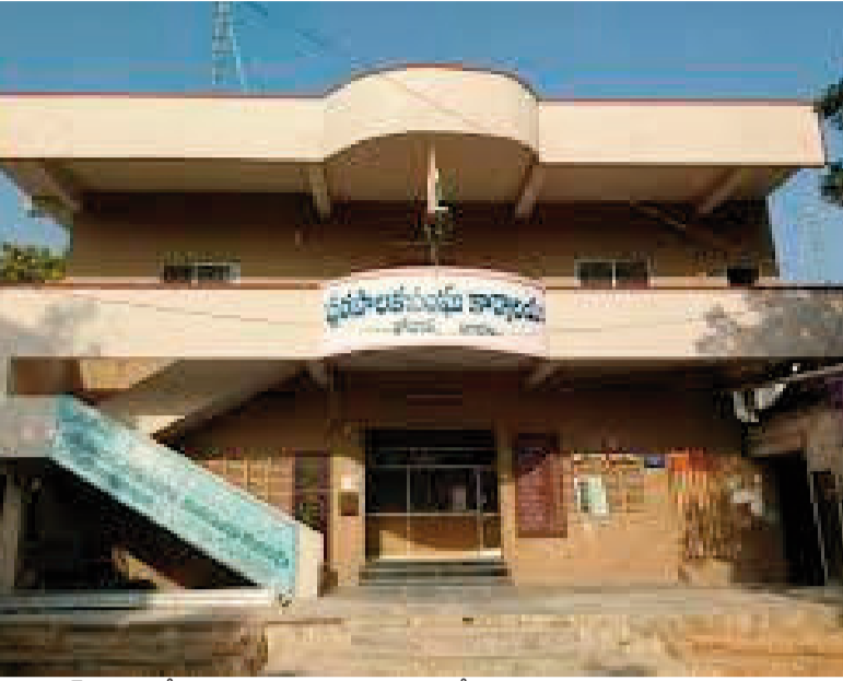
త్రైకొంటర్ స్టూన్ కోదాడ, ఫిబ్రవరి 15 ( జిల్లా బ్యూరో )