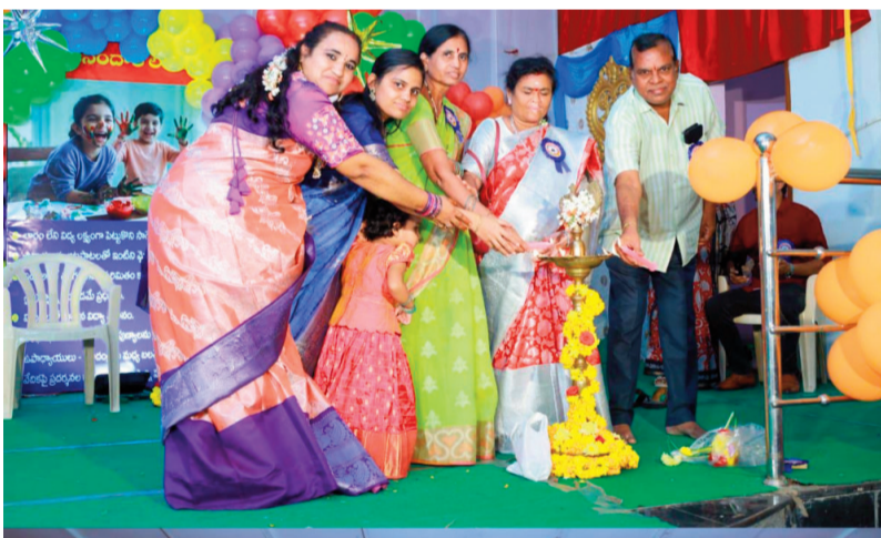
- విద్యార్థుల మానసిక ఉల్లాసానికి చదువుతో పాటు క్రీడలు భాగస్వామ్యం చేయాలి.

రెండవ వార్షికోత్సవం ఘనంగా నిర్వహించిన ఆదిత్య స్కూల్.