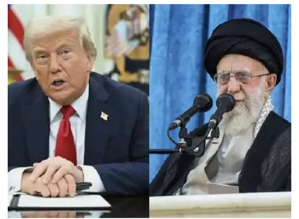
అందుకు ఓకే అయితే.. న్యూక్లియర్ డీల్ కు రెడీ: ఇరాన్ » 2లో