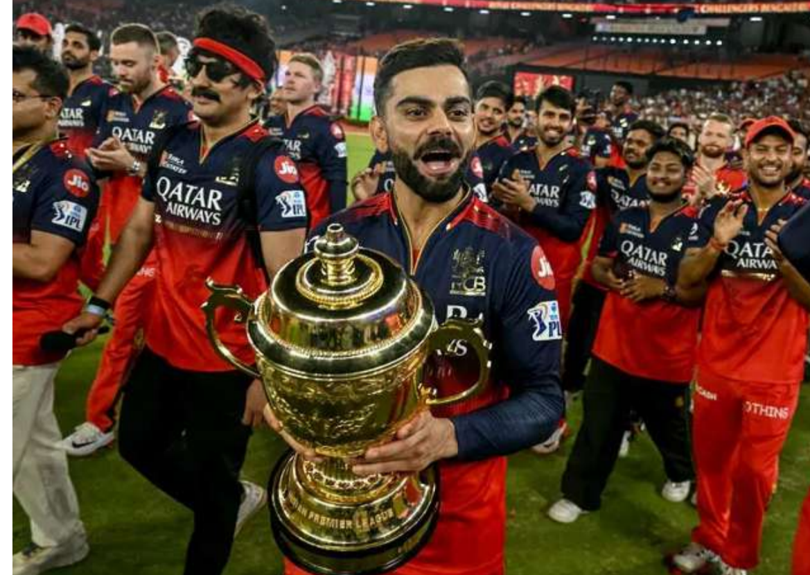
132 స్కైరేట్ లో 8,661 పరుగులు సాధించాడు. 2025 సీజన్ లో కోహ్లా 15 మ్యాచ్ లో 657 పరుగులు జట్టు అరు పరుగుల తేడాతో పంజాబ్ కింగ్స్ పై సాధించాడు. గతేడాది ఐపీఎల్ ఫైనల్ లో బెంగళూరు విజయం సాధించి తొలిసారి బైటిల్ కు ముద్రాడింది.

టీమిండియా స్టార్ బ్యాటర్ విరాట్ కోహ్లా తన ఫ్యామిలీతో కలిసి ప్రస్తుతం లండన్ లోనే సుకాం పెట్టాడు. మార్చి 28 నుంచి ఐపీఎల్ 2026 సీజన్ ప్రారంభం కానుండడంతో కోహ్లా తన ప్రాక్టీస్ ను ఇప్పటికే మొదలెట్టిన సంగతి తెలిసింది. ప్రాక్టీస్ కు సంబంధించిన వీడియోను కూడా ఇటీవలే తన సామాజిక మాధ్యమం 'ఎక్స్' వేదికగా పంచుకున్నాడు. తాజాగా కోహ్లా తన టెస్ట్ టీ20 ఓపెనర్ గా విండీస్ దిగ్గజ క్రికెటర్ క్రిస్ గేల్ ను ఎంచుకున్నాడు. విషయంలోకి వెళితే టెస్ట్ టీ20 ఓపెనర్ గా టీమిండియా నుంచి కానీ, అంతర్జాతీయ క్రికెట్ కు నుంచి ప్రస్తుత, మాజీల్లో ఎవరిని ఎన్నుకుంటారని విరాట్ కోహ్లాని రాయల్ చాలెంజర్స్ బెంగళూరు ప్రశ్న వేసింది. అయితే మొదట సునీల్, సెహ్వాగ్ లలో ఎవరిని ఎన్నుకుంటారని అడగా.. "టీ20 ఓపెనర్ కాబట్టి నా మొదటి ప్రాధాన్యత సెహ్వాగ్" అని కోహ్లా జవాబిచ్చాడు. ఆ తర్వాత ఫైనల్ చాయిస్ లో రోహిత్ శర్మ, క్రిస్ గేల్ పేర్లు వచ్చాయి. కానీ ఇక్కడ కోహ్లా రోహిత్ ను కాదని అర్జీనీ మాజీ సహచర అటగాడు గేల్ కే ఓపెనర్ గా, రోహిత్, సెహ్వాగ్ కూడా నా దృష్టిలో గొప్ప టీ20 ఓపెనర్లే అని పేర్కొన్నాడు. కానీ అర్జీనీ తరఫున ఆడటంపై ఓపెనర్ గా గేల్ విధ్వంసాన్ని కళ్లారా చూశానని తెలిపాడు. ఆరంభం నుంచే బంతిని బొందరి లేదా స్వీట్ గా మలలన్న కోరిక గేల్ లో బలంగా కనిపించేదన్నాడు. అందుకే గేల్ టీ20లో అత్యుత్తమ ఓపెనర్ అని చెప్పగలనని స్పష్టం చేశాడు. ఇక గతేడాది ఐపీఎల్ లో రాయల్ చాలెంజర్స్ బెంగళూరు విజేతగా నిలిచిన సంగతి తెలిసింది. ఇప్పటివరకు కోహ్లా ఐపీఎల్ లో 267 మ్యాచ్ లో