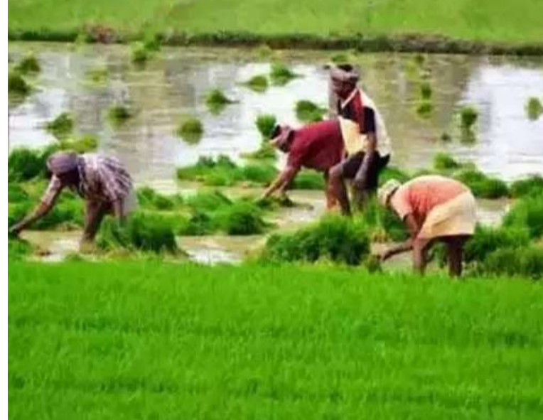
హైదరాబాద్, మార్చి 15 (మనసులో మాట): తెలంగాణ రాష్ట్రంలోని అన్నదాతలకు ప్రభుత్వం తీవ్ర కమిరు అందించింది. యాసంగి సీజన్ కు సంబంధించి రైతు భరోసా నిధులను ఈ నెల 22వ తేదీ నుంచి రైతుల ఖాతాల్లో జమ చేయాలని రాష్ట్ర ప్రభుత్వం నిర్ణయించింది. ముఖ్యమంత్రి ఎ. రేవంత్ రెడ్డి, ఉప ముఖ్యమంత్రి మల్లు భట్టి విక్రమార్కు మరియు వ్యవసాయ శాఖ మంత్రి తుమ్మల నాగేశ్వరరావు ఆదివారం నిర్వహించిన సమీక్షా సమావేశంలో ఈ మేరకు కీలక నిర్ణయం తీసుకున్నారు. ఈ నెల 22న సిబ్బిపీట జిల్లా నర్సేట్ల వేదికగా ముఖ్యమంత్రి రేవంత్ రెడ్డి చేతుల మీదుగా ఈ నిధుల విడుదల కార్యక్రమం ప్రారంభం కానుంది. మొదటి విడతలో భాగంగా ఎకరం వరకు భూమి ఉన్న సుమారు 70

లక్షల మంది రైతుల ఖాతాల్లోకి రూ. 3,590 కోట్ల నిధులను నేరుగా జమ చేయనున్నారు. ప్రభుత్వం తీసుకున్న ఈ నిర్ణయంతో చిన్న, సన్నకారు రైతులకు పెద్ద ఎత్తున ప్రయోజనం చేకూరుతుంది. అనంతరం మరో 20 రోజుల గడువులో రెండో విడతగా రూ. 2,650 కోట్లను పంపిణీ చేయాలని అధికారులు ప్రణాళికలు సిద్ధం చేశారు. ఏప్రిల్ నెలాఖరు నాటికి మిగిలిన రైతులందరికీ నిధులు అందేలా చర్యలు తీసుకోవాలని ముఖ్యమంత్రి అధికారులను ఆదేశించారు. మొత్తంగా రాష్ట్రవ్యాప్తంగా ఉన్న 1.50 కోట్ల ఎకరాలకు సంబంధించి రూ. 9,000 కోట్ల రైతు భరోసా నిధులు అన్నదాతల ఖాతాల్లో జమ కానున్నాయి. ఈ సమావేశంలో రాష్ట్ర ప్రభుత్వ ప్రధాన కార్యదర్శి కె. రామకృష్ణారావు, సీఎం ముఖ్య కార్యదర్శి శేషాద్రి, ఆర్థిక శాఖ ముఖ్య కార్యదర్శి సందీప్ కుమార్ సుల్తానియా మరియు వ్యవసాయ శాఖ కార్యదర్శి సురేంద్ర మోహన్ తదితరులు పాల్గొన్నారు.