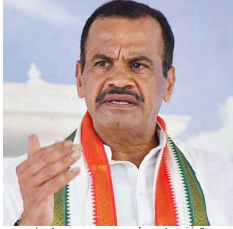
సంగారెడ్డి, మార్చి 15 (మనసులో మాట): తెలంగాణ అసెంబ్లీ సమావేశాలు నేటి (సోమవారం) నుంచి ప్రారంభం కానున్నాయి. ఈ క్రమంలోనే మాజీ సీఎం కేసీఆర్ అసెంబ్లీ సమావేశాలకు హాజరై, ప్రభుత్వానికి నిర్మాణాత్మకమైన సలహాలు, సూచనలు అందించాలని రోడ్డు, భవనాలు, సినిమాటోగ్రఫీ మంత్రి కోమటిరెడ్డి వెంకట్ రెడ్డి విజ్ఞప్తి చేశారు. ఆదివారం సంగారెడ్డిలో నిర్వహించిన మీడియా సమావేశంలో ఆయన మాట్లాడుతూ పలు ఆసక్తికర వ్యాఖ్యలు చేశారు. గత అసెంబ్లీ సమావేశాల్లో కేసీఆర్ కేవలం ఇలా వచ్చి అలా వెళ్లిపోయారని, ఈసారి పూర్తిస్థాయిలో సభలో ఉండాలని ఆయన కోరారు. మంత్రి కోమటిరెడ్డి మాట్లాడుతూ.. 'తెలంగాణ ప్రజల తరఫున నేను కేసీఆర్ కు ఒకటి విజ్ఞప్తి చేస్తున్నా. మీరు సభకు వచ్చి మా ప్రభుత్వానికి సలహాలు ఇవ్వండి. మీరు ఇచ్చే మంచి సూచనలు స్వీకరించేందుకు మేం సిద్ధంగా ఉన్నాం. పక్క రాష్ట్రమైన ఆంధ్రప్రదేశ్ లో వైసీపీ 11 సీట్లు వచ్చినా అక్కడ ప్రతిపక్ష హోదా దక్కలేదు, కానీ

తెలంగాణలో మేము గౌరవప్రదంగా ప్రతిపక్ష హోదా ఇచ్చాం. ప్రభుత్వం చేసే మంచి పనులను కేసీఆర్ అభివందిస్తే, ఆయనకే గౌరవం. తెలంగాణ ఉద్యమ సమయంలో తాము అధికార పార్టీలో ఉండి కూడా రాష్ట్రం కోసం సన్నద్ధం అయ్యాను. మూసీ పునరుజ్జీవంపై కేటీఆర్ ఇచ్చిన పవర్ పాయింట్ ప్రజెంటేషన్ చూస్తుంటే నవ్వు వస్తోంది. మూసీ కాలుష్యం వల్ల నల్లండ్ల ప్రజలు పడుతున్న ఇబ్బందులు మాకు తెలుసు. షోరెడ్ల సమస్యలతో దశాబ్దాలుగా పోరాటం చేస్తున్నా' అని అన్నారు.