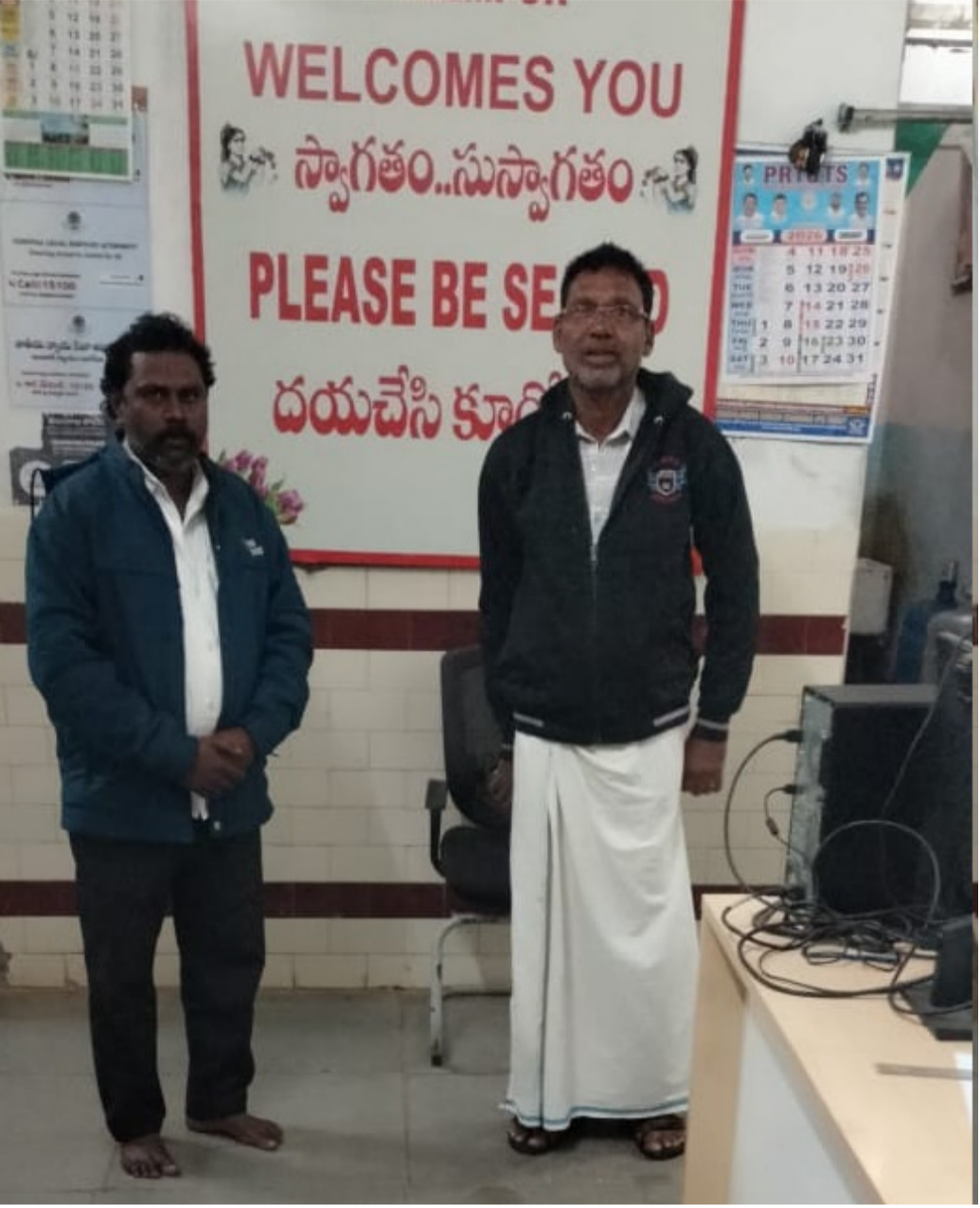
పిప్పల్ కోటి గ్రామస్థలను అరెస్టు దృశ్యం