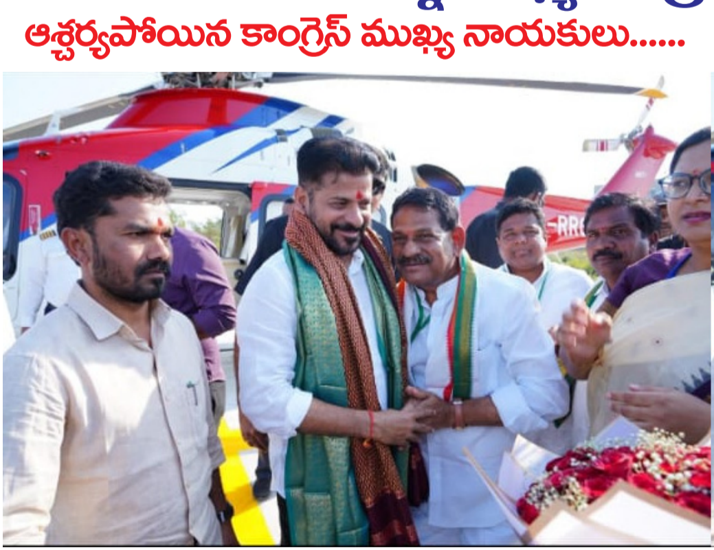
మాజీ ఎమ్మెల్యే విట్టల్ రెడ్డి ని ఆప్యాయంగా దగ్గరికి తీసుకున్న ముఖ్యమంత్రి రేవంత్ రెడ్డి

నిర్మల్ జిల్లా జనపరి 16 అమృత్ తెలంగాణ నిర్మల్ జిల్లా పర్యటనకు విచ్చేసిన ముఖ్యమంత్రి రేవంత్ రెడ్డికి స్వాగతం పలికిన, ముద్దోల్ నియోజకవర్గ మాజీ ఎమ్మెల్యే జి.వి.రెడ్డి, సీఎంపీ అయినా ఆలింగణం చేసుకున్న ముఖ్యమంత్రి రేవంత్ రెడ్డి.