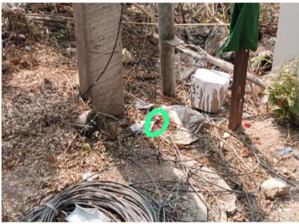
డెడ్ డ్రాప్ విధానంతో డ్రగ్స్ సరఫరా

లోని తన స్నేహితుల ఆకౌంట్లకు డేట్ డ్రాప్ చేయించుకుంటారు. అనంతరం వారు తిరిగి క్రిష్ణంరాజుకు డ్రాప్స్ ఫర్ చేస్తుంటారు. డబ్బు ముట్టిన వెంటనే డెడ్ డ్రాప్ విధానంలో డ్రగ్స్ సరఫరా చేస్తుంటారు. ఒక నిర్వాణుడు ప్రదేశంలో డ్రగ్స్ ప్యాకెట్ పెట్టి, సదరు ప్రదేశం లోకేషన్, ఆనాళ్లను కప్పమర్ కు చేరవేస్తారు. వారి అక్కడికి వెళ్లి డ్రగ్స్ తీసుకోవడం సూచిస్తారు. ఆన్ లైన్ ఆర్డర్, డెడ్ డ్రాప్ సప్లయ్ తో మనిషికి, మనిషికి ఎటువంటి సంబంధం లేకుండా డ్రగ్స్ సరఫరా జరిగిపోతుంది. కాగా నిందితులు ఉపయోగించిన డెడ్ డ్రాప్ విధానంతోనే పోలీసులు ఈ మూఠాను పలకని పట్టుకోవడం విశేషం.