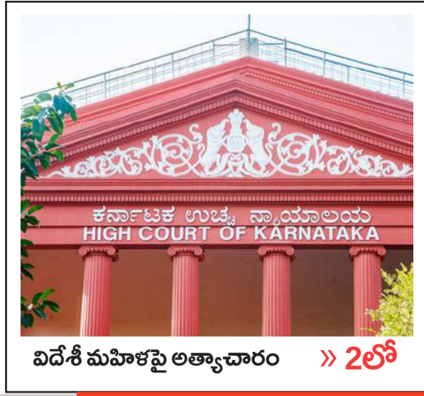
విదేశీ మహిళపై అత్యాచారం >> 2లో