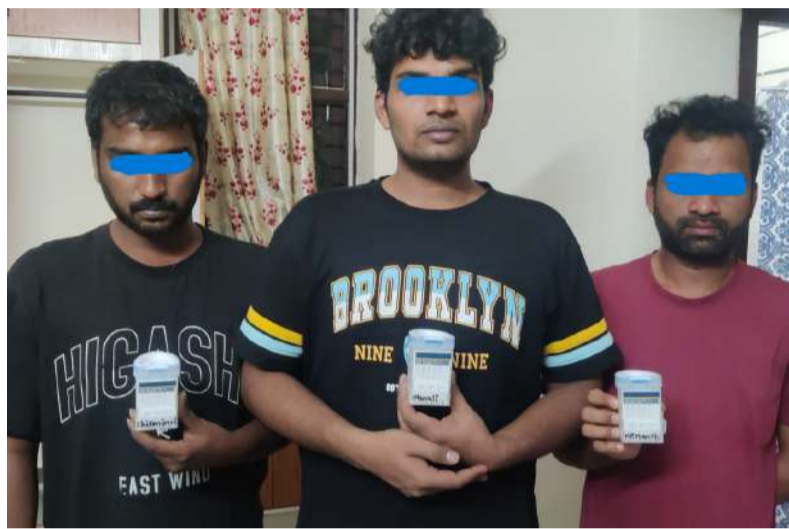
పోలీసులకు పట్టుబడిన ముగ్గురు నిందితులు