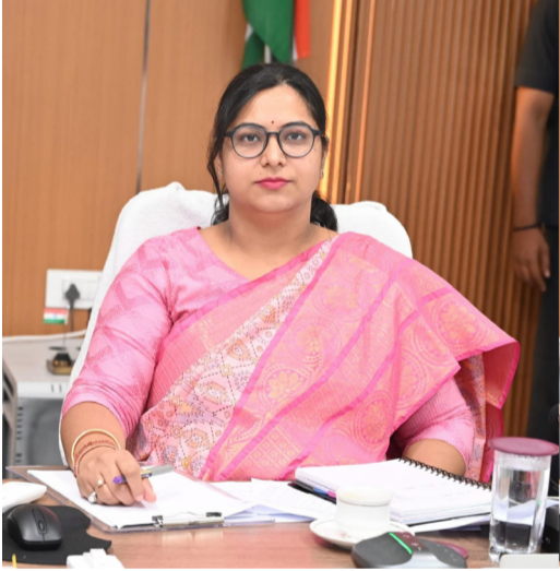
నిర్మల్ జిల్లా కలెక్టర్ అభిలాష అభినవ్ పేర్కొన్నారు. ఎక్కడైనా అక్రమాలు జరిగితే ప్రజలు వెంటనే సంబంధిత అధికారులకు సమాచారం అందించాలని కలెక్టర్ కోరారు.

అమృత తెలంగాణ నిర్మల్ న్యూస్ జిల్లాలో ప్రభుత్వ భూములను ఆక్రమించే వారిపై కఠిన చర్యలు తప్పవని జిల్లా కలెక్టర్ అభిలాష అభినవ్ హెచ్చరించారు. ప్రభుత్వ ఆస్తుల పరిరక్షణ విషయంలో ఎలాంటి రాజీ ఉండదని స్పష్టం చేశారు. మంగళవారం విడుదల చేసిన ప్రకటనలో ఆమె ఈ విషయం తెలిపారు. పారిశ్రామిక అవసరాల కోసం కేటాయించిన ప్రభుత్వ భూములపై కొందరు వ్యక్తులు ఆక్రమణకు కన్నేసి నిబంధనలకు విరుద్ధంగా పట్టాలు పొందినట్లు అధికారుల దృష్టికి వచ్చినట్లు కలెక్టర్ తెలిపారు. దీనిపై రెవెన్యూ యంత్రాంగం క్షేత్రస్థాయిలో విచారణ చేపట్టగా అక్రమాలు జరిగినట్లు నిరూపణ అయినట్లు పేర్కొన్నారు. నిబంధనలకు విరుద్ధంగా పొందిన పట్టాలను తక్షణమే రద్దు చేసినట్లు వెల్లడించారు. అలాగే ఆక్రమణకు గురైన భూమిని రెవెన్యూ అధికారులు తిరిగి స్వాధీనం చేసుకుని పారిశ్రామిక శాఖకు అప్పగించినట్లు తెలిపారు. ప్రభుత్వ భూమి ప్రజల ఆస్తి అని, దానిని ఆక్రమణ ఆక్రమించేందుకు ప్రయత్నిస్తే చట్టపరమైన చర్యలు తప్పవని కలెక్టర్ హెచ్చరించారు. ఆక్రమణదారులపై కచ్చితంగా క్రిమినల్ కేసులు నమోదు చేస్తామని తెలిపారు. జిల్లాలోని ఇతర ప్రాంతాల్లో కూడా ప్రభుత్వ భూములపై ఆక్రమణలు జరగకుండా నిరంతర నిఘా కొనసాగుతుందని