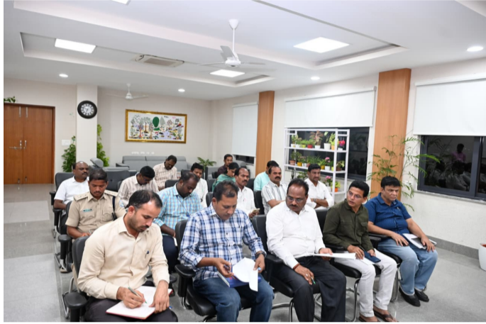
గౌడ్, గిరిజనాభివృద్ధి శాఖ అధికారులు, ఇతర శాఖల అధికారులు, సిబ్బంది పాల్గొన్నారు.