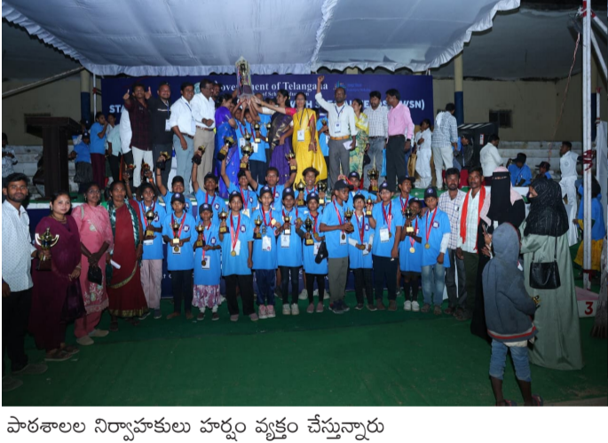
పాఠశాలల నిర్వాహకులు హార్షం వృక్షం చేస్తున్నారు