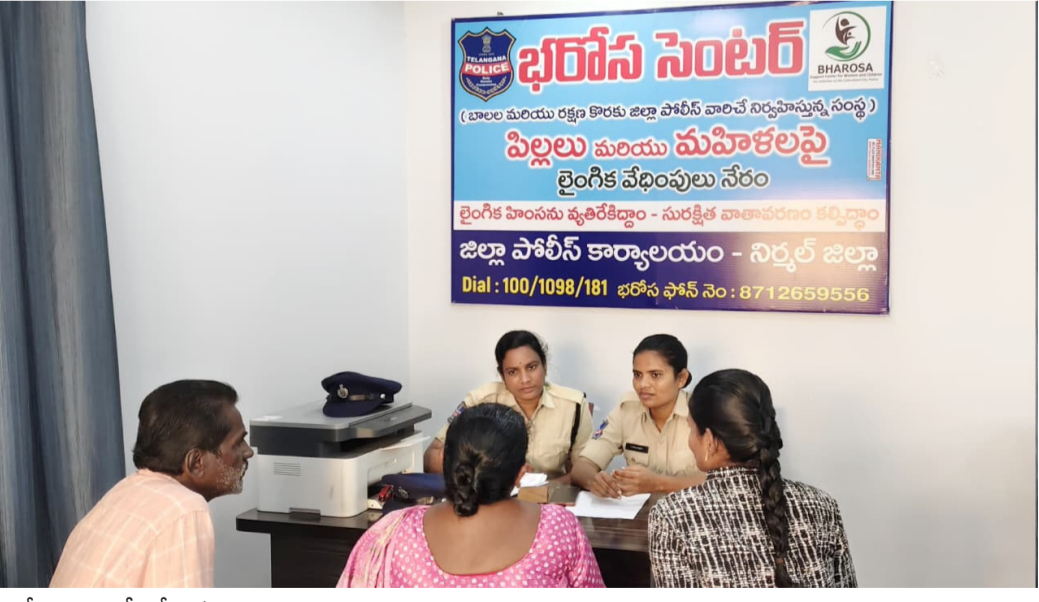
ఆదేశాలు జారీ చేశారు.