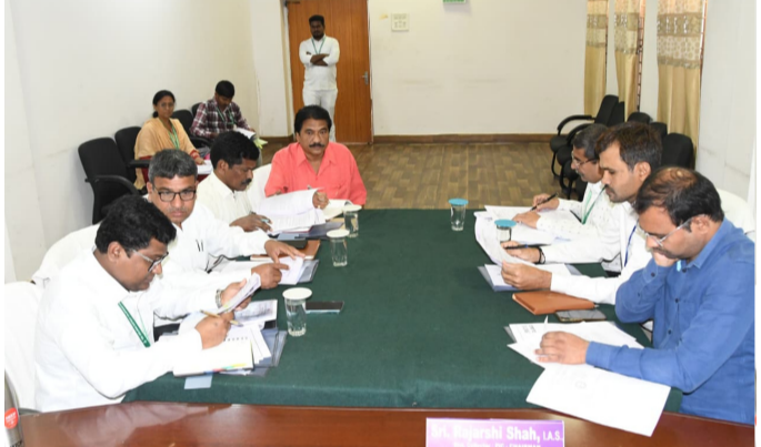
సమావేశానికి హాజరైన ఉమ్మడి జిల్లా అధికారులు

ఈ సందర్భంగా జిల్లా కలెక్టర్, డిఎల్ఈసీ చైర్మన్ మాట్లాడుతూ, డిసెంబర్ 31, 2025తో ముగిసిన త్రైమాసికానికి సంబంధించి పారామీటర్లు 'టర్న్ అరౌండ్ ప్లాన్' పురోగతిపై నిర్ణీత లక్ష్యాలను సకాలంలో చేరుకోవాలని ఆదేశించారు. అభివృద్ధి సూచికలలో పురోగతి సాధించేందుకు ప్రణాళికాబద్ధంగా ముందుకు సాగాలని, టెండర్లు, క్షేత్రస్థాయి పనుల పర్యవేక్షణలో ఏమరపాటు ఉండకూడదని