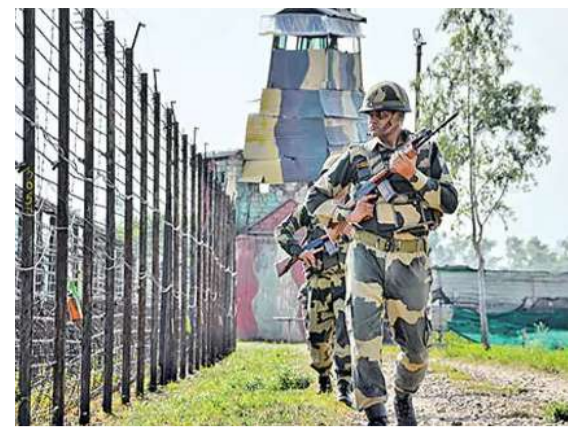
సరిహద్దుల్లో 'పబ'తో చైనా కుట్రలు భగ్గం.. ఆర్మీ అధికారి >> 3లో

హైదరాబాద్ (తేదీ) 19-02-2026 (వారం) గురువారం సంపుటి: 02 || సంచిక: 49 || పేజీలు-6 www.ekaburu.com